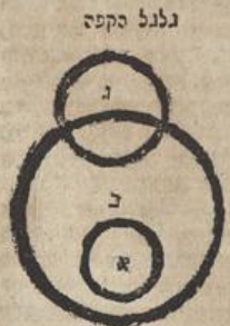
גלגל הקפה גלגל יוצא מרכז

ובהתחליותיה - בהיסודות שלה : (ב) גלגל יוצא מרכז וגלגל הקפה - דע כי כל גלגל מכלול' כוכבי לכת יש לכל אחד גלגל יוצא מרכז וגלגל הקפה - ובה א"י לך כן כן גלגל יוצא מרכז ומרכז העולם כזה - והנה הגלגל הקטן שהוא בתוך הגלגל הגדול למטה קרא גלגל העולם ומרכזו שהיא נקודת ה' היא הארץ - וגלגל הגדול קרא גלגל יוצא מרכז לפי שהארץ אינה עומדת כאמצעיתו רק שמרכזו והיא נקודת ב' יוצא מתחוק ומרכזו העולם שהיא הארץ - כי לעולם הנקודה האמצעית וגלגל או העיגול היא המרכז - וגלגל הקפ' הוא הגלגל הסובב תוך עובי גרם הגלגל הגדול ועיין ספ' כ"ד לח' בסופר המורה ספ' האפודי ורש"ט : (ג) מן האמצע ואל האמצע וכו' - פי' תנועות הן בעולם וכל אחת מתנועות אל תקום טבע - הא' היא מן האמצע והוא יסוד האש והאזייר ונקראים מן האמצע לפי שהם מתרחקים מתנועתם מן טבע הארץ שהיא האמצע הגלגלים וזהו הטעם במחלט שהוא תקום טבע והרליה אם תקח גוש עפר ותורקו למעלה ירד ויפול למטה על הארץ - אבל יסוד האש והאזייר מתנועע' תמיד למעלה שהוא תקום טבעם והרלי' כשתדלק הגר יעלה השלכת למעלה ואף אם תטה הגר למטה לצד הארץ אף ע"כ יעלה