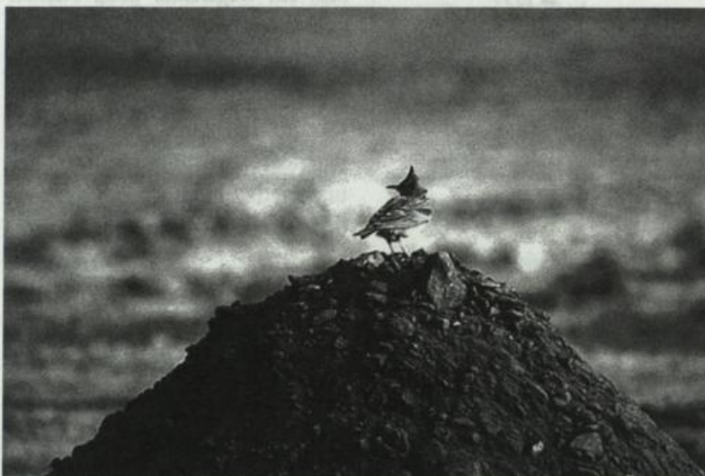
Abb. 4: Typische Singwarte der Haubenlerche auf Baustellen. Dürrenhofe, April 1999. Fig. 4: Typical song post of Crested Larks on building sites.

großflächigen und zeitgleichen Bestandsabnahme wird dort in den Auswirkungen der Eutrophierung durch übermäßige Einträge von stickstoffhaltigen Substanzen gesehen, die durch stärkeres Vegetationswachstum die Lebensraumqualität für die Haubenlerche verschlechtern (SCHERNER 1996, ZANG & SÜDBECK 2000). Das schnellere und höhere Pflanzenwachstum bewirkt ein zunehmend feuchteres und kühleres Bodenklima, in dessen Folge eine Reduzierung des Bruterfolges durch eine höhere Jungvogelsterblichkeit, der auf trockenwarme Plätze angewiesenen Art nachgewiesen werden konnte (SCHERNER 1996). So verschwand die Haubenlerche im westlichen Mitteleuropa fast vollständig aus dem