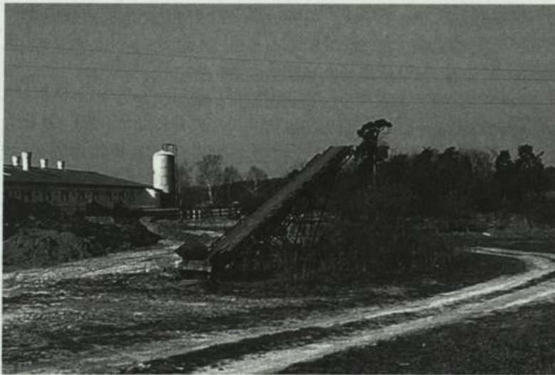
Abb. 3: Betriebsflächen von Großtierstallungen - dominierender Lebensraum der Haubenlerche im UG. Kossenblatt, April 1999. Fig. 3: Stableyards - the dominating habitat of Crested Larks in the study area.