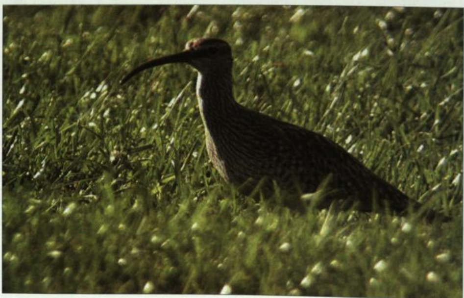
Abb. 10: Regenbrachvogel, Wolsier/HVL, Mai 2002.

Fig. 9: Reeve , Güstebieser Loose/MOL, April 2002.