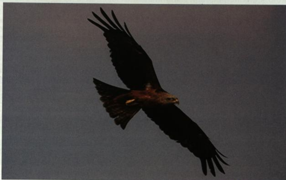
Abb. 7: Schwarzmilan, Neuenhagen/MOL, Juni 2002.