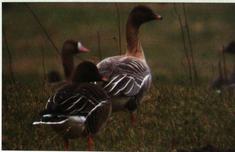
Abb. 4: Kurzschnabel- gans, Altvogel, Göttlin/ HVL, März 2002.

Fig. 3: Black Stork, Oder meadows Kienitz/MOL, July 2002.