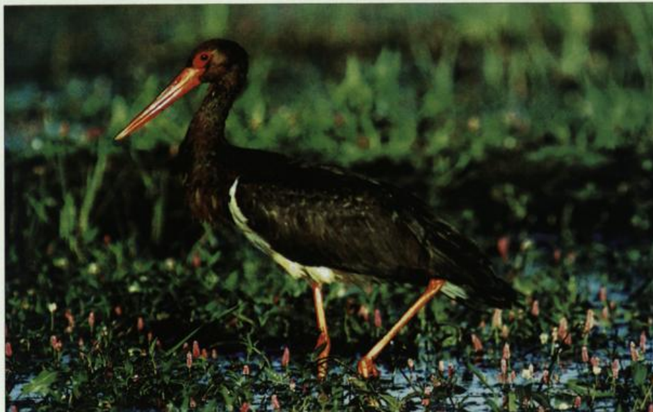
Abb. 3: Schwarzstorch, Oderwiesen Kienitz/ MOL, Juli 2002.

Fig. 2: Great Bittern, Havel meadows Parey/ HVL, March 2002.