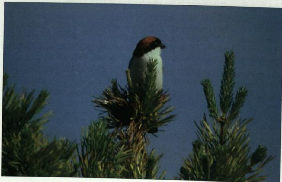
Abb. 16: Rotkopfwürger, Männchen, TÜP Lieberose/SPN, Juni 2002.

Fig. 15: Nuthatch, Wriezen/MOL, December 2002.