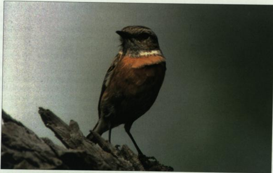
Abb. 14: Schwarzkehlchen, Weibchen, Tagebau Meuro/OSL, Mai 2002.

Fig. 14: Female Stonechat, opencast mining area Meuro/OSL, May 2002.