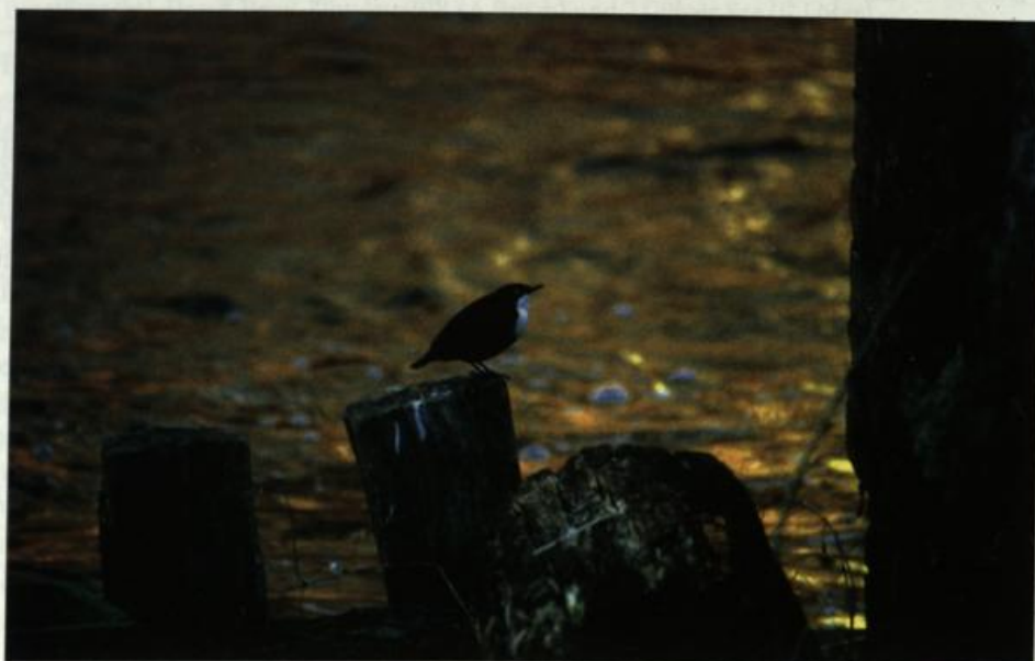
Fig. 13: Dipper , Schlaube Ragower Mühle/LOS, February 2002.