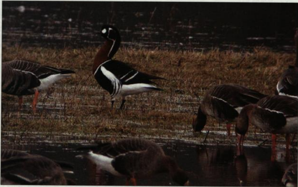
Abb. 5: Rothalsgans, Altvogel, Gülpe/HVL, März 2002.