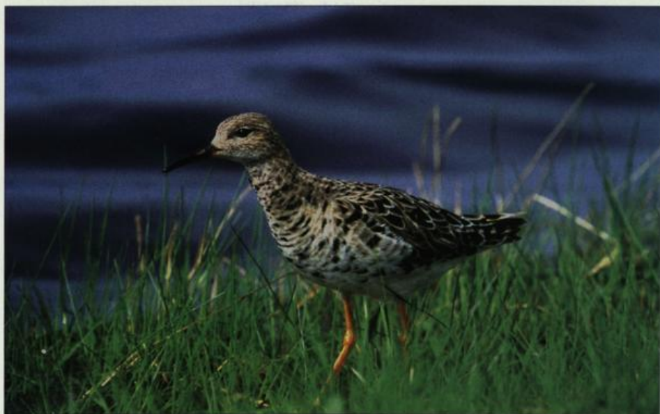
Abb. 9: Kampfläufer, Weibchen, Güstebieser Loose/MOL, April 2002.

Fig. 8: Immature Kestrel , Gieshof/MOL, August 2002.