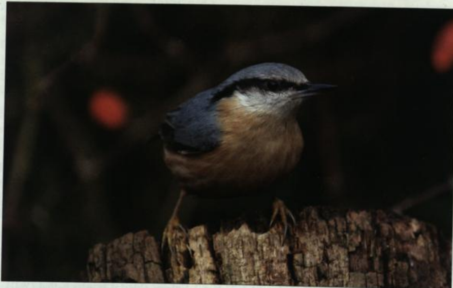
Abb. 15: Kleiber, Wriezen/MOL, Dezember 2002.

Fig. 14: Female Stonechat, opencast mining area Meuro/OSL, May 2002.