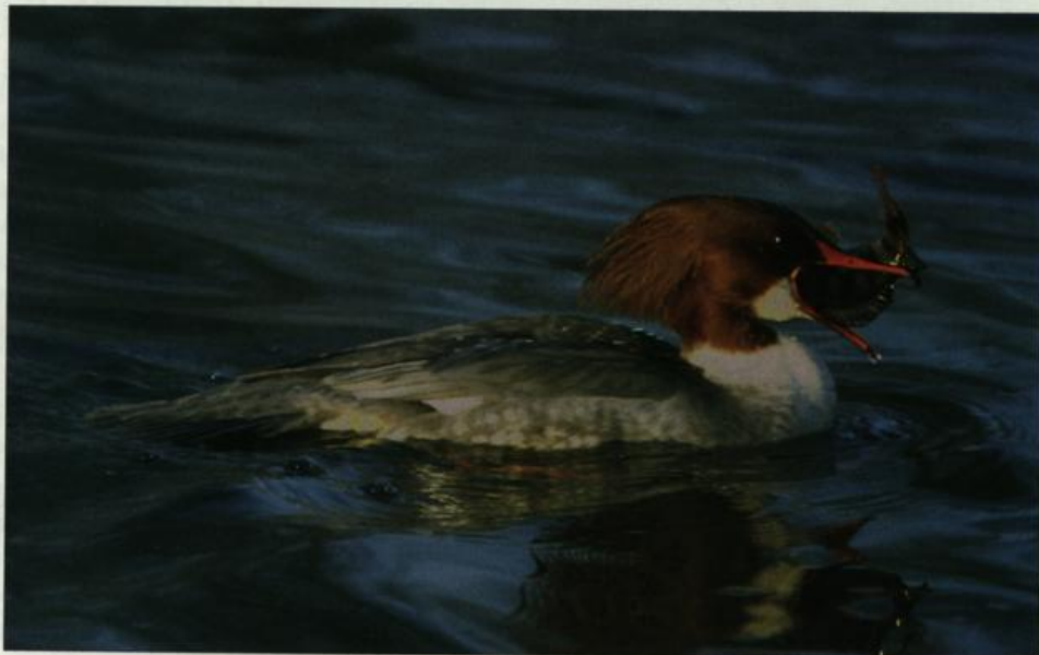
Abb. 6: Gänsesäger, Weibchen mit Flussbarsch, Neufriedland/MOL, Januar 2002.