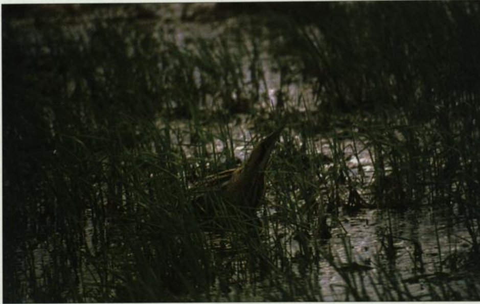
Abb. 2: Rohrdommel, Havelniederung Parey/ HVL, März 2002.

Fig. 2: Great Bittern, Havel meadows Parey/ HVL, March 2002.