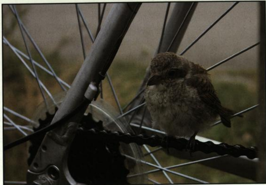
Fig. 16: Juvenile Red-backed Shrike, Berlin-Hohenschönhausen, August 2004.