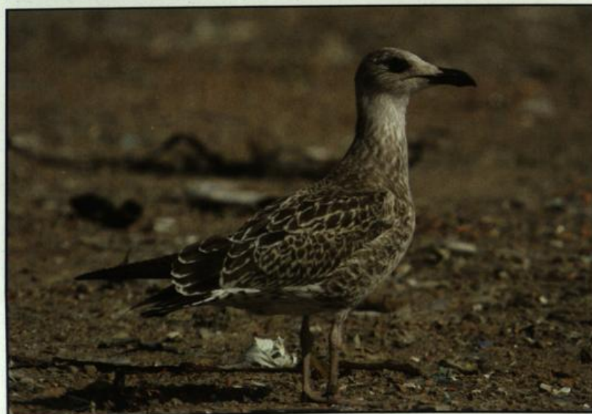
Abb. 13: Mittelmeermöwe, 1. Kalenderjahr, Deponie Eberswalde/BAR, Juli 2004.

Fig. 12: Second year Mediterranean Gull, Eberswalde, April 2004.