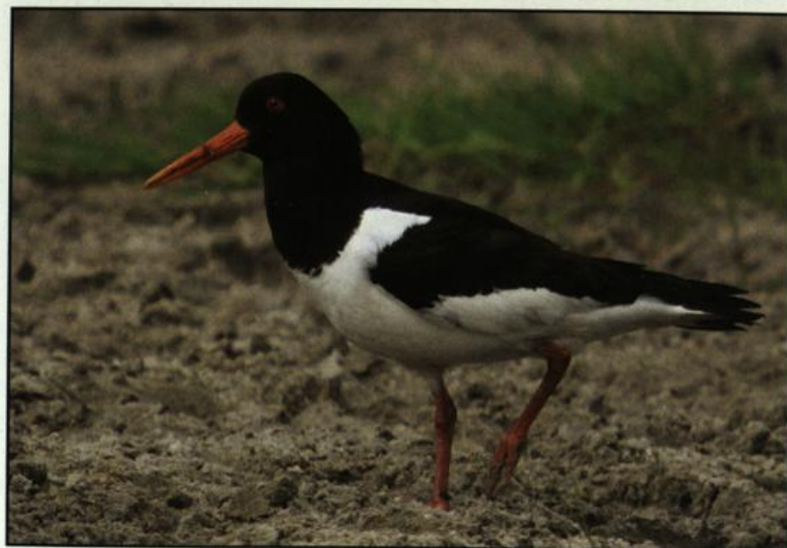
Abb. 7: Austernfischer, bei Genschmar/MOL, Mai 2004.

Fig. 6: First year Red-footed Falcon, Schwanebeck, August 2004.