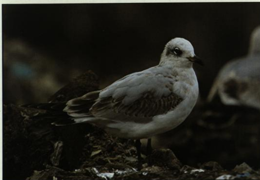
Abb. 12: Schwarzkopfmöwe, 2. Kalenderjahr, Deponie Eberswalde/BAR, April 2004.

Fig. 11: Adult Mediterranean Gulls, Eberswalde, May 2004.