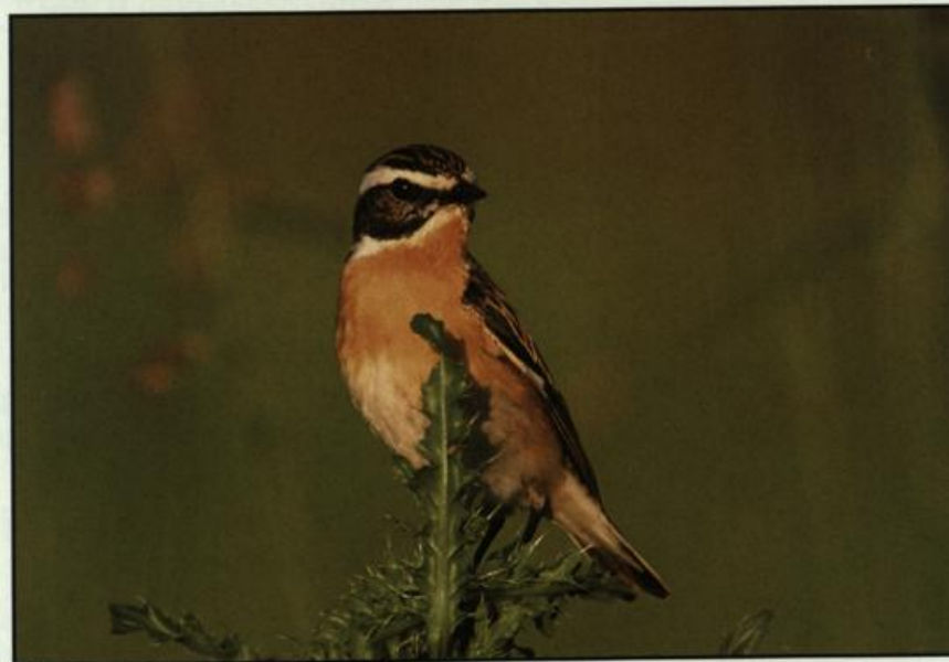
Abb. 18: Braunkehlchenmännchen, Neulewin/MOL, Juni 2004.

Fig. 17: Crested Lark, Neulewin, October 2004.