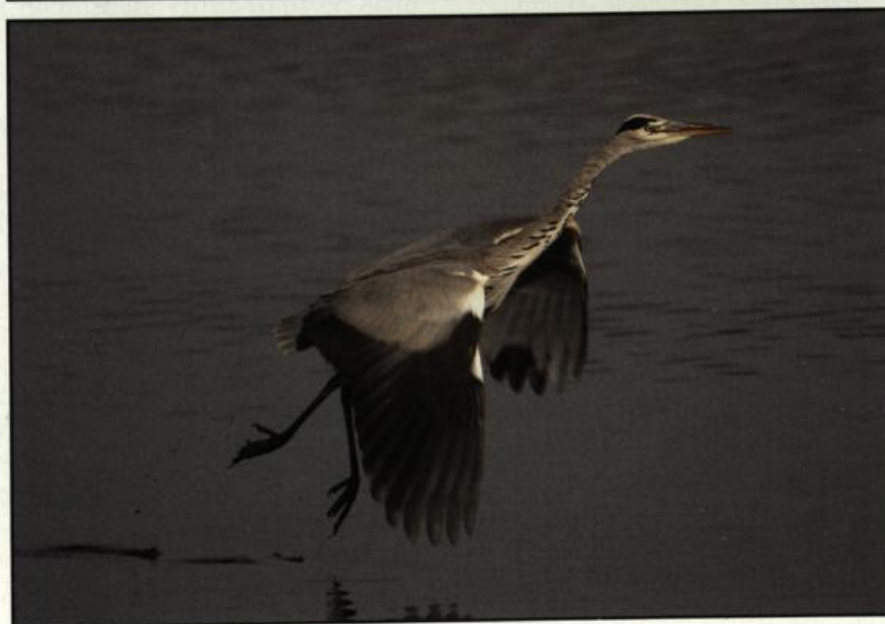
Fig. 4: Grey Heron, Fishponds Altfriedland, October 2004.