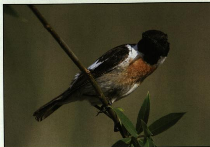
Abb. 19: Schwarzkehlchenmännchen, Wriezen/MOL, Mai 2004.

Fig. 18: Male Whinchat, Neulewin, June 2004.