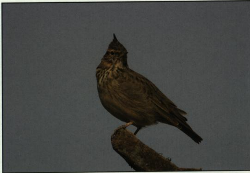
Abb. 17: Haubenlerche, Neulewin/MOL, Oktober 2004.

Fig. 17: Crested Lark, Neulewin, October 2004.