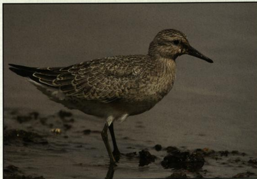
Fig. 10: First year Knot, Neurüdnitz, August 2004.