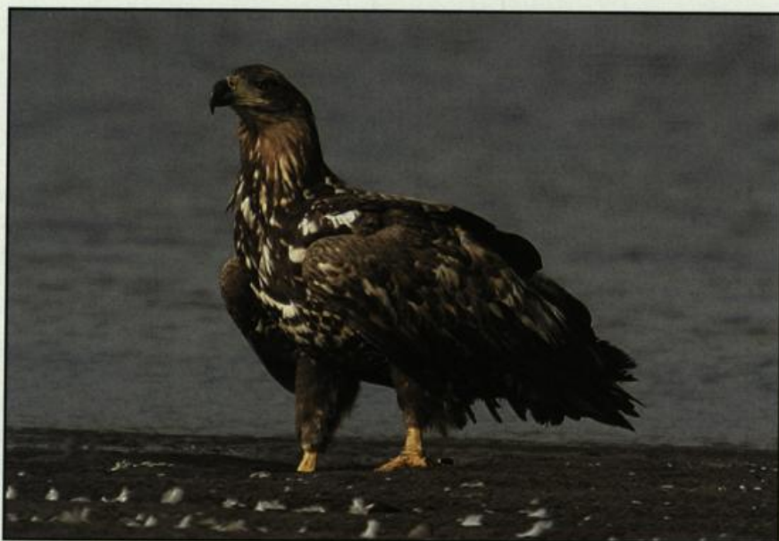
Abb. 5: Immaturer Seeadler, Altfriedländer Teiche/MOL, November 2004.

Fig. 5: Immature White-tailed Eagle, Fishponds Altfriedland, November 2004.