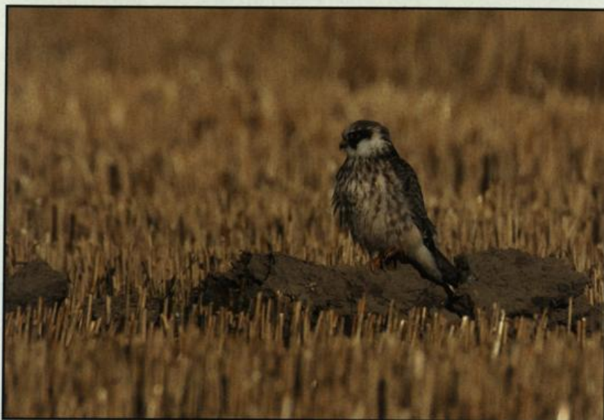
Abb. 6: Rotfußfalke im ersten Kalenderjahr, Schwanebeck/BAR, August 2004.

Fig. 5: Immature White-tailed Eagle, Fishponds Altfriedland, November 2004.