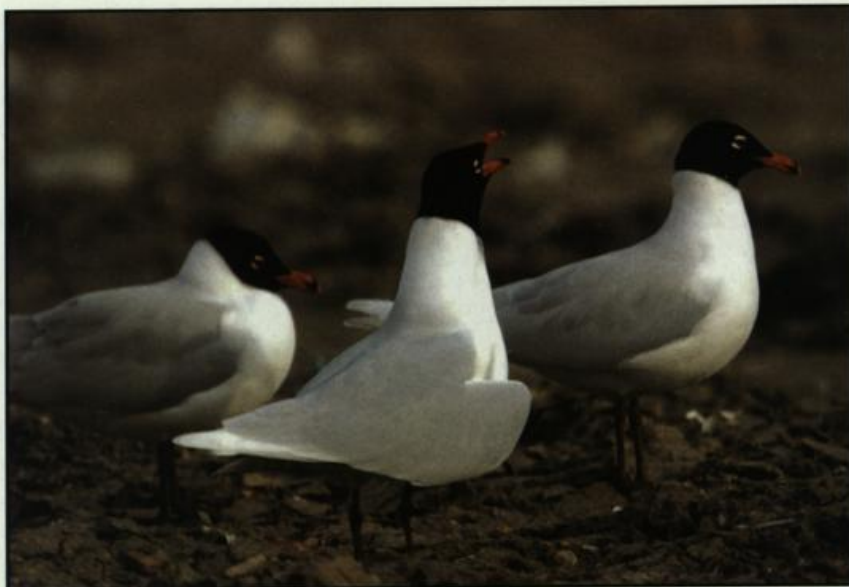
Abb. 11: Adulte Schwarzkopfmöwen, Deponie Eberswalde/BAR, Mai 2004.

Fig. 11: Adult Mediterranean Gulls, Eberswalde, May 2004.