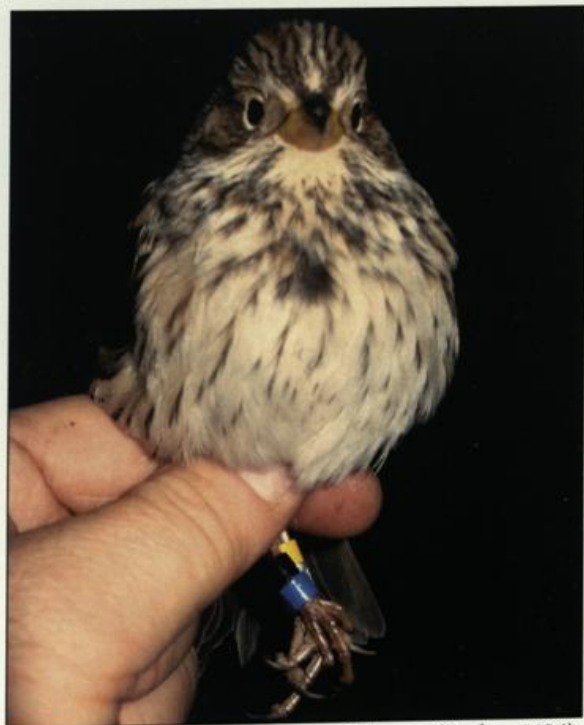
Farbmarkiertes Grauammerweibchen (Code 1486), Pessin/HVL, 23.12.08.

Meldungen bitte an H. Watzke, Tel.: 033237-85244; E-Mail: miliaria@t-online.de.