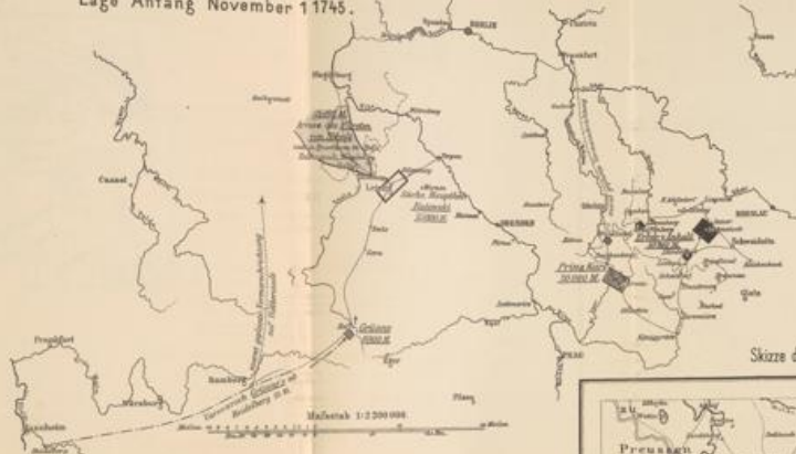
Lage Anfang November 1745.