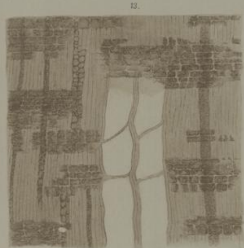
R. Triebel n. d. Not. ger.