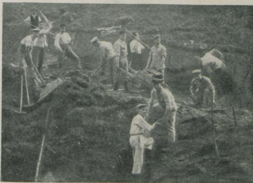
Beim Wegebau in Walzenhausen.

das Bewußtsein zurück, daß sie nicht mehr nur Almosenempfänger sind, sondern aus eigener Kraft wieder schaffen und einen Posten im Dienste eines Gemeinwesens wieder ausfüllen können.