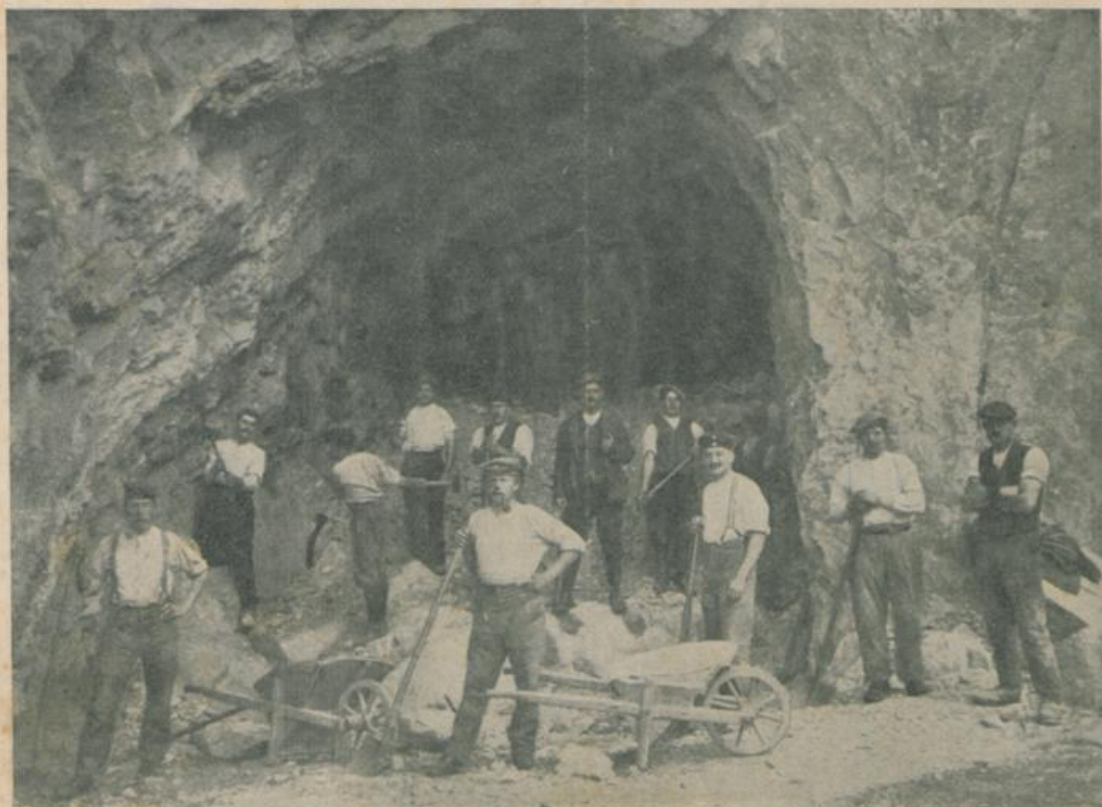
Curaglia – Internierte als Arbeiter am Lukmanier-Tunnel.

sein mitnehmen, daß sie nicht nur mit Worten ihre Dankesschuld der gastfreien Schweiz gegenüber anerkannt haben, sondern auch versucht haben, einen Teil dieser Schuld mit ihrer Hände Arbeit abzutragen.