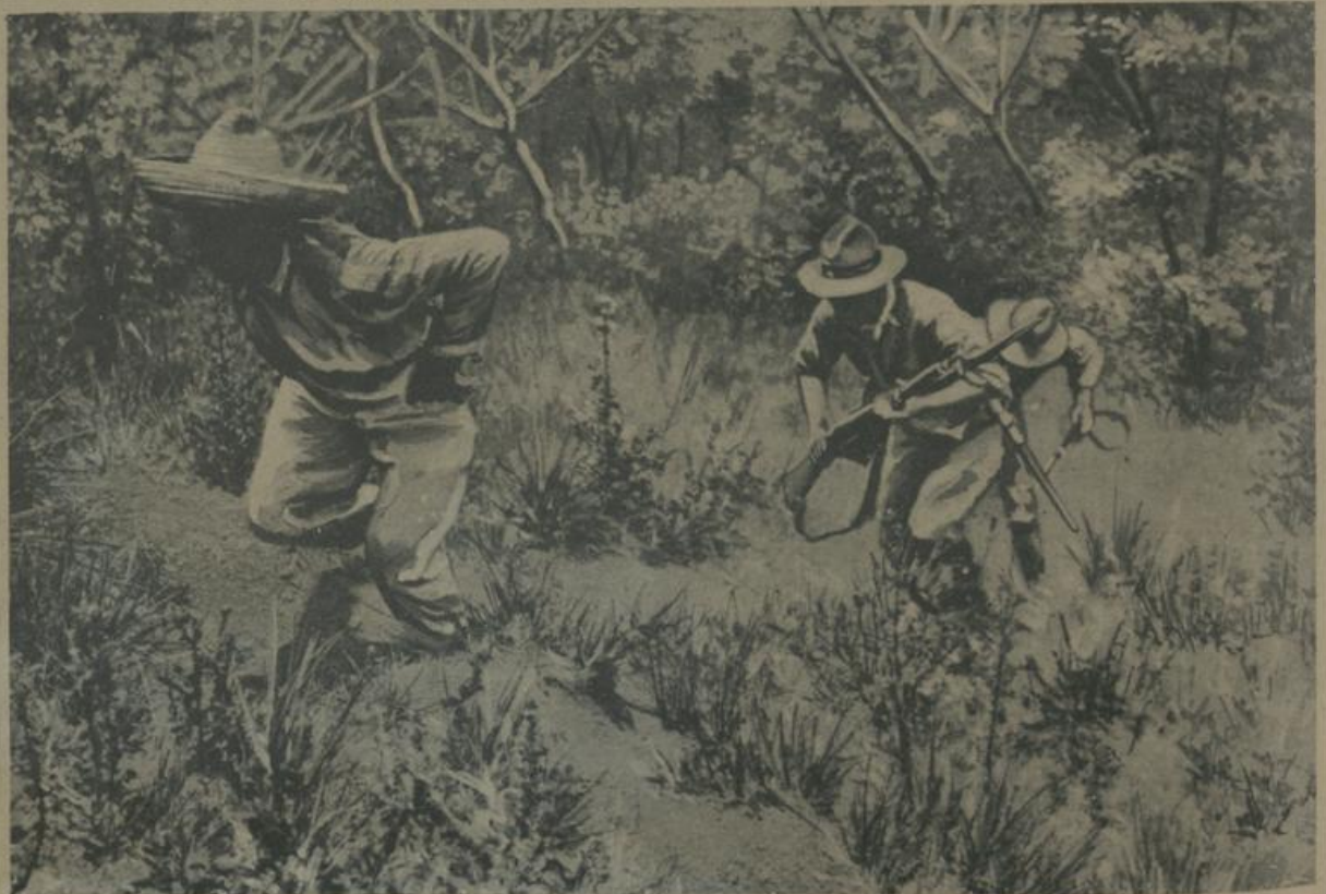
דער סכסוך צווישען אמעריקא און מעקסיקא. דאס נאכיאנען אין די וויסטע אַ מעקסיקאנישען רעוואלוציאנער. Zum amerikanisch-mexikanischen Konflikt. Verfolgung eines mexikanischen Rebellen in der Wildnis.