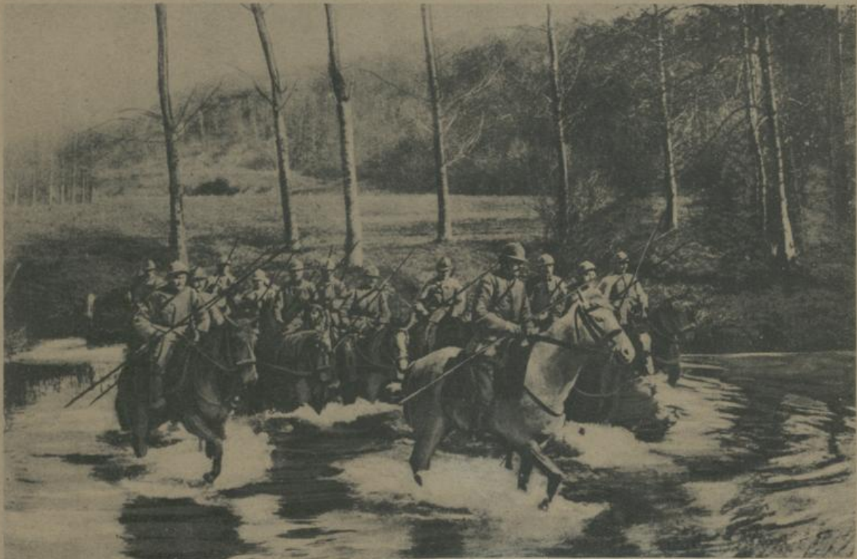
א פאטרול פון פראנצויזישע קאואלערי איבערנעמען א טיך. Französische Kavallerie-Patrouille durchquert einen Bach.