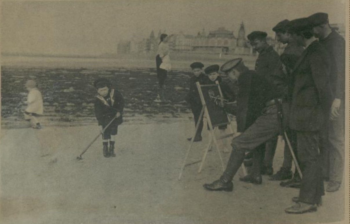
א דייטשער מארינעסאלדאט כײַם צײַכען אויס'ן ברעג סוף אָסטענדע Ein deutscher Marinesoldat beim Zeichnen am Strand von Ostende.