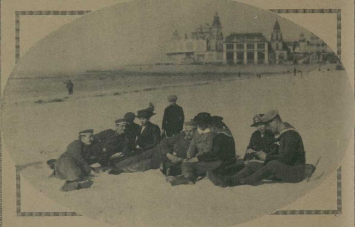
Deutsche Marinesoldaten in Ostende.