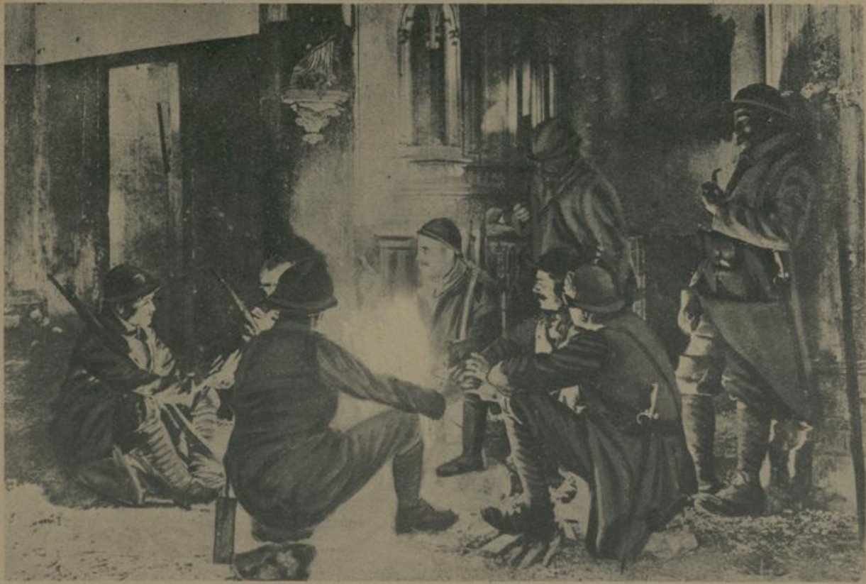
די פראנצויזישע סאלדאטען אין א קירכע נאָנט פון ווערדון. Französische Soldaten in einer Kirche in der Nähe von Verdun.