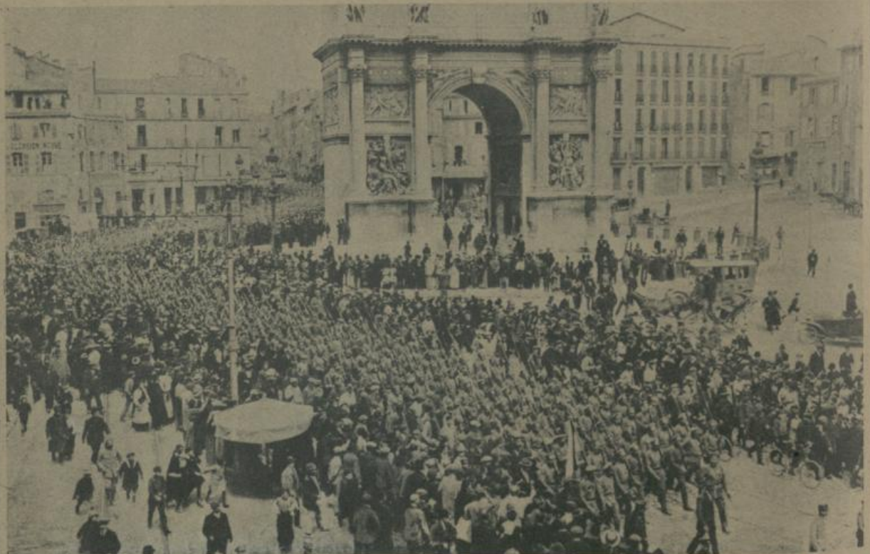
די ערשטע רוסישע סאלדאטען אין מארסעל. Die ersten russischen Soldaten in Marseille.