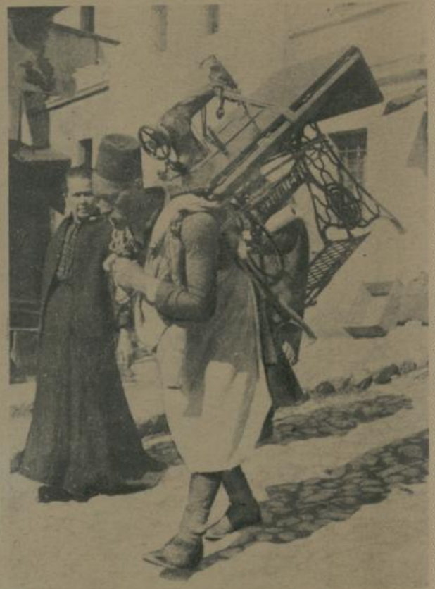
אויס באָסניאַ. שיפען פון דער טאַמעראַנער-נענענד אין סעראַיעוו. Aus Bosnien. Typen aus dem Mohammedanerviertel in Serajewo.