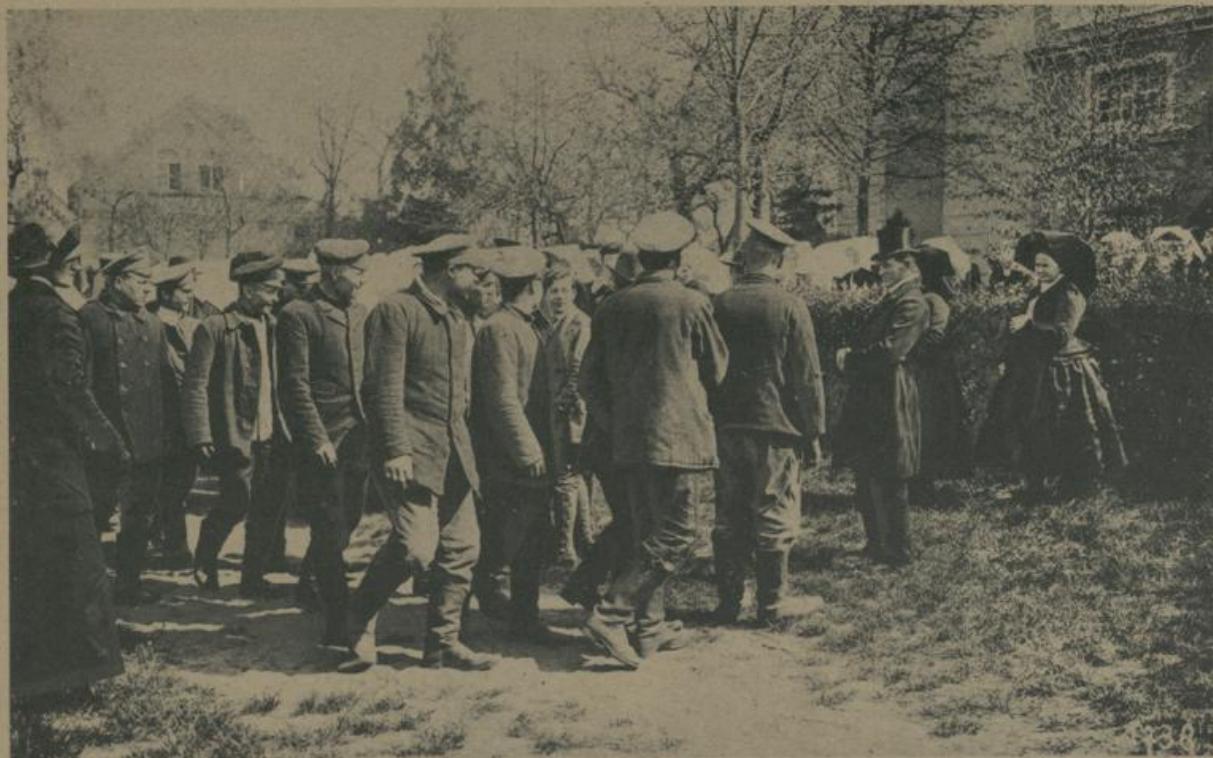
די רוסישע געפאנגענע געהען און די קירכע קיין בורג אין שפרעוואלד. Russische Gefangene nach dem Gottesdienst in der Kirche zu Burg im Spreewald.