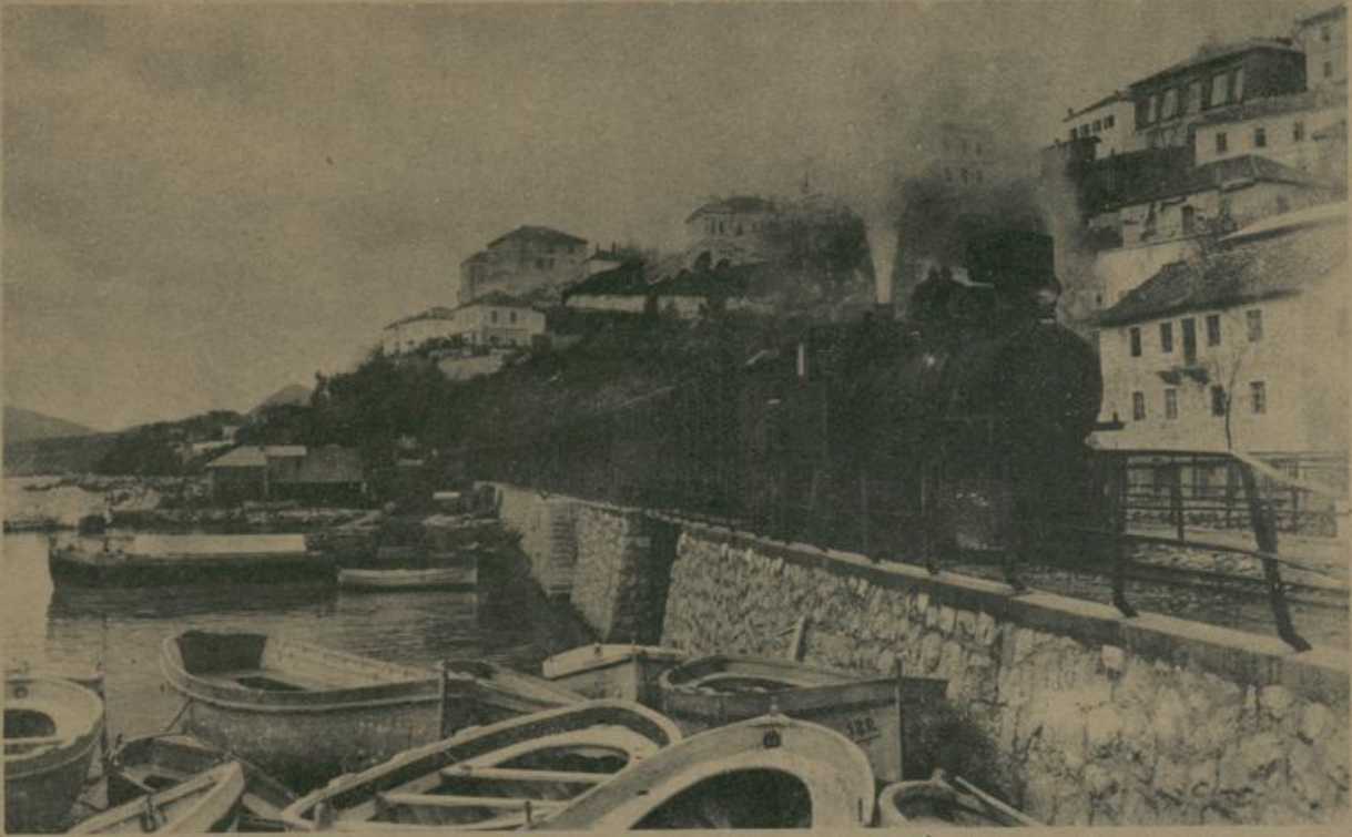
אויס דאלמאציען. קאסטעלנאָוואָ אָן דעם עסטערייכישען אַדריאַ־זייטן. Aus Dalmatien. Castelnuovo an der österreichischen Adria-Küste.