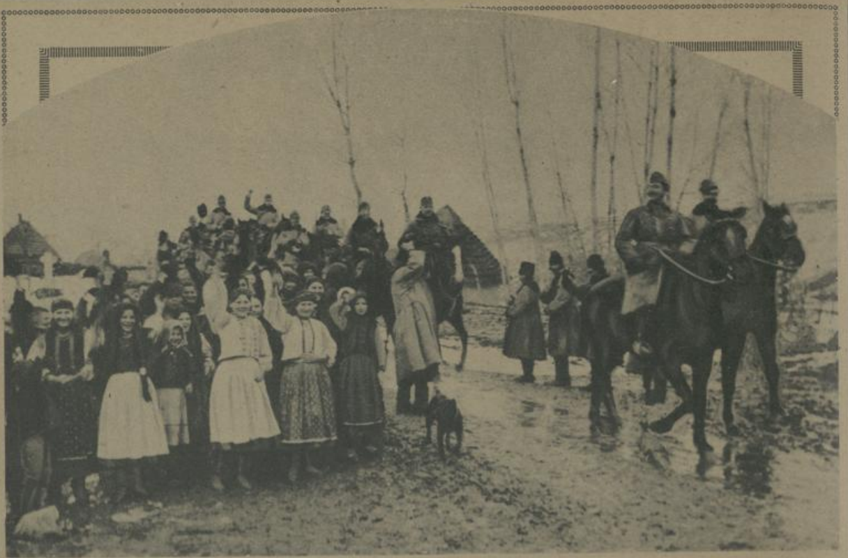
די רוסישע איינוואוינער סתים אקטובערס געגענד בעניסען דאס אַנקומען פון עסטערייכישע אולאנען. Russische Bevölkerung aus dem besetzten Gebiet begrüßt einrückende österreichisch-ungarische Ulanen.