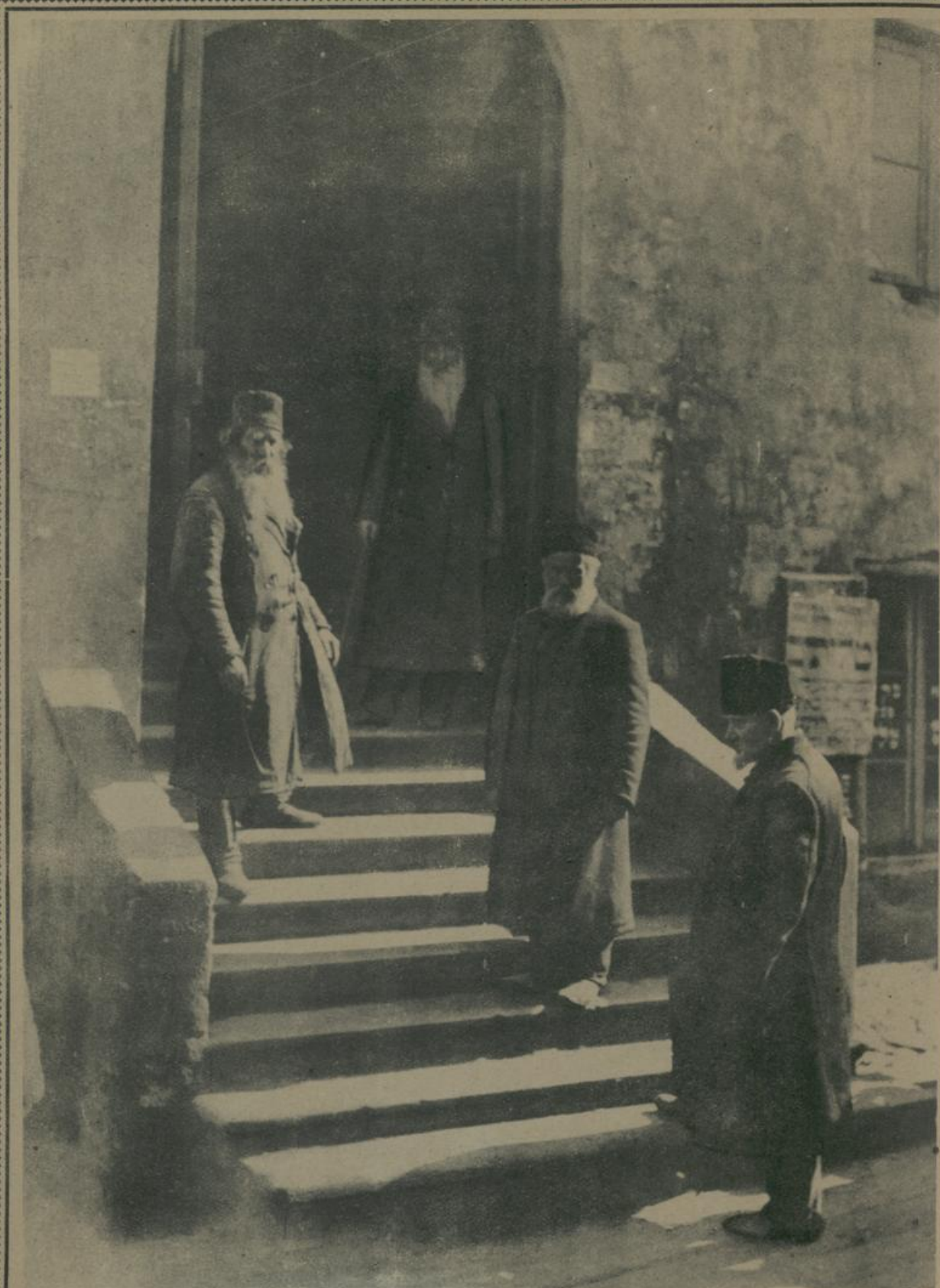
דער איינגאנג צו דער יודישער שולע אין ווילנא. Ausgang zur Judenschule in Wilna.