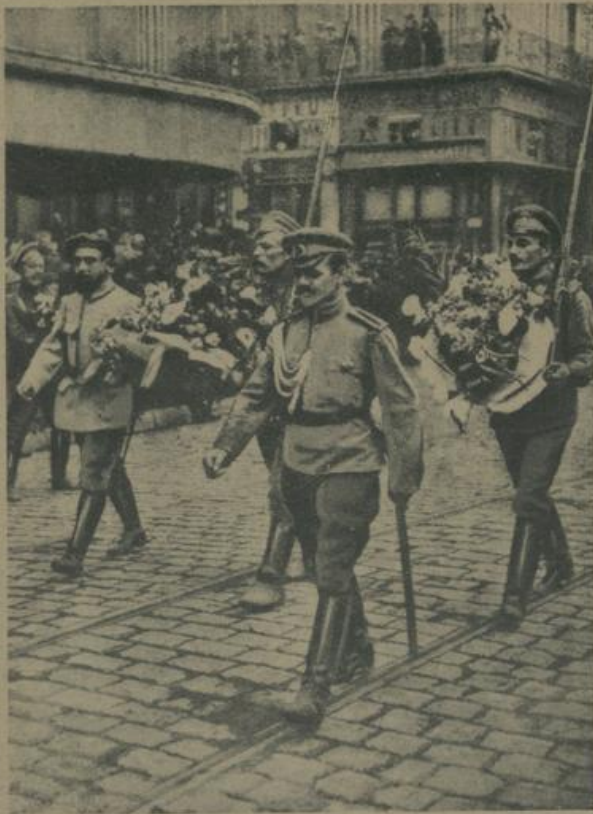
פראנצויזישע טרופען מארשירען דורך די גאסען פון סאלאניקי. Französische Truppen marschieren durch die Straßen Salonikis.