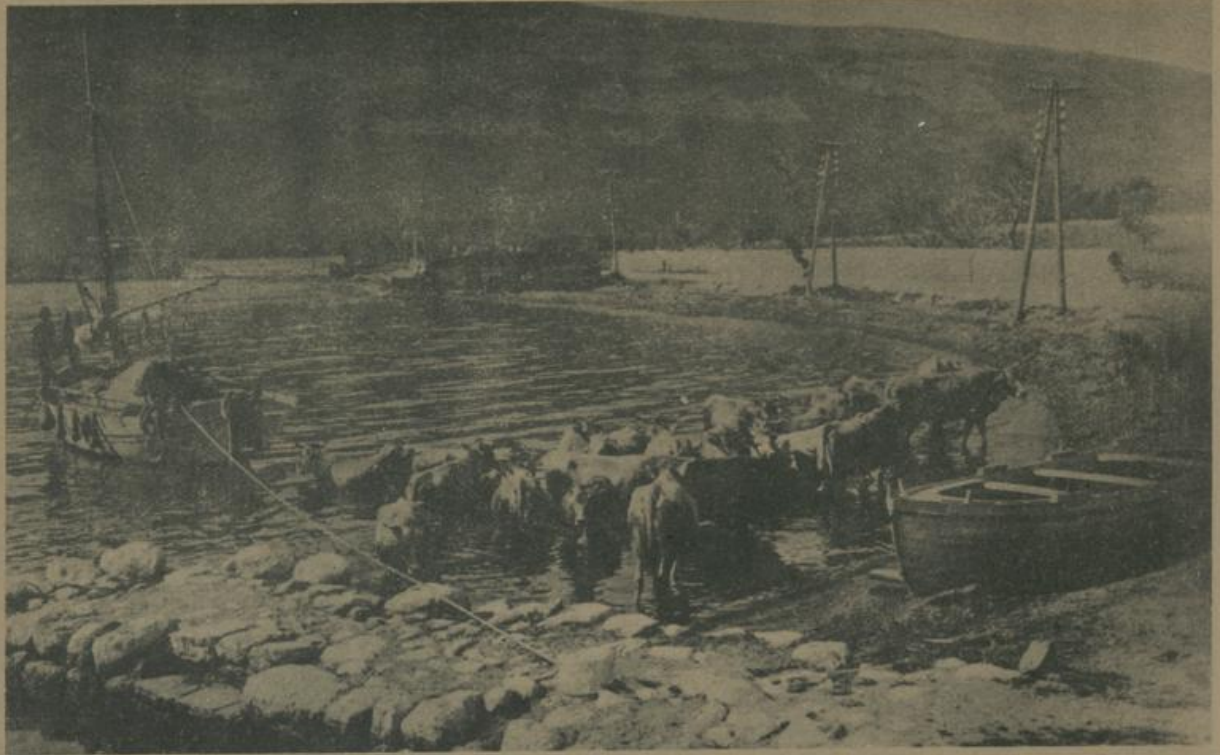
ביי די באָר די קאטאראָ. דאָס באַדען פון שעכט בהמות אין וואַסער. An der Bocche di Cattaro. Schlachtvieh beim Baden im See.