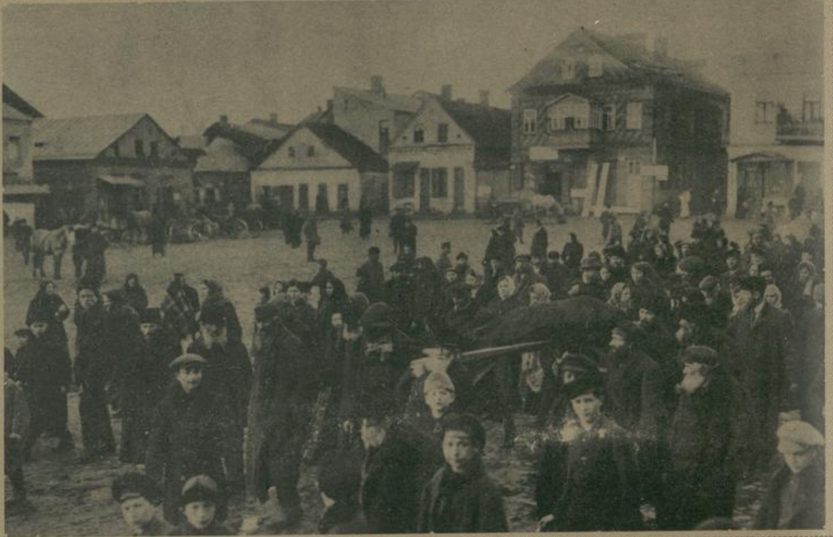
די לויא סון א אנגעזעהענעם יוד אין לידא, וואָס ווערט געטראָגען אויף אַ מיטל צום בית הקברות. Beerdigung eines angesehenen Juden in Lida, der auf einer Tragbahre zum Friedhof gebracht wird.