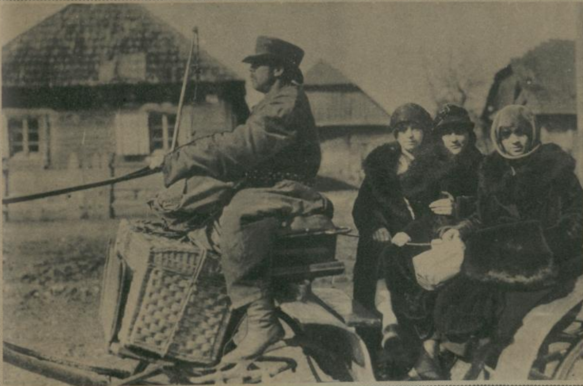
פוילישע מעדכען ביים פאָהרען צום וואָקאל. Polnische Mädchen auf der Fahrt zum Bahnhof.