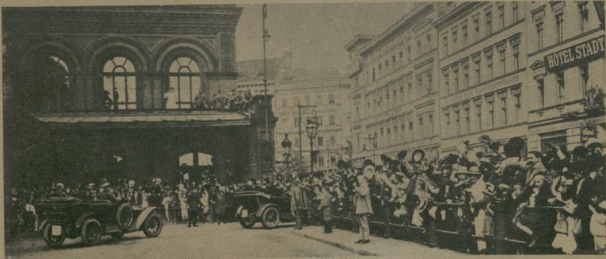
די געסט ווערען בעגריסט פון די איינוואוינער אויסן אנהאלטער וואקאל אין בערלין. Begrüßung der Abgeordneten durch die Berliner Bevölkerung am Anhalter Bahnhof zu Berlin.

Die bulgarischen Abgeordneten bei ihrem Aufenthalt in Dresden während einer Elbfahrt.