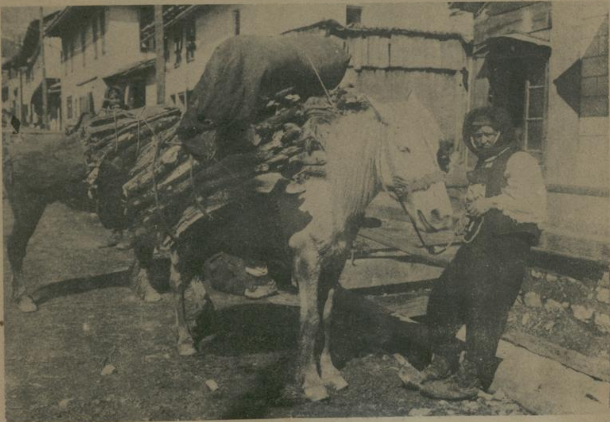
אויס באָסניאַ. מאַחמעדאָנער־נענט אין סאַראַיעוו. Aus Bosnien. Mohammedanerviertel von Sarajewo.