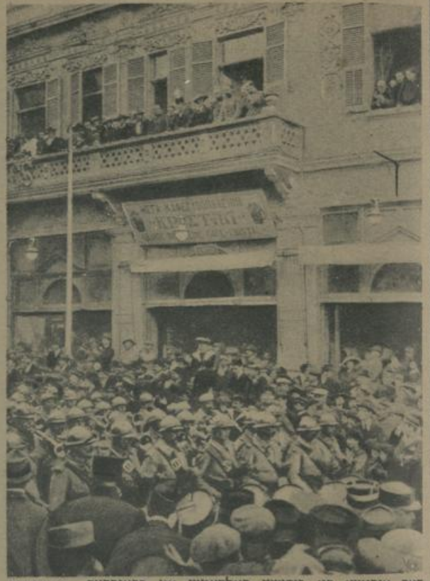
דאס אנטקומען פון רוסישע סאלדאטען אין פראנקרייך. די ערסטע רוסישע סאלדאטען מארשירען דורך די גאסען פון מארסעל. Antunft russischer Soldaten in Frankreich. Die ersten russischen Soldaten marschieren durch die Straßen von Marseille.