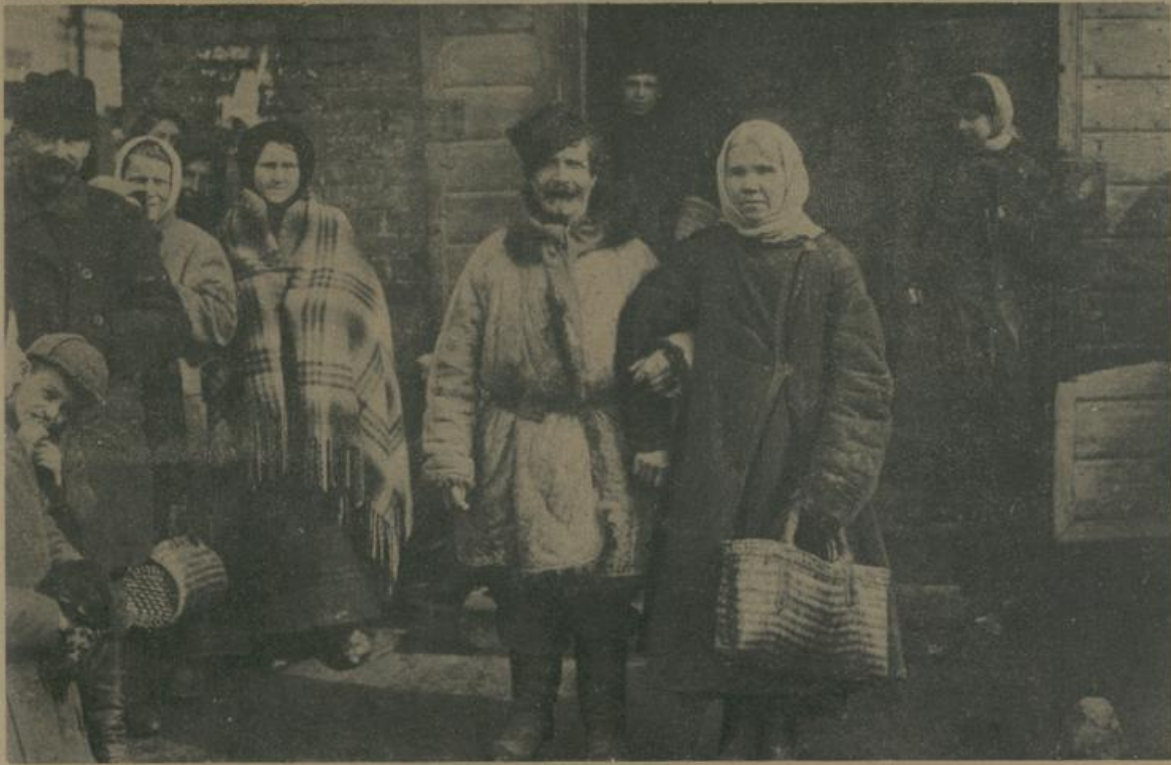
א פוילישעס פויערענדפאר אויסן וואכען מארק אין לידא. Polnishes Bauernhepaar auf dem Wochenmarkt zu Lida.