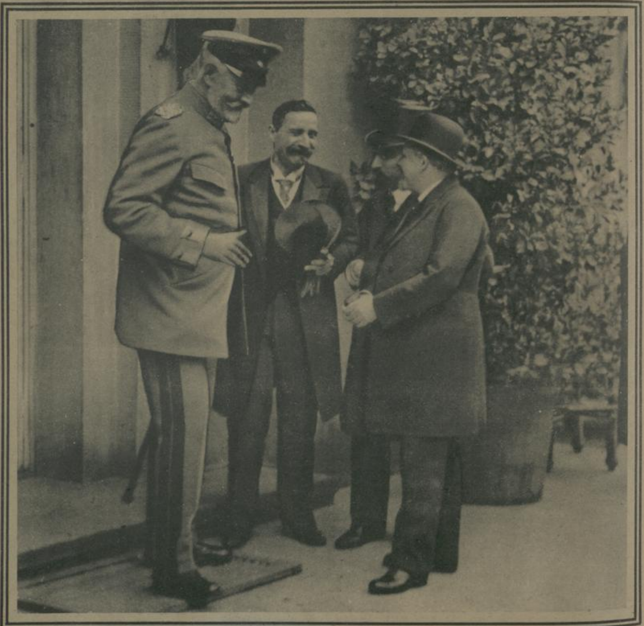
צום בערך סוף די בולגארישע סאבראניע-דעלעגירטען אין בערלין. דער דייטשער רייכסקאנצלער סאן בעטמאן האלועג אין רעדען מיט דעם בולגארישען פאסאל אין בערלין ריזאוו און בולגארישע דעלעגירטען. Zum Besuch der bulgarischen Sobranje-Abgeordneten in Berlin. Der deutsche Reichskanzler v. Bethmann Hollweg im Gespräch mit dem bulgarischen Gesandten Rizow und bulgarischen Abgeordneten.