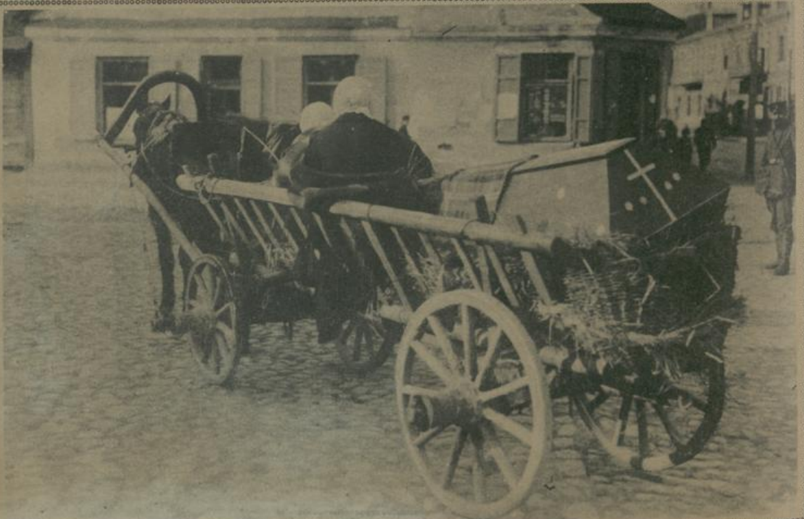
פּוילישע פּרויען פּיהרען אַ טאָל צום פּוילישען בית הקברות. Polnische Frauen bringen die Leiche eines Angehörigen nach dem polnischen Friedhof.