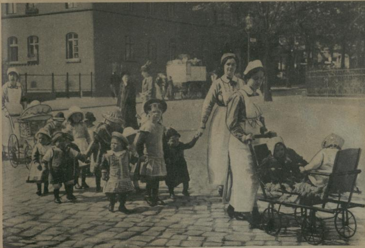
די הילפֿע פֿיר קריגס־קינדער אין בערלין. אַ געמײנזאַמער שאַציר פֿון קלײנע קינדער מיט אױרע ערצױערען. Fürsorge für Kriegskinder in Berlin. Gemeinsamer Spaziergang der kleinen Schützlinge mit ihren Pflegerinnen.