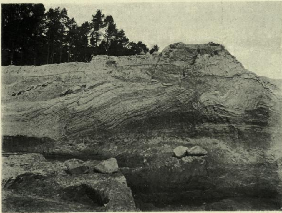
Figur 29. Gefaltete miocäne Letten und Sande am Nordabhange des Dachsberges östlich von Diensdorf.