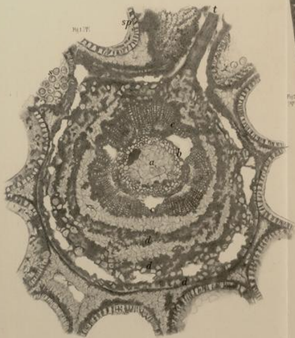
Stem of Juniperus communis