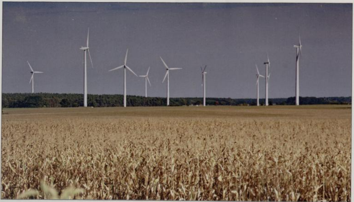
Abb. 9: Die ständig wachsende Zahl der Windräder und die massive Ausweitung des Maisanbaus beeinträchtigen nachhaltig die Lebensraumqualität der Großtrappen in Brandenburg. Nach der Errichtung eines Windparks auf der Zitzer Hochfläche (2003, Kreis Potsdam-Mittelmark, Foto) haben die Tiere nicht nur diesen Brutplatz und wichtigen Wintereinstand räumen müssen, sondern meiden seitdem bis auf eine kleine Restfläche das gesamte Brandenburger EU-SPA Fiener Bruch.

Fig. 9: The constantly growing number of wind engines and the massive growing of maize strongly worsen the habitat quality of Great Bustards in Brandenburg. After the installation of a wind farm on the Zitzer plateau (2003, district Potsdam-Mittelmark, picture) the birds not only had to evacuate this breeding area and important wintering ground but also avoid the entire EU-SPA Fiener Bruch except for small remnants.