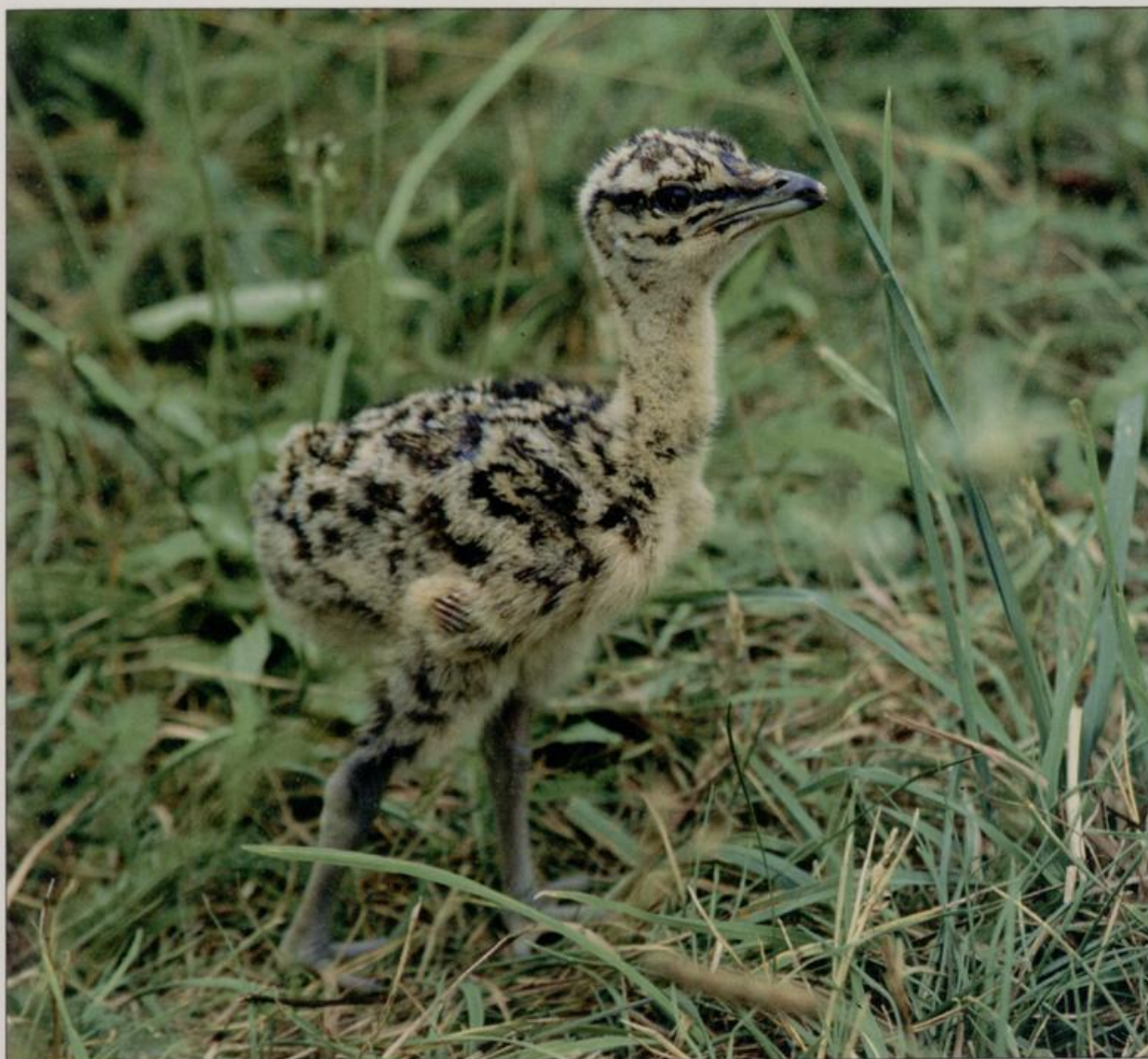
Abb. 8: Großtrappenküken, etwa sieben Tage alt.