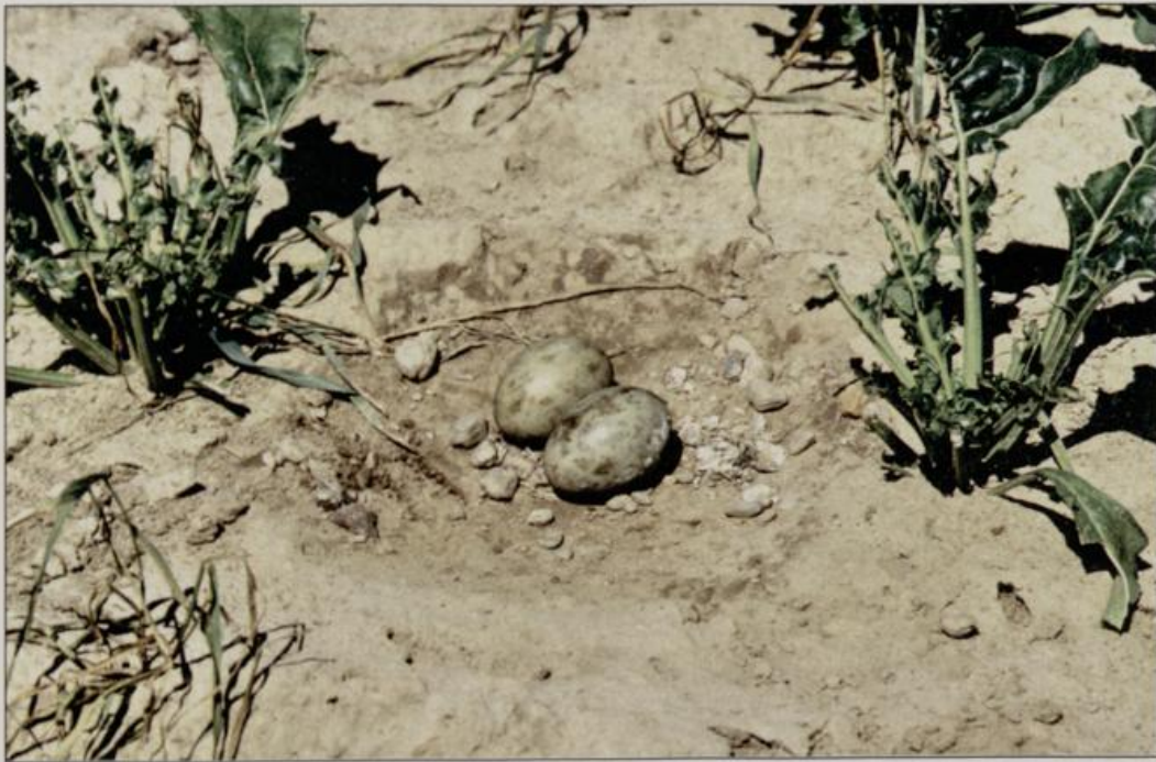
Abb. 6: Vor 1990 gehörten Kartoffel- und Rübenäcker zur normalen Fruchtfolge im Lebensraum der Großtrappen, sie wurden gerne zur Brut aufgesucht. Der Gelegeschutz war wegen der zahlreichen Arbeitsgänge auf diesen Kulturen sehr schwierig und erforderte großes Entgegenkommen bei den Landwirten.

Fig. 6: Before 1990 potato and beet fields were part of the usual crop sequence in the habitat of the Great Bustard; they were often used as breeding habitats. It was very difficult to protect clutches on these crops due to the frequent agricultural activities. Their protection required great accommodations of the farmers.