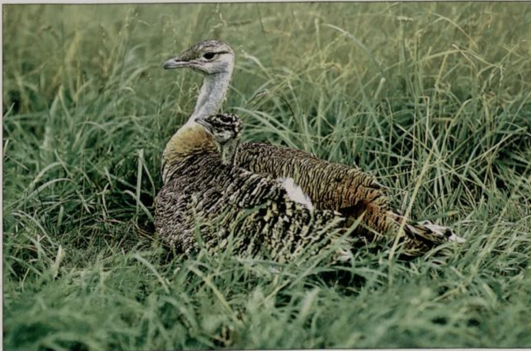
Abb. 7: Störungsarme Brutplätze sind eine wichtige Voraussetzung für eine gesunde Entwicklung der Trappenküken. Notwendig ist eine mindestens achtwöchige Wirtschaftsruhe. Erst dann ist der Nachwuchs stark genug, um bei Störungen ausweichen zu können.

Fig. 6: Before 1990 potato and beet fields were part of the usual crop sequence in the habitat of the Great Bustard; they were often used as breeding habitats. It was very difficult to protect clutches on these crops due to the frequent agricultural activities. Their protection required great accommodations of the farmers.