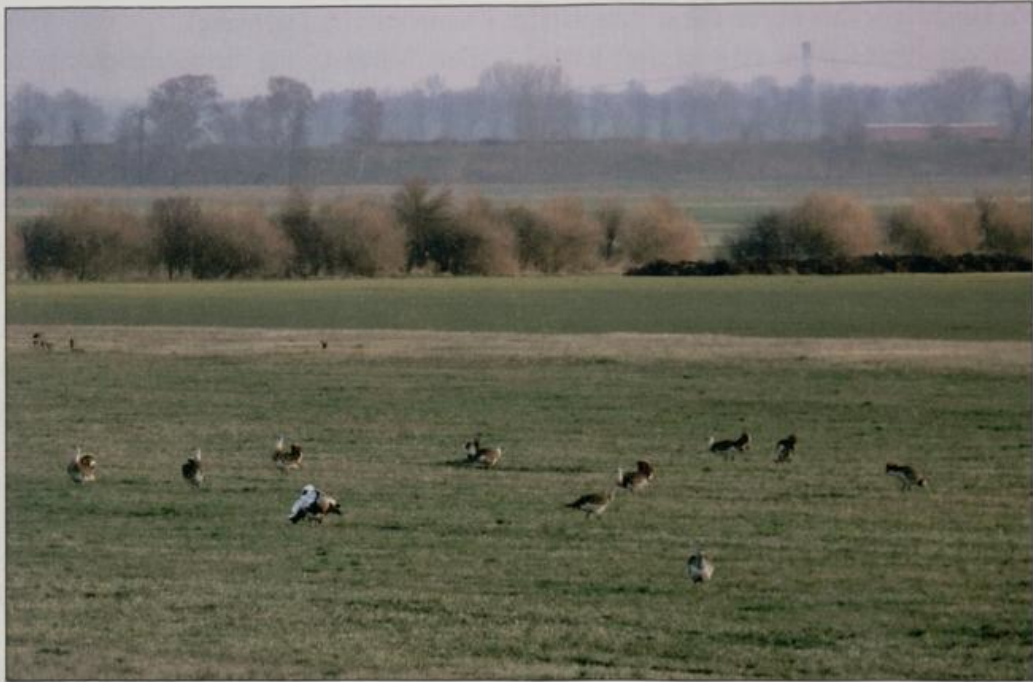
Abb. 4: Balzplatz nahe Garlitz/HVL.

Fig. 4: Mating territory near Garlitz/HVL.