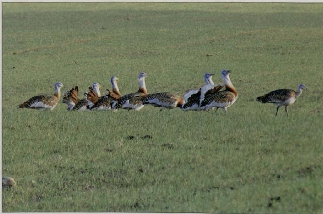
Abb. 5: Hahnengruppe, Balzplatz nahe Garlitz/HVL.

Fig. 4: Mating territory near Garlitz/HVL.