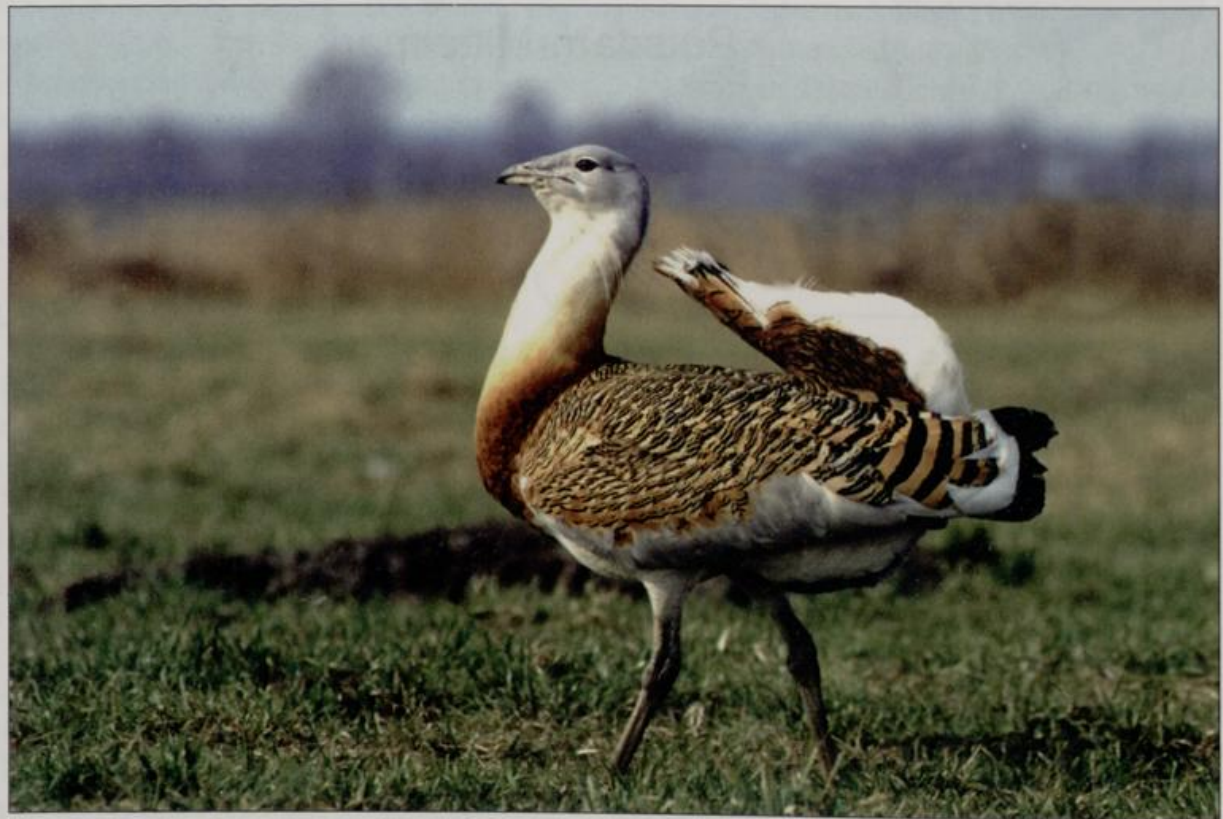
Abb. 2: Imponierender Trappenhahn nahe Garlitz/HVL, April 1991. Fig. 2: Displaying male Great Bustard near Garlitz/HVL, April 1991.

* In diesen Gebieten lebten im Untersuchungszeitraum je zwei Fortpflanzungsgemeinschaften.