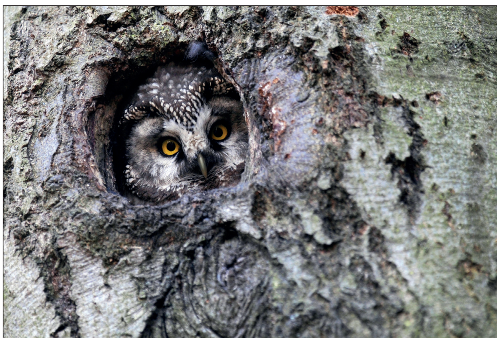
Abb. 8: Raufußkauz, Luckenwalde/TF, März 2012. Fig. 8: Boreal Owl, Aegolius funereus .