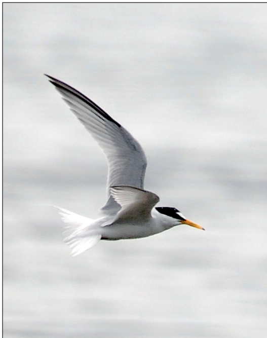
Abb. 6: Zwergseeschwalbe, Mühlberg/EE, Juni 2012. Fig. 6: Little Tern, Sternula albifrons .

Zwergseeschwalbe Sternula albifrons : Brut: 14 BP + 2 Paare Brutverdacht Kiesseen Mühlberg (HH; TS u.a.; RYSLAVY 2015a). Erstbeob.: 1.Mai 2 Kiesseen Mühlberg (M.Walter) * 8.Mai 2 Oder Stolzenhagen/BAR (M.Müller). Max.: 13.Mai 8 Oder Stolpe (WD) * 15.Jul 35 Kiesseen Mühlberg (TS, HH). Abseits von Oder und Elbe 11 Ex. bei 4 Beob.: 23.Jun 2 Gülper See (HH; Martin Miethke) * 2.Jul 2 ad. Müggelsee (K.Lüddecke) * 23.Jul 5 ad. ebd. (K.Lüddecke) * 3.Aug 2 ad. Friedländer Teiche/LOS (HH), gleichzeitig Letztbeob.