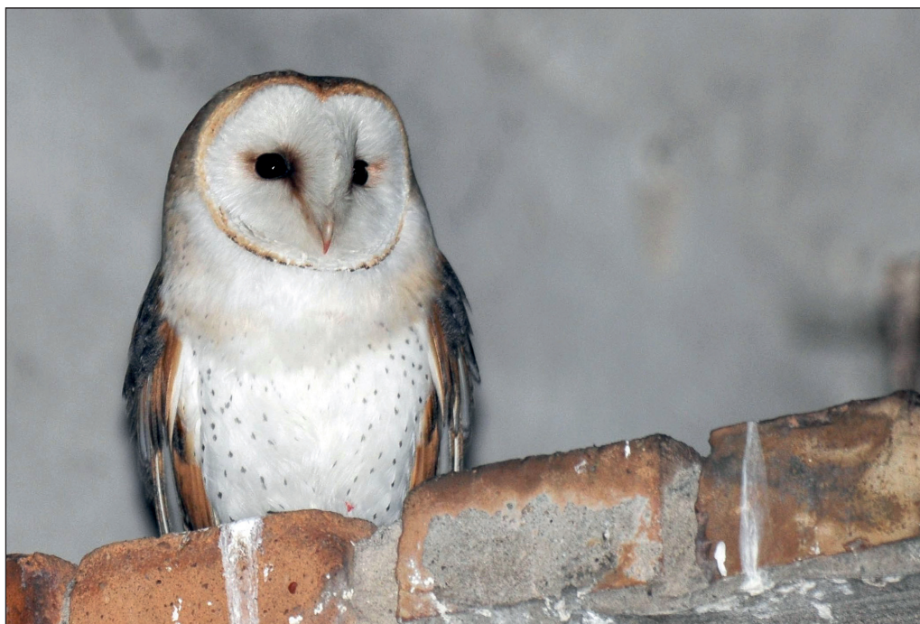
Abb. 7: Schleiereule, Körzin/PM, April 2012. Fig. 7: Western Barn Owl, Tyto alba .