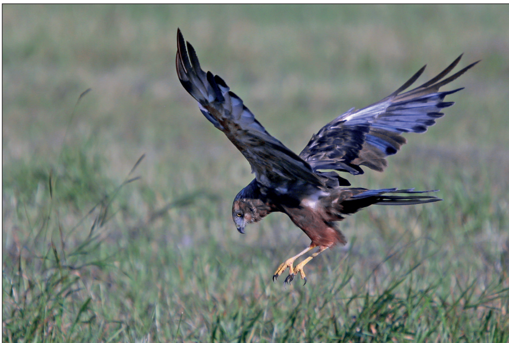
Abb. 4: Rohrweihe, Männchen, vorjährig, Oderbruch/MOL, Juli 2012. Fig. 4: 2nd year male Marsh Harrier, Oderbruch/MOL, July 2012.

Rotmilan Milvus milvus : Brut: mind 8 Rev. SPA Naturpark Nuthe-Nieplitz-Niederung/PM-TF (L.Kalbe u.a.) * 4 BP/148 km 2 Stadtkreis Frankfurt/FF (J.Becker u.a.). Winter: im Jan 20 Ex. in 20 Gebieten * Anfang Feb 3 Ex. in 3 Gebieten. Ans. ab 14 Ex.: 7.Jul 14 Rudower See/PR (R.Rath) * 17.Aug 20 Bergholz bei Bad Belzig/PM (E.Eidam) * 30.Aug 14 Biesen/OPR (T.Heinicke) * 6.Sep 24 Schraden/EE (I.Erler) * 15.Sep 14 Gülper See (WS) * 25.Sep 14 Alteno/LDS (S.Rasehorn) * 29.Sep 22 Lenzer Wische/PR (H.-J.Kelm) * 29.Sep 17 Goßmar/LDS (J.&K.Illig) * 11.Okt 14 Duben/LDS (U.Schroeter). Aktiver