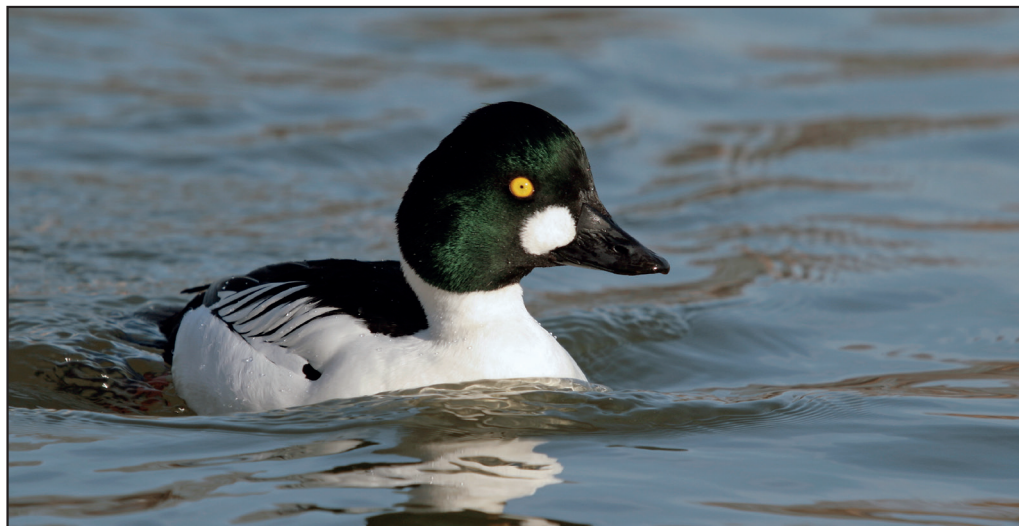
Abb. 1: Schellente, Männchen, Oderbruch/MOL, Februar 2012. Fig. 1: Common Goldeneye, Bucephala clangula , male.

Schellente Bucephala clangula : Brut: 23.Mai 3 Fam. Angermünder Teiche (UK) * 4./23.Jun 4 Fam. Rietzer See-Streng (WS; HH). Winter/Heimzug, Ans. ab 250 Ex.: 9.Jan 347 Talsperre Spremberg (S.Klasan) * 16.Jan 280 Gülper See (U.Drozdowski, K.Sawall) * 28.Jan 215 Unteruckersee (HH) * 2.Feb 280 Schwielowsee/PM (WS) * 4.Feb 250 Werbellinsee/BAR (C.&P.Pakull) * 17.Feb 600 Unteres Odertal N Schwedt (WD) * 3.Mär 250 Grimnitzsee (JM) * 3.Mär 300 Oder bei Neulewin/MOL (W.Koschel). Brutzeit/Sommer (Mai-Aug), Ans. ab 30 Ex.: 10./25.Jun 43 Peitzer Teiche (HH, B.Litzkow, H.-P.Krüger, M.Spielberg, RZ) * 4.Jul 35 Sedlitzer See/OSL (H.Michaelis, H.Trapp) * 11.Jul 68 Angermünder Teiche (UK) * 16.Aug 70 Bergheider See/EE (TS). Wegzug/Winter, Ans. ab 120 Ex.: 4.Nov 297 Unteruckersee (HH) * 27.Nov 463 Talsperre Spremberg (RB) * 16.Dez 144 Oder Stolzenhagen/BAR-Stützkow/UM (DK) * 17.Dez 440 Unteres Odertal bei Gatow (DK) * 21.Dez 197 Werbellinsee/BAR (A.Thieß) * 27.Dez 371 Senftenberger See/OSL (HH, H.Michaelis).