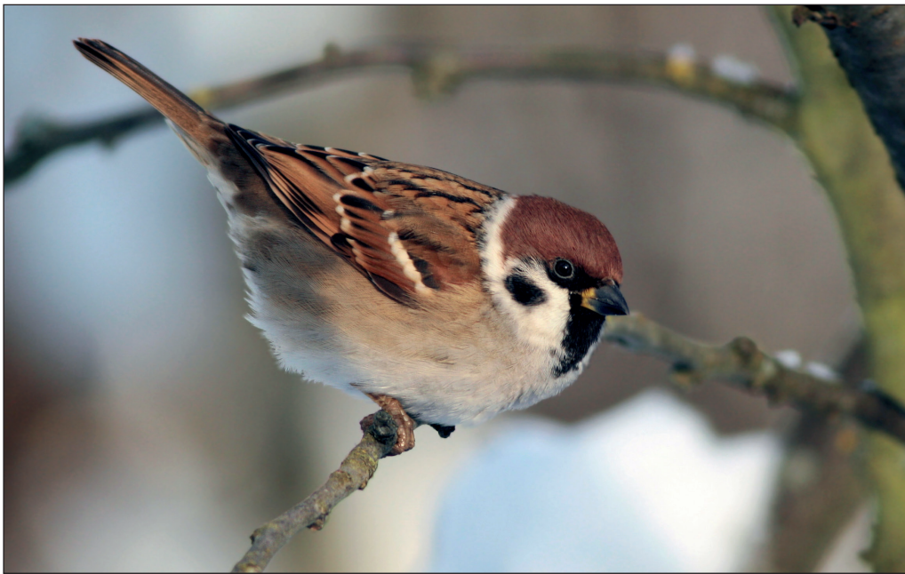
Abb. 16: Feldsperling, Oderbruch/MOL, Dezember 2012.

und 117 dz. Deponie Schönerlinde/BAR (P.Pakull) * 20.Okt 150 Planebruch/PM (K.-U.Hartleb). Winter (Jan, Dez): im Jan nur 8.Jan 1 Tremisdorf/PM (BR, K.Urban) * 30.Jan 2 Schönerlinder Teiche/OHV (WS) und im Dez 28 Ex. bei 8 Beob., max. 17.Dez 15 Unteres Odertal Gatow (DK).