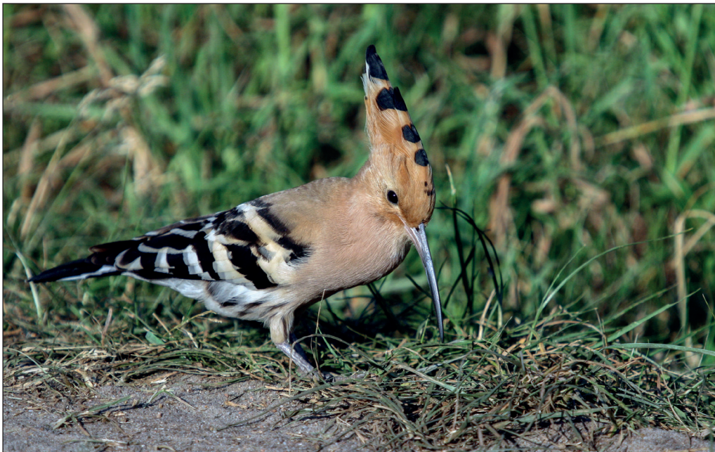
Abb. 10: Wiedehopf, Oderbruch/MOL, Mai 2012.

Letztbeob.: 14.Sep je 1 Gatower Rieselfeld/B (K.Lüddecke) und Bliesdorf/MOL (MF) * 16.Sep 1 Falkenberger Rieselfeld/B (R.Schirmeister).