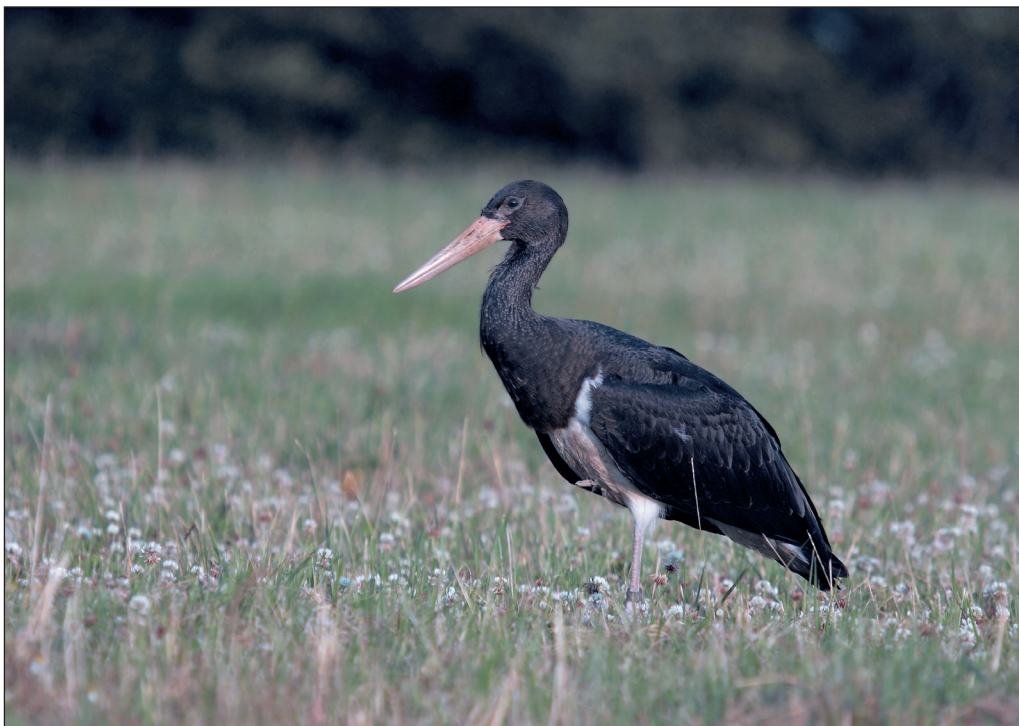
Abb. 3: Schwarzstorch, diesjährig, Oderbruch/MOL, Juli 2012. Fig. 3: 1st year Black Stork Oderbruch/MOL, July 2012.

Schwarzstorch Ciconia nigra : Brut: in Brandenburg 51 Rev. (RYSŁAVY 2015a). Erstbeob.: 12.Mär 1 Unteres Odertal bei Criewen (A.Meißner) * 13.Mär 1 dz. Gieshof/MOL (M&RF) * 16.Mär 1 Oderberg/BAR (J.Horn). Frühjahr: bis Mai max. 24.Mär 4 dz. Havelnied. Parey-Gölpe (HH) * 30.Apr 6 Ringenwalde/UM (M.Tacke) * 19.Mai 9 Unteres Odertal bei Friedrichsthal (M.Baccum, E. van der Brugge, BR, K.Urban) * 24.Mai 4 Gerswalde/UM (H.Thiele). Sommer/Wegzug, Ans. > 5 Ex.: 8.Jun 12 Elbvorland Hinzdorf/PR (S.Gerstner) * 14.Jun 7 Wittenberge/PR (T.Heinicke) * 23.Jun 6 Odervorland Stolzenhagen-Lunow/BAR (T.Berg) * 5.Aug 20 Rangsdorf/TF (B.Ludwig, E.Philipp) * 1.Sep 11 Eisenhüttenstadt/LOS (C.Pohl) * 1.Sep 7 Gülper See (HH, WS). Letztbeob.: 20.Sep 1 Lenzer Wische/PR (M.Schlede) * 23.Sep 1 Blankensee (L.Kluge, F.Maronde, A.Niedersätz, BR) * 15./21.Okt 1 dj. Schlepziger Teiche (S.Herold, T.Noah).