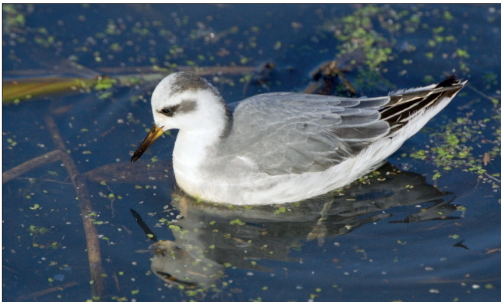
Abb. 5: Thorshühnchen, Rangsdorfer See/TF, November 2012. Fig. 5: Red Phalarope, Phalaropus fulicarius .

Flussuferläufer Actitis hypoleucos : Brut: in Brandenburg mind. 25 Rev. bei 6 Brutnachweisen (RYSLAVY 2015a). Heimzug, Erstbeob.: 25. Mär je 1 Oder Eisenhüttenstadt/LOS (C.Pohl) und Hartmannsdorf/LDS (S.Rasehorn) * 5. Apr 1 Elbe Rühstädt/PR (I.Dahms). Nur eine Ans. > 3 Ex.: 6. Mai 7 Rummelsburger See/B (A.Wolter u.a.). Wegzug, Gebietsmax. ab 10 Ex.: 21. Jul 10 Gülper See (WS, HH; Martin Miethke) * 28. Jul 14 Bergheider See/EE (TS) * 29. Jul 17 Zuckerfabrikteiche Brottewitz/EE und 12 Kieseeseen Mühlberg (TS, WS, HH) * 29. Aug 11 Elbe Lütkenwisch/PR (A.Bruch). Letztbeob.: 3. Okt 1 Kieseeseen Mühlberg (M.Walter; G.Rotzoll; J.Loose) * 17. Okt 1 Angermünder Teiche (P.Pakull, N.Vilcsko).