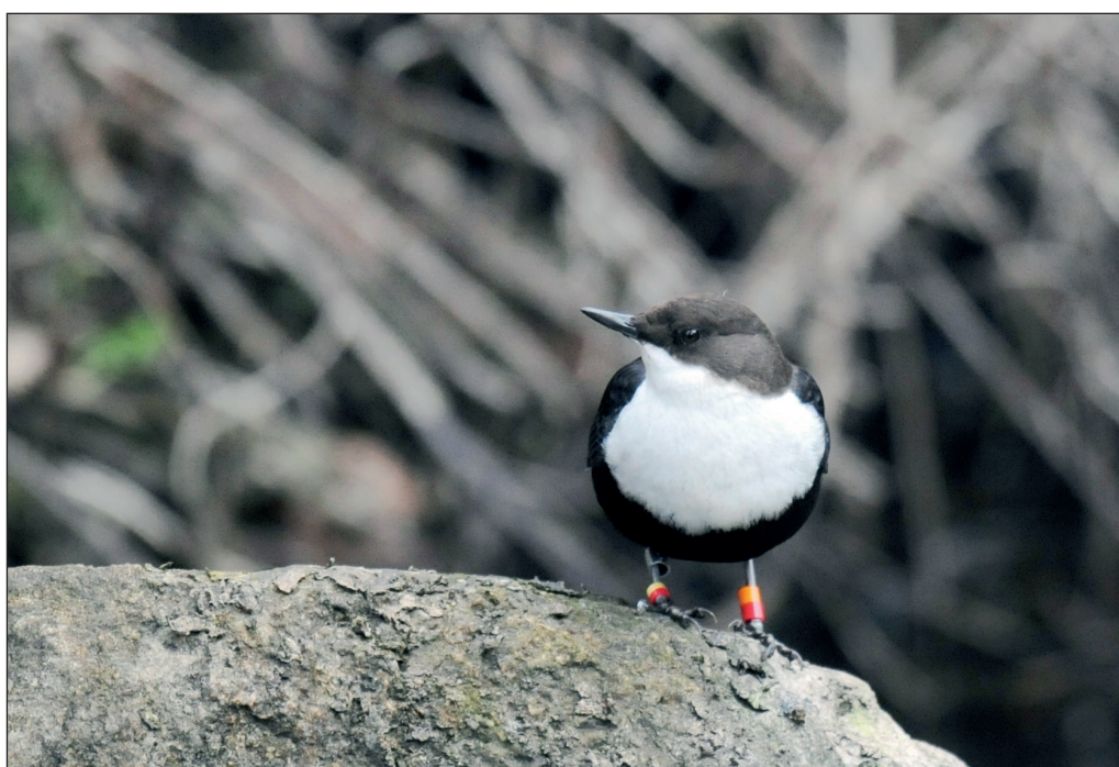
Abb. 14: Wasseramsel, Neustadt/OPR, Februar 2012. Fig. 14: White-throated Dipper, Cinclus cinclus .