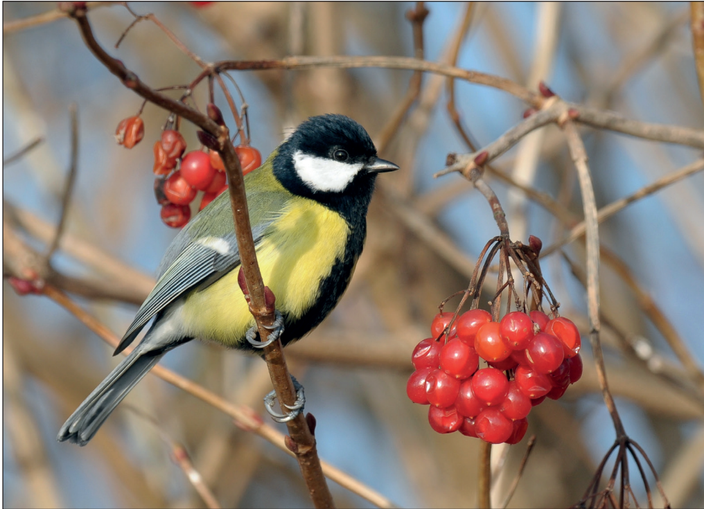
Abb. 11: Kohlmeise, Männchen, Zauchwitz/PM, November 2012. Fig. 11: Great Tit, Parus major , male.

Haubenmeise Parus cristatus : Truppmx.: 12.Jan 4 Alt Golm/LOS (HH) * 27.Dez 7 Altgaul/MOL (MF).