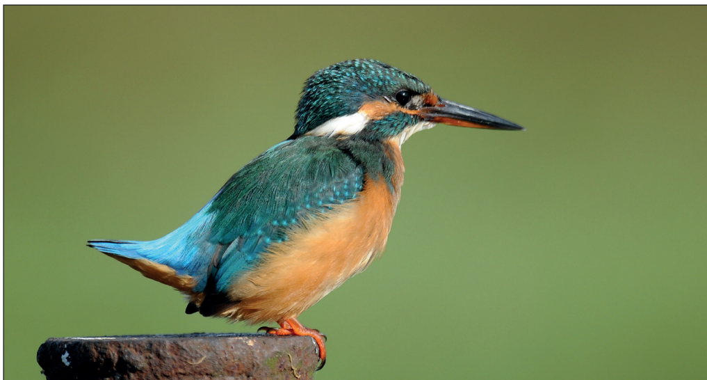
Abb. 9: Eisvogel, Weibchen, Körzin/PM, 2012.

Eisvogel Alcedo atthis : Brut: 3 Rev./54 km 2 FIB Unteres Odertal (DK; WD) * 3 Rev. Nuthe-Nieplitz-Nied. (AG Nuthe-Nieplitz) * 4 Rev. Stadtgebiet Berlin (BoA 2013b). Gebietsmax. ab 3 Ex., 1. Halbjahr: 6./8. Feb 3 Klärwerkableiter Schönerlinde/BAR (P.Pakull; N.Vilcsko) * 16. Mär 3 Rangsdorfer See/TF (B.Ludwig) * 18. Mär 7 Blankensee (BR) * 1. Apr 3 Nuthe Drewitz/P (T.Frey) * 15. Apr 4 Lychen/UM (R.Nessing). 2. Halbjahr: Für 15 Gebiete wurden Gebietsmax. ab 3 Ex. gemeldet, max. 15. Sep 6 Oder Güstebieser Loose-Christiansaue/MOL (F.Grasse) * 16. Sep 6 Wuhle/B (B.Schulz) * 18. Nov 6 Blankensee (L.Kalbe; BR).