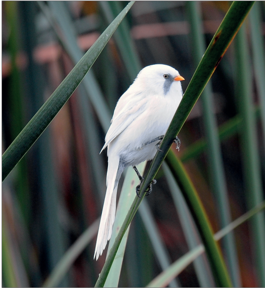
Abb. 12: Bartmeise, Männchen, Blankensee/TF, September 2012. Der Vogel zeigt den Farbabweichungstypus Dilution (ZEDLER 2015 und briefl.).