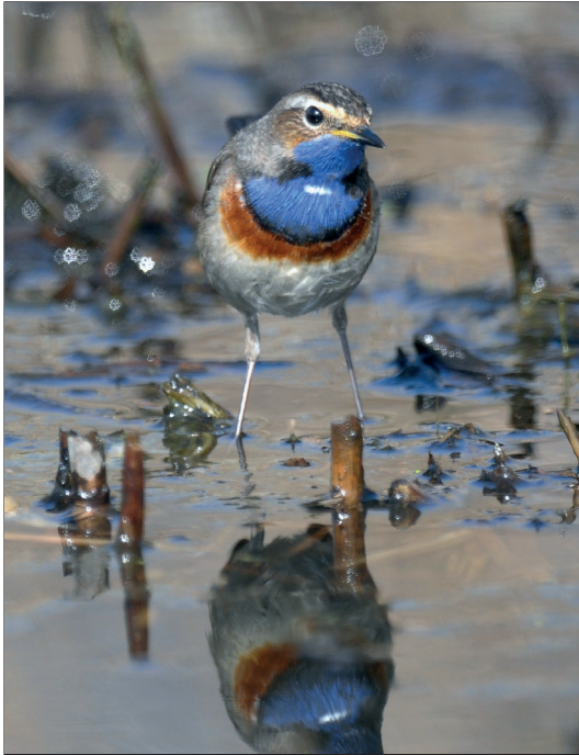
Abb. 15: Blaukehlchen, Männchen, Wachow/HVL, April 2012.