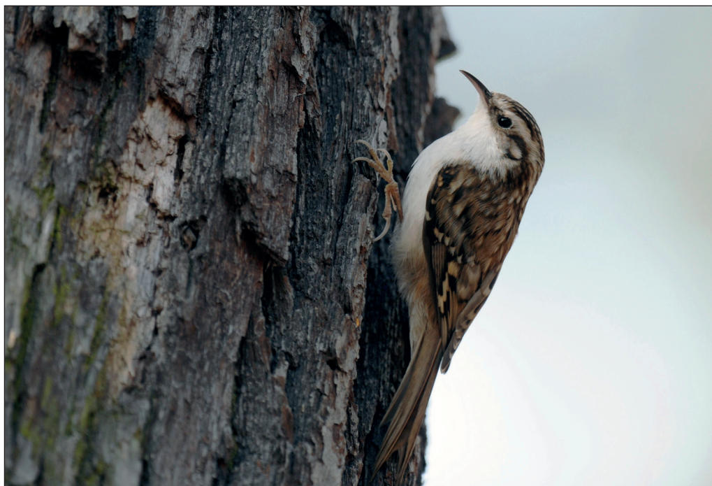
Abb. 13: Waldbaumläufer, Walddrehna/LDS, März 2012. Fig. 13: Eurasian Treecreeper, Certhia familiaris .