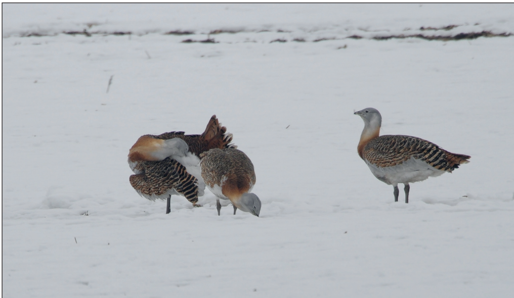
Abb. 8: Großtrappen, Buschow/HVL, März 2013.

Großtrappe Otis tarda : Beob. abseits der Einstandsgebiete: 13.Mai 1 M K3 Grüneberg/OHV (N.N.laut T.Langgemach) * 10.Jul 1 M K2 Linumhorst/OHV (U.Petri) * 25.Sep 1 Nassenheide/OHV (M.Krüger) * 31.Okt 1 M Bollensdorf/TF (H.Illig) * 4.Nov 1 ad. M Zichow/UM (F.Stein).