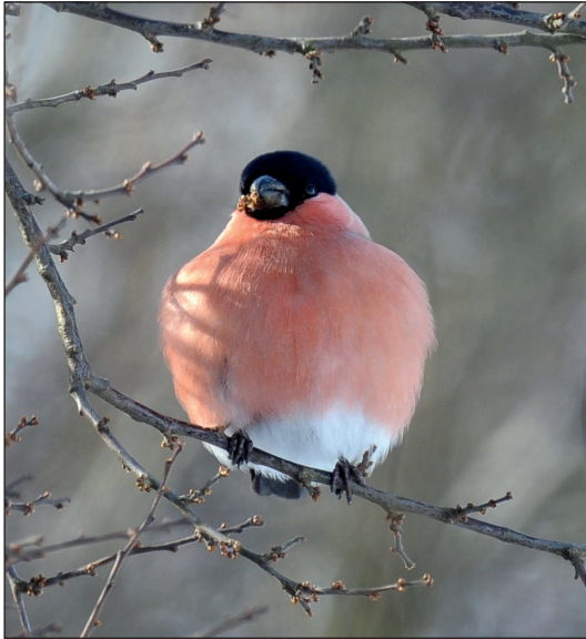
Abb. 17: Gimpel, Altenhof/BAR, März 2013.