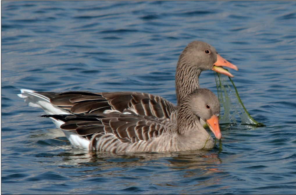
Abb. 1: Graugänse, Blankensee, Oktober 2013. Fig. 1: Greylag Goose, Anser anser .

Rostgans Tadorna ferruginea : 20 Ex. bei 7 Beob.: 5.Mär 1 Kiesseen Mühlberg (K.Lieder) * 23.Mär 6 Krewelin/OHV (K.Ratjen) * 4.Jun 1 Kiesseen Mühlberg (TS) * 23.Jul 9 ad. Elbtalau bei Abbendorf/PR (C.Czubatynski), größter bisher beobachteter Trupp * 21.–28.Sep 1 ad. W Schlabendorfer See/LDS (H.Donath; K.Illig, P.Schonert) * 30.Sep-21.Okt 1 W Talsperre Spremberg (RB) * 10.Nov 1 Kiesseen Mühlberg (S.Ulbrich).