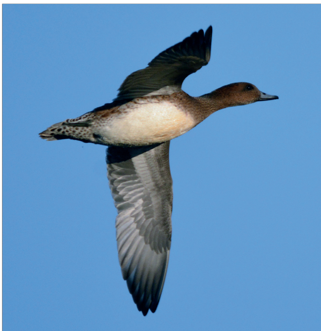
Abb. 2: Pfeifente, Blankensee, Oktober 2013.