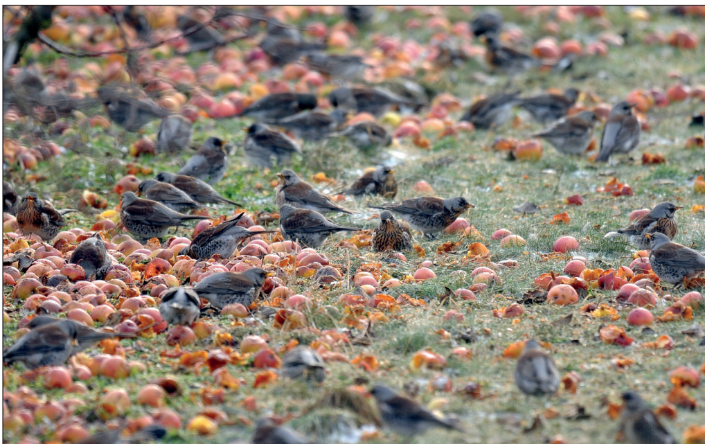
Abb. 14: Wacholderdrosseln, Marquardt/P, Januar 2013.

Wegzug/Winter, Ans. ab 500 Ex.: 7./8.Nov 1.200 Unteres Odertal Criewen (WD; DK) * 8.Nov 500 Radensdorf/LDS (T.Noah) * 28.Nov 1.000 SP Uckernied. Seehausen/UM (T.Ryslavý) * 15.Dez 700 Lübben/LDS (T.Noah) und 500 Gerswalde/UM (T.Blohm) * 16.Dez 1.000 Lübbenau/OSL (G.Wodarra) * 21.Dez 2.655 Tagebau Welzow-Süd/SPN (RB) und 500 Elbtalau Muggendorf/PR (H.-W.Ullrich) * 30.Dez 500 Neurochlitz/UM (J.Haferland).