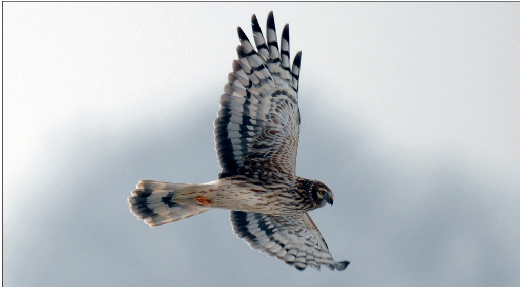
Abb. 5: Kornweihe, Roskow/HVL, Januar 2013. Fig. 5: Northern Harrier, Circus cyaneus .

Blankensee (BR, W.Suckow) * 12.Okt 6 dz. Mallnow/MOL (HH) * 13.Okt 8 dz. Blankensee (BR) * 19.Okt 54 dz. Blankensee (F.Maronde, M.Prochnow, BR u.a.), neues Gebietsmax.