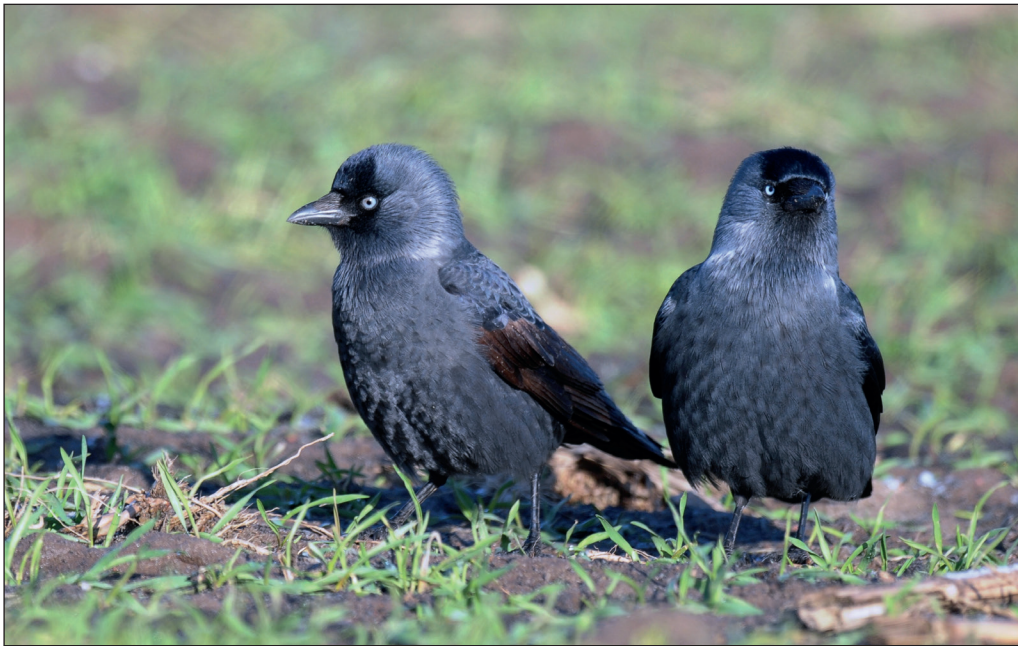
Abb. 12: Dohlen, Schmergow/PM, Februar 2013.