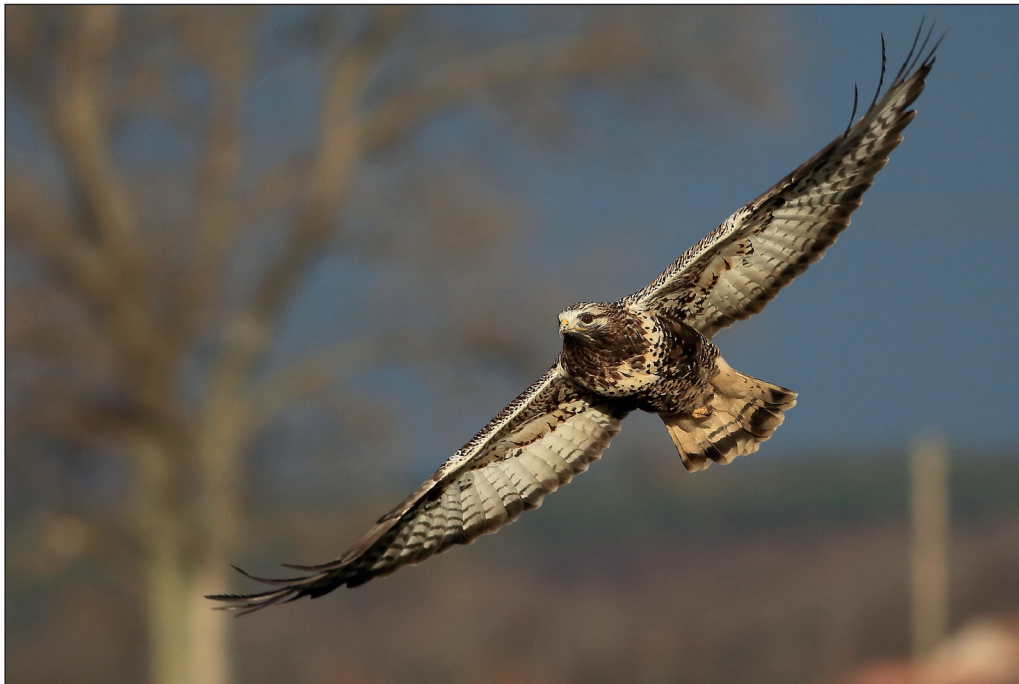
Abb. 6: Raufußbussard, Oderbruch/MOL, Dezember 2013.

Raufußbussard Buteo lagopus : Winter/Frühjahr, Ans. ab 10 Ex. , recht starkes Auftreten: 13.Jan 16 NSG Havelländisches Luch/HVL (T.Langgemach) * 16.Jan 15 Milmersdorf/UM (A.Clodius) * 27.Jan 12 Tauche/LOS (HH) * 10.Feb 40 Lenzer Wische/PR (H.-J.Kelm) * 16.Feb 11 Hirschfeld/EE (TS) * 23.Feb 36 Ziltendorfer Nied. (HH). Letztbeob.: 26.Apr 1 Greiffenberg/UM (UK) * 27.Apr 1 Neutrebbin/MOL (MF) * 2.Mai 1 Lietzengraben/B (W.Koschel). Herbst, Erstbeob.: 12.Sep 1 Wolletz/UM (H.Brandt) * 18.Sep 1 Lenzen/PR (T.Könning, H.-W.Ullrich) * 22.Sep 1 Flemsdorf/UM (G.Ehrlich) * 25.Sep 1 Goßmar/LDS (P.Schonert). Herbst/Winter, Ans. ab 5 Ex.: 17.Nov 5 NSG Havelländisches Luch/HVL (B.Block) * 1.Dez 10 Ziltendorfer Nied. (C.Pohl) * 1.Dez 8 Lenzer Wische/PR (C.Grüneberg) * 18.Dez 5 Unteres Odertal Schwedt-Friedrichsthal (WD).