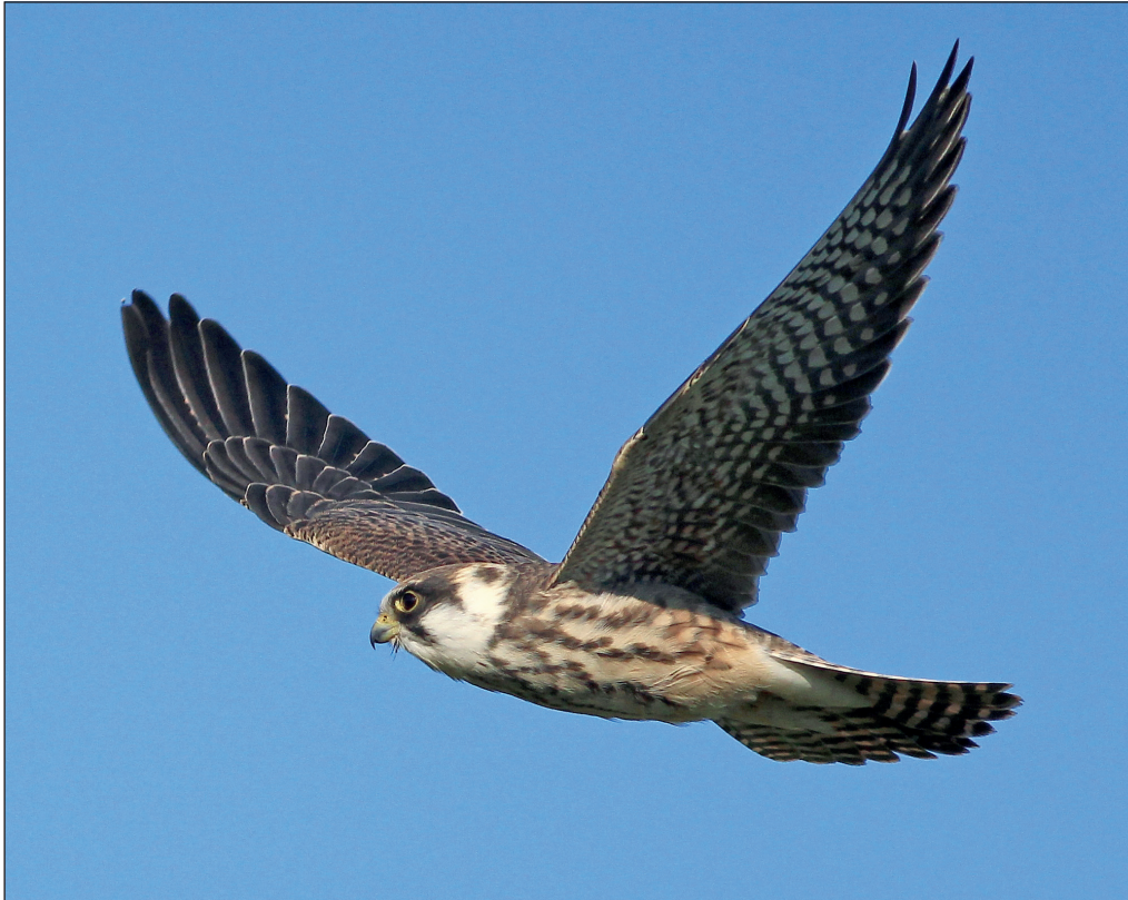
Abb. 7: Rotfußfalke, Jungvogel, Ziltendorfer Niederung/LOS.