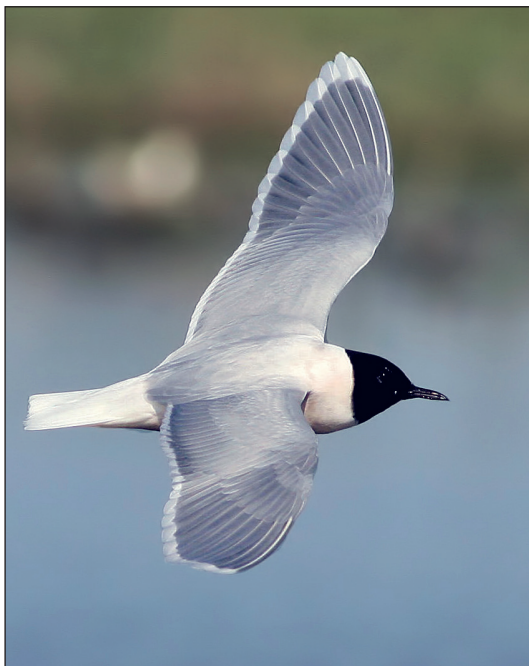
Abb. 9: Zwergmöwe, Oderbruch/MOL, Mai 2013.

Wegzug, 110 Ex. bei 36 Beob. (Wertung der Dekadenmax. je Gebiet): Erstbeob.: 5.–11. Aug 1 vorj. Gülper See (B.Jahnke; H.Fedders; L.Pelikan; Martin Miethke) * 11. Aug 2 dj. Nieplitznied. Zauchwitz (BR, K.Urban). Gebietsmax. > 10 Ex.: 13. Sep 15 Blankensee (L.Kalbe) * 18. Nov 10 Rangsdorfer See/TF (T.Becker). Letztbeob.: 24. Nov 12 Jungferensee/P-B (H.-J.Eilts) und 1 dj. Scharmützelsee/LOS (HH, W.Koschel, R.Schneider). Winter, Dez: eine Beob. von 2 Ex., die bereits während der ABBO-Tagung entdeckt wurden: 30. Nov-3. Dez 2 Wolziger See/LDS (S.Schmieder, B.Jahnke; M.Schöneberg; B.Sonnenburg) * 23. Dez 5 Gülper See (Stella Klasan).