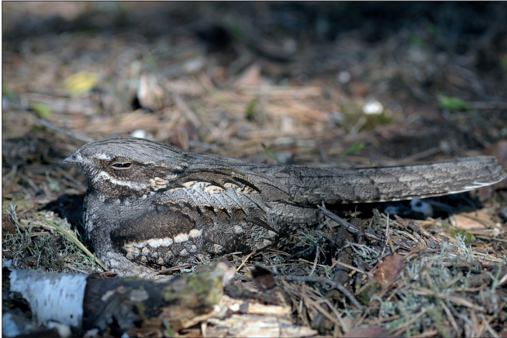
Abb. 10: Ziegenmelker, Zossen/TF, Juni 2013.