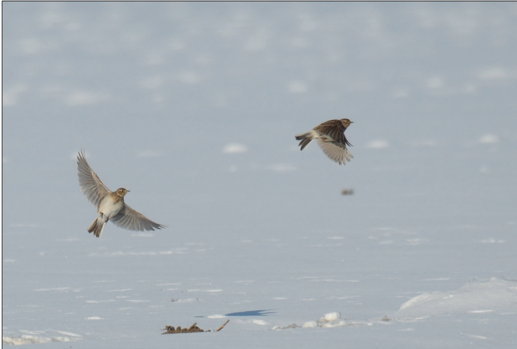
Abb. 13: Feldlerchen, Barnewitz/HVL, März 2013.