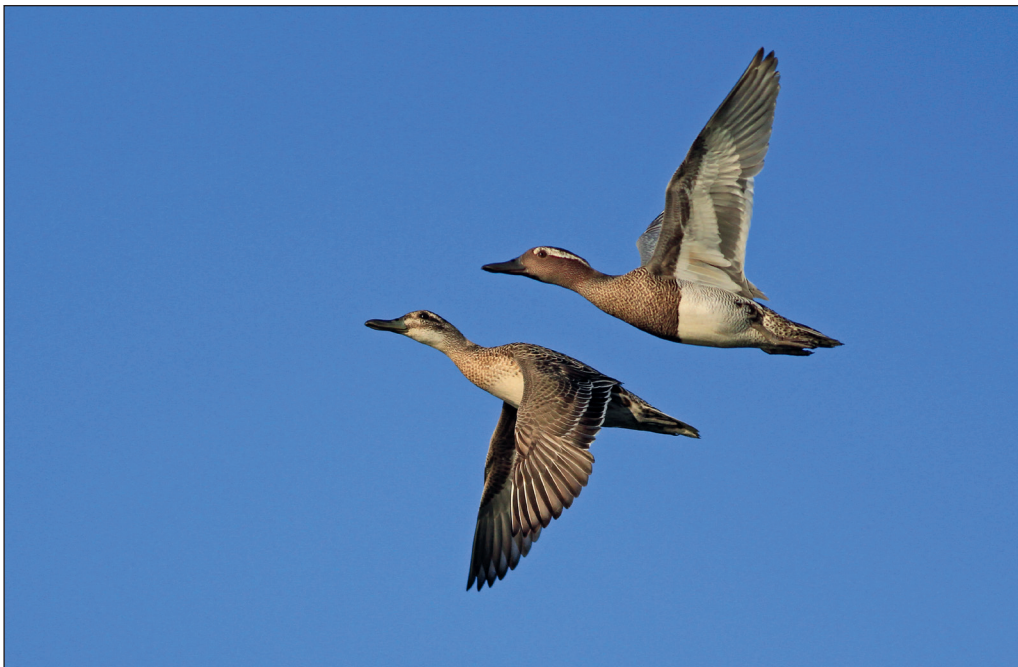
Abb. 3: Knäkenten, Oderbruch/MOL, Juni 2013. Fig. 3: Garganey, Anas querquedula .

Jul 50 Havelnied. Parey/HVL (W.Kunz; B.Jahnke) * 22.Jun 26 Sydowswiese-Güstedieser Loose/MOL (HH) * 19.Jul 320 Unteres Odertal bei Gatow (WD), hohe Zahl * 25.Jul 25 Unteres Odertal S Schwedt (DK) * 31.Jul 20 Odervorland Stolpe/UM (M.Müller). Wegzug, Ans. > 20 Ex.: 1./9.Aug 300 Unteres Odertal bei Gatow (WD) * 4.Aug 70 Oder Stützkow bis Stolpe (DK) * 11.Aug 550 Havelnied. Parey (HH), hohe Zahl * 11.Aug 105 Gülper See (HH) * 18.Aug 26 Alte Spreemündung (HH) * 22.Aug 85 Kienitz/MOL (MF) * 24.Aug 162 Havelnied. Grütz/HVL (HH, WS). Letztbeob.: 13.Okt 1 Unteres Odertal Schwedt-Friedrichsthal (DK) * 14.Okt 1 Karower Teiche/B (M.Trobitz, L.Thielcke) * 16.Okt 1 Grimnitzsee (P.Pakull, N.Vilcsko), dort 25.Okt 2 (W.Koschel) * 17.Nov 1 w-farben Oder bei Neurüdnitz/MOL (M.Müller), sehr spätes Datum.