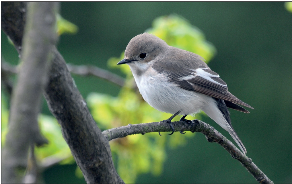
Abb. 15: Trauerschnäpper, Kallinchen/TF, April 2013.

Trauerschnäpper Ficedula hypoleuca : Erstbeob.: 13. Apr 1 M Elsterwerda/EE (U. Albrecht) * 14. Apr 11 Ex. in 10 Gebieten. Letztbeob.: 9. Sep 1 Ressen/OSL (TS) * 13. Sep 1 Mitte/B (WS) * 13. Okt 1 Spandau/B (D. Westphal) – späte Feststellung.