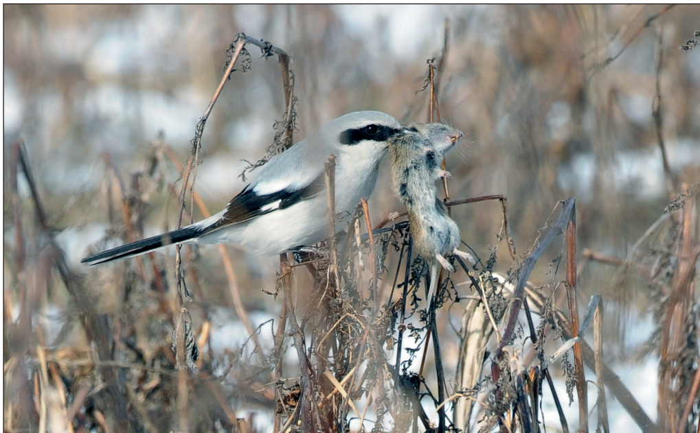
Abb. 11: Raubwürger, Schlieben/EE, März 2013.

Raubwürger Lanius excubitor : Brut: 10 Rev./175 km 2 SPA Mittlere Odernied.-Süd/LOS-MOL (HH). Gebietsmax. außerhalb der Brutzeit: 13. Jan 4 NSG Havelländisches Luch/HVL (B.Block, T.Langgemach) * 7./28. Aug je 6, 22. Sep 9 auf 40 km 2 Ziltendorfer Nied. (C.Pohl; HH) * 27. Dez 4 Unteres Odertal Schwedt (DK) * in anderen Gebieten nicht mehr als 3 Ex.