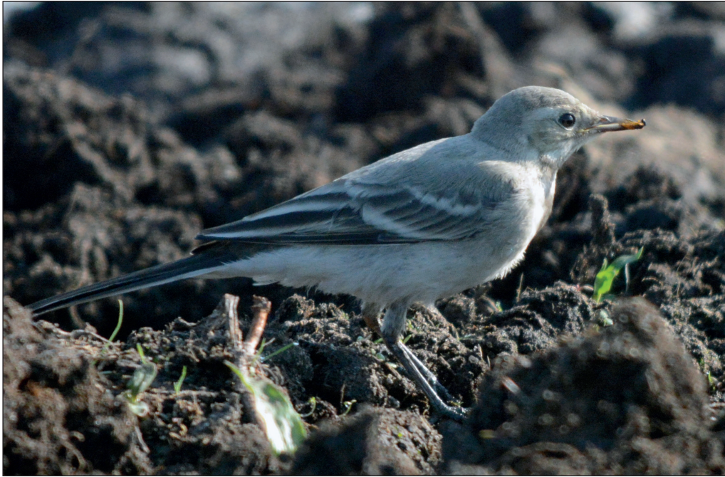
Abb. 16: Bachstelze, Jungvogel, Nuthe-Nieplitz-Niederung/PM-TF, August 2013. Fig. 16: Juvenile White Wagtail, Nuthe-Nieplitz-Niederung/PM-TF, August 2013.

Kernbeißer Coccythraustes coccythraustes : Trupps ab 50 Ex. : 21.Mär 54 Alter Friedhof Potsdam/P (W.Püschel) * 19. Apr 110 Ferchesarer Heide/HVL (T.Langgemach) * 28.Aug 53 Schlepzig/LDS (T.Noah) * 23.Okt 60 Feuchtwiesen SE Lübben (T.Noah) * 13.Dez 55 Beeskow-Neuendorf/LOS (H.Deutschmann) * 30.Dez 140 Spandau/B (A.Bräunlich). Aktiver Zug, max. : 12.Okt 113 dz. Mallnow/MOL (HH) * 19.Okt 176 dz. Blankensee (BR, M.Prochnow, F.Maronde) * 23.Okt 90 dz. Kippe Schönerlinde/BAR (P.Pakull).