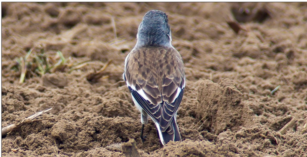
Abb. 2: Der Schneesperling bei Wittstock (OPR) am 12. April 2016.