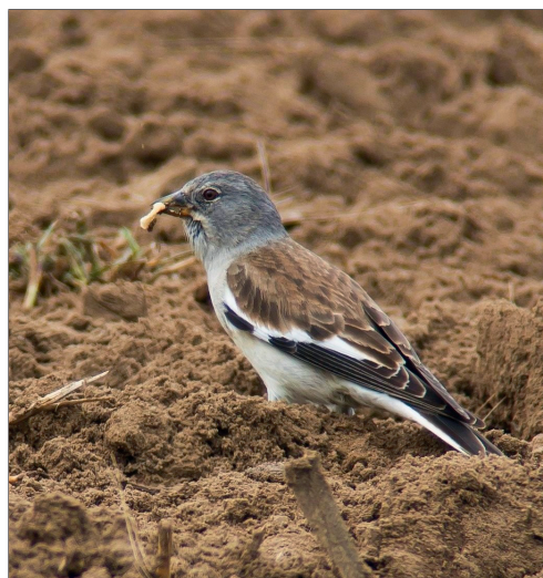
Abb. 3-4: Der Schneesperling bei Wittstock (OPR) am 12. April 2016.