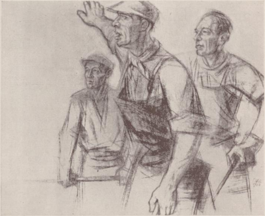
Arbeiter aus dem Schwermaschinenbau, Kreidezeichnung