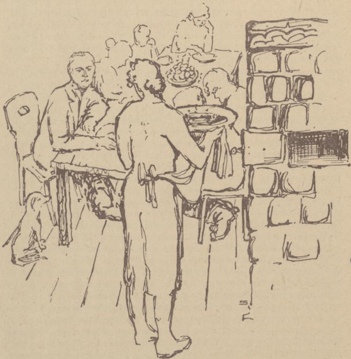
Zeichnung: H. Seiler

Selbst das Höchste und Beglückendste im menschlichen Leben zu erwecken, ist unserm prignitzer Knieper möglich. Er strahlt soviel Wärme und Glut aus, daß durch ihn auch das Herz schneller schlägt und die Liebe in seinem Gefolge daherwandelt. Über die dampfende Schüssel des gemeinsamen heimatlichen Gerichtes hinweg, die sie dem Gast darreichte, hatten sich damals auch die Augen der Tochter des Hauses mit denen des jungen Lehrers getroffen, und der Knieperkohl bewies, daß er nicht nur ein nüchternes Nahrungsmittel ist, sondern daß er eben vermag, auch das Gefühl anzurühren. Er ließ eine Liebe zwischen diesen beiden jungen Menschen aufblühen, die für's Leben hielt.