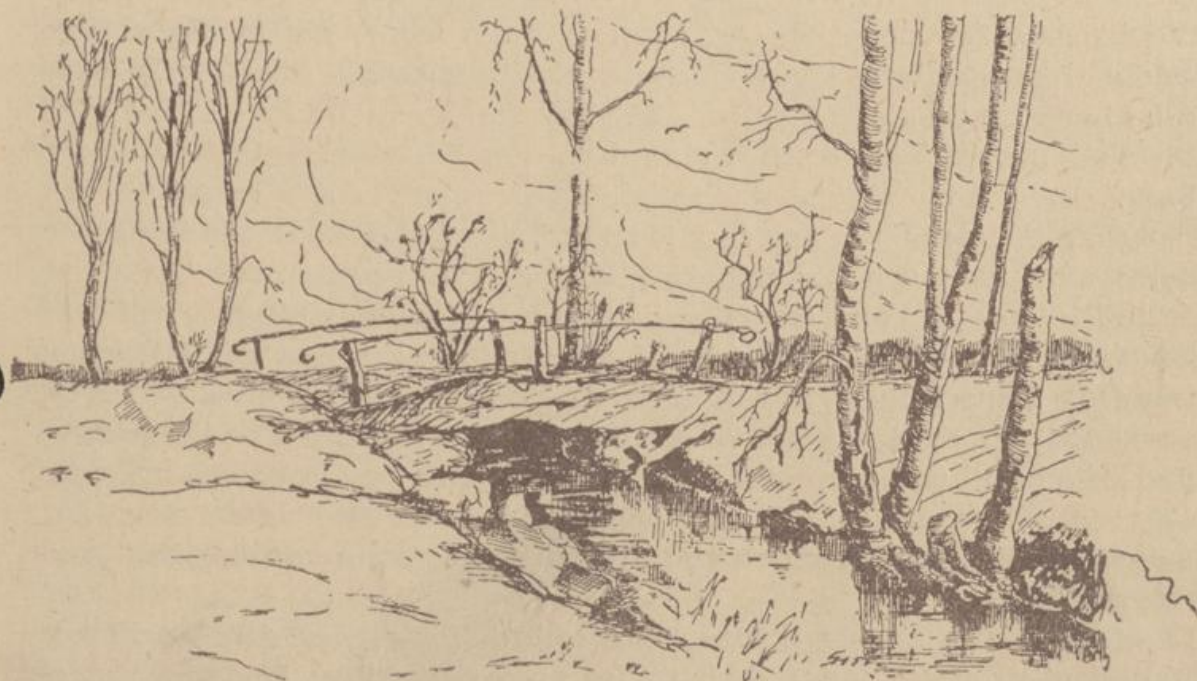
Zeichnung: Herbert Spurring, Groß-Linde

Der Wiener Kongreß hatte die Verhältnisse Deutschlands neu geordnet. Die Elbe war nun nicht mehr Grenzstrom, sondern Verkehrsstraße. Preußen hob alle Binnenzölle auf. Die Fährgelühren wurden neu festgesetzt. Die Fährrordnung für Sandkrug vom 3. November 1817 ist erhalten geblieben. Wenn man berücksichtigt, daß dreißig Jahre später die Arbeiter beim Bau des Elbdeiches bei zwölfstündiger Arbeitszeit einen T a g e l o h n