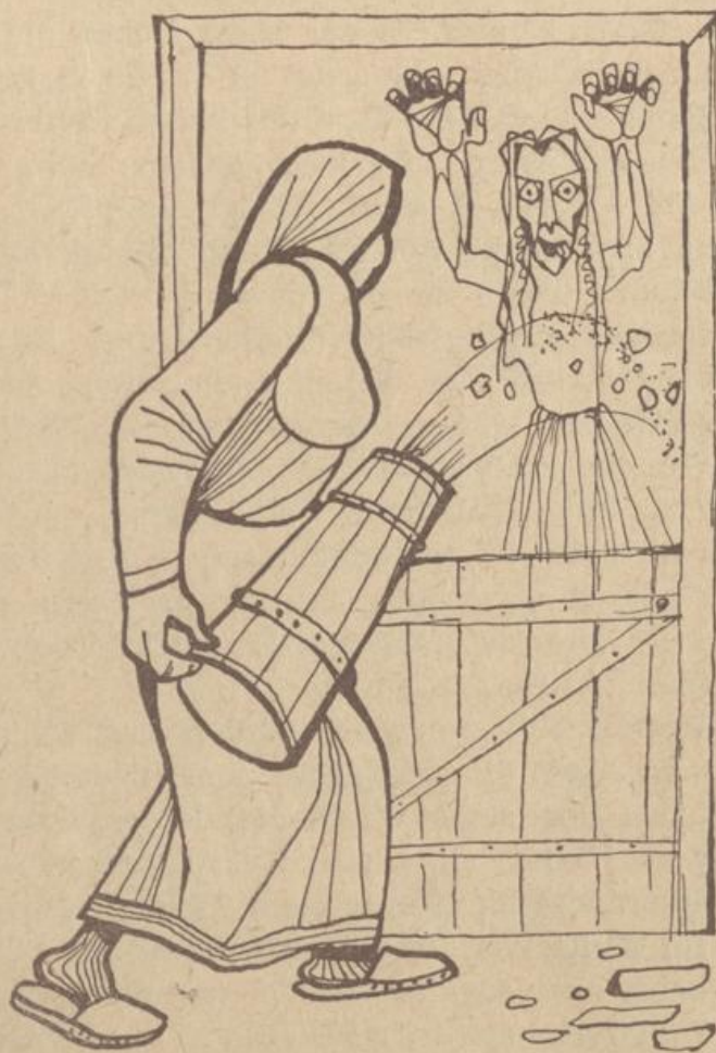
Zeichnung: Peter „Wenger

Von da geewt in Lenzen keen Botterstock mehr, un de swatten Katt'n von de Botterhex, de oams ümmer in de Fenstern käken hemm'n, wärn uck nich mehr to sehn.