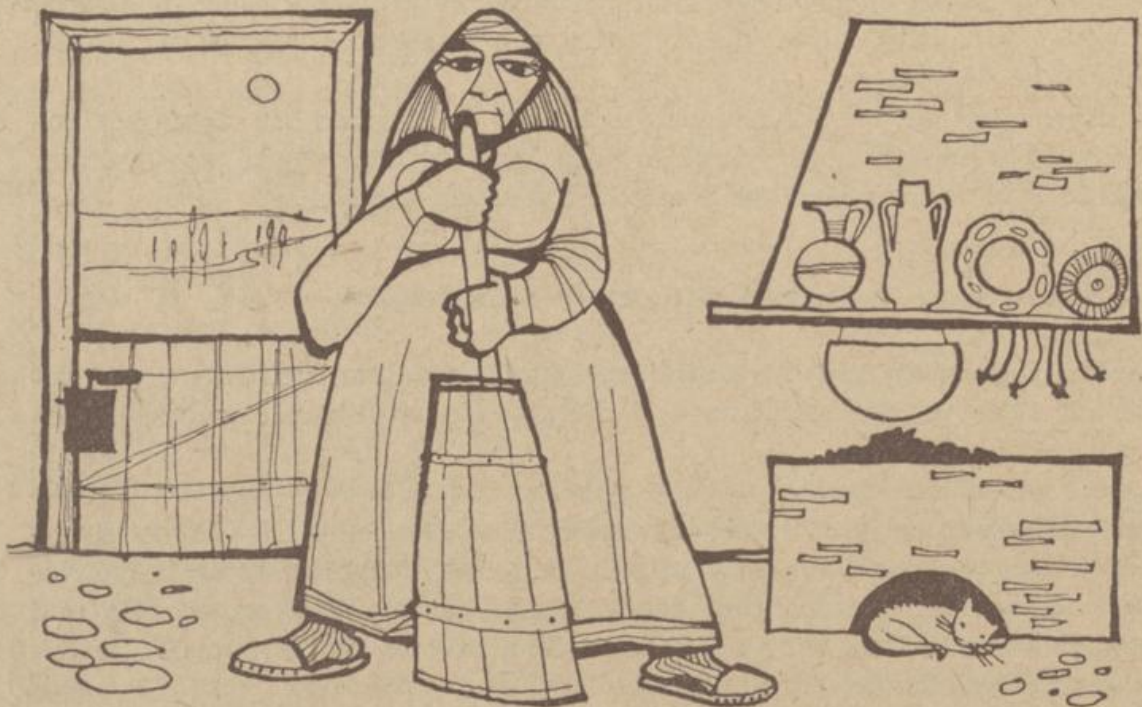
Zeichnung: Peter Wenger

Dat is nu schon lang her, dat mütt de Botterhex. Ick will dat mol kott vertell'n. In een eng'n Winkel in Lenzen steiht gliexen hinner de Dör, de bömelst Luk ha se upmoakt, Mudder Burmeesters ant Botterfatt. De Katt leeg ünner int Backlock von dän Schwiebog'n un schnurrt vör sick henn. Boam an'n Böen hüng'n de Schinken un de Wöst in Rook. De Sünn schien so heet, — un dät wär noch so bannig battig. De Aust wär verbie, de Heintotters kom schon tohop, un de Spreen treck'n oams schon in grot'n Hopn noat Elw in dänn Wienbusch. Mudder Burmeestersch löp de Schweet ümmer an dänn Liew lingerlang. Änner Wärer sall'd woll uk gäm, denn dät Rieten mök är hüt wärrer so malot. Un erst de Botter, de will un will nich wärn. Se schleit int Fatt bloß ümmer Schum un keen Botter. Se ha