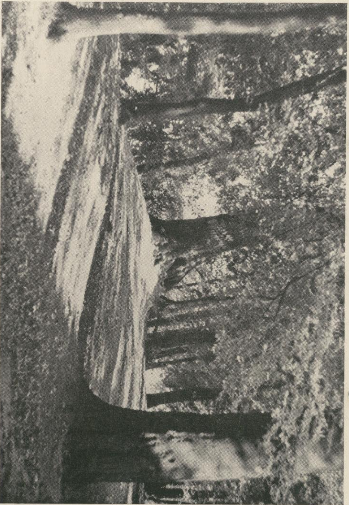
Wittstock — Auf dem Stadtwall