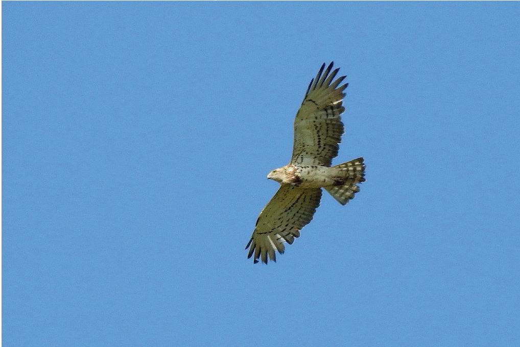
Abb. 7: Schlangenadler, Havelländisches Luch/HVL, Juli/August 2016. Fig. 7: Short-toed Snake Eagle, Circaetus gallicus.