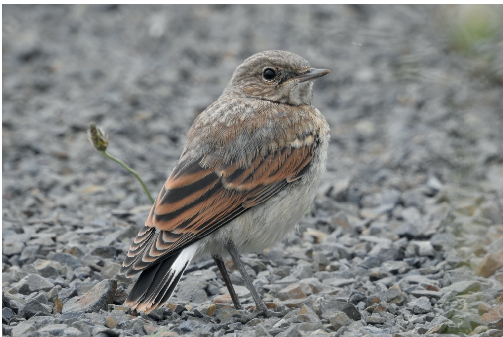
Abb. 14: Steinschmätzer, Jungvogel, Eberswalde/BAR, Juli 2016. Fig. 14: Northern Wheatear, juv., Oenanthe oenanthe .

Schwarzkehlchen Saxicola rubicola : Brut, Konzentrationen: 15 Rev./400 ha Ferbitzer Bruch/P (L.Pelikan) * 14 Rev./400 ha Rathenow/HVL (A.Kabus, T.Langgemach) * 23 Rev. Welsebruch Passow-Kummerow/UM (S.Lüdtke) * 18 Rev. Gatower Rieselfeld/B (E.Wolf). Erstbeob.: 7.Mär 1 M Gatower Flugplatz/B (A.Federschmidt) * 16.Mär 5 M in 4 Gebieten. Nachbrutzeit/Wegzug, Ans. > 10 Ex.: 18.Sep 11 Wartenberger Felder/B (S.Materna) * 23.Sep 14 Gatower Rieselfeld/B (A.Federschmidt) * 25.Sep 17 Falkenberger Rieselfeld/B (R.Schirmeister) und 15 Rieselfelder Großbeeren/TF (L.Gelbicke) * 14.Sep/3.Okt je 12 Neuzeller Wiesen/LOS (C.Pohl). Letztbeob.: 30.Okt 4 Ex. in 3 Gebieten * 31.Okt 1 M Gatower Flugplatz/B (E.Wolf) * 3.Nov 1 W Unteres Odertal Friedrichsthal (UK). Dezember, 2 Ex.: 7.Dez 1 M Klärwerksabteiler Waßmannsdorf/LDS (L.Gelbicke) * 16./17.Dez 1 W Malxenied. Dissen/SPN (D.Robel).