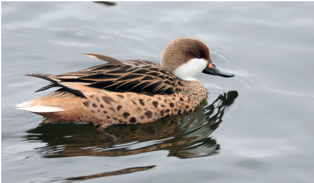
Abb. 16: Bahamaente, Potsdam/P, Januar 2016.