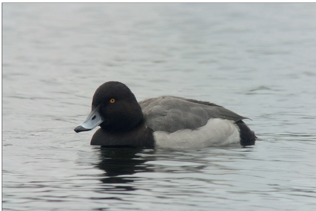
Abb. 1: Hybrid Reiherente x Tafelente, Heiliger See/P, Dezember 2016.