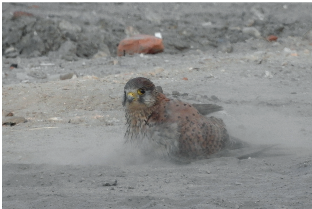
Abb. 9: Turmfalke beim Staubbaden, Potsdam/P, Juni 2016. Fig. 9: Common Kestrel, Falco tinnunculus .