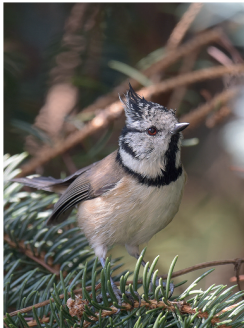
Abb. 11: Haubenmeise, Potsdam/P, September 2016.

Heidelerche Lullula arborea : Erstbeob.: 13. Feb 1 Passow/UM (T.Becker) * 27. Feb je 1 Tagebau Welzow-Süd/SPN (RB) und Unteres Odertal Schwedt (DK) * 29. Feb 1 Krugauer Heide/LDS (T.Noah). Heimzug, max.: 18. Mär 30 Poleysee/EE (TS)