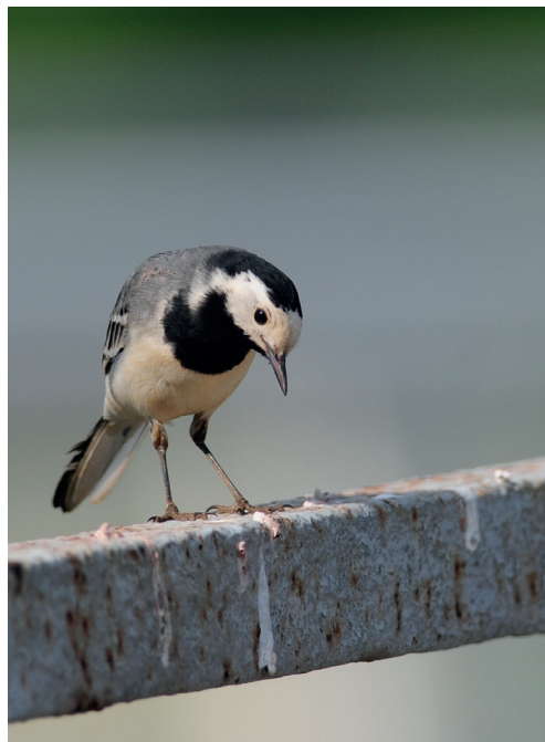
Abb. 15: Bachstelze, Kleinrössen/EE, Mai 2016.

Bergpieper Anthus spinoletta : im ersten Halbjahr 315 Ex. bei 42 Beob. und geringe Anzahl im zweiten Halbjahr , 158 Ex. bei 41 Beob. (bei Datenreihen Wertung der Monatsmax.). Gebietsmax. ab 10 Ex.: 6.Jan 16 Unteres Odertal Schwedt (DK) * 19.Jan 50, 17.Feb/1.Mär 45 und 12.Dez 20 Unteres Odertal Friedrichsthal (H.-J.Haferland; WD) * 19.Jan 24 und 11.Nov 10 Klärwerkableiter Schönerlinde/BAR (P.Pakull; A.Haman) * 6.Feb 42 Unteres Odertal Lunow-Stolpe (HH) * 6.Nov 23 Schlepziger Teiche (T.Noah) * 6.Nov 12 Gülper See (HH) * 21.Nov 11 Havelnied. Parey (B.Jahnke, S.Klasan). Heimzug, Letztbeob.: 11.Apr 5 Gülper See (M.Wink) und 1 Unteres Odertal Friedrichsthal (WD) * 14.Apr 1 Lietzengraben/B (C.Witte). Wegzug, Erstbeob.: 30.Sep/7.Okt 1 Unteres Odertal Criewen (DK) * 17.Okt 6 Unteres Odertal Friedrichsthal (WD).