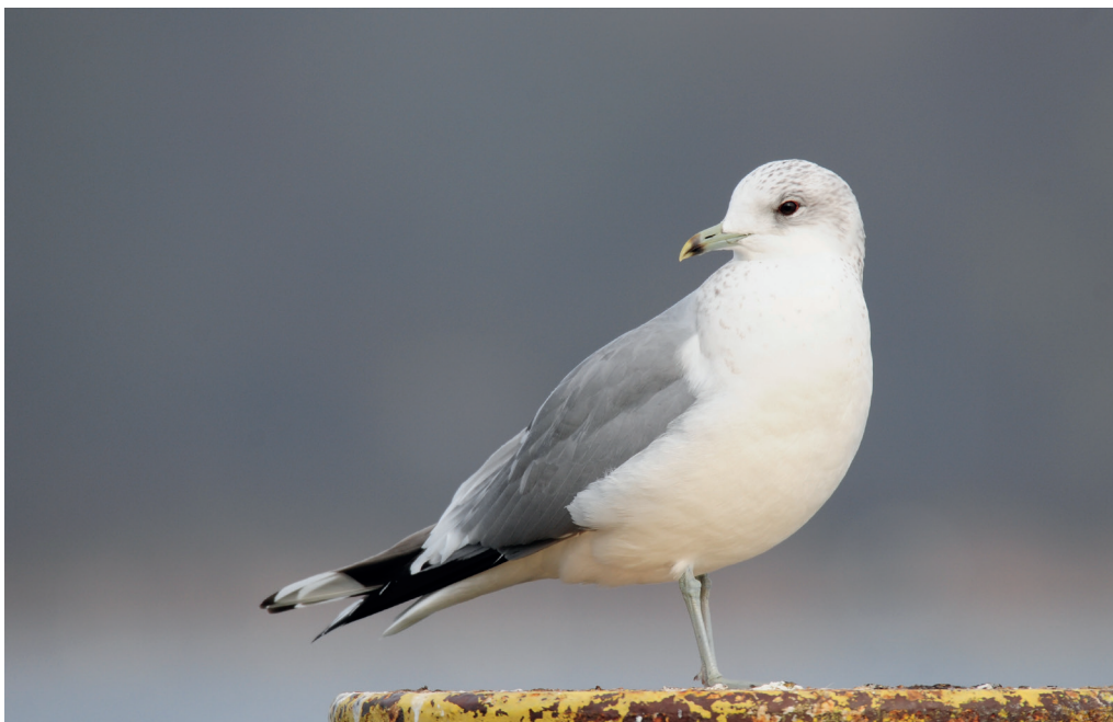
Abb. 4: Sturmmöwe, Altvogel, Caputh/PM, März 2016. Fig. 4: Mew Gull, ad., Larus canus .

Gebietsmax. ab 3 Ex., 1. Halbjahr: 7.Jan 5 Schwielowsee/PM (R.Schneider) * 7.-15.Jan 4 Dahme Grünau-Köpenick/B (R.Eidner) * 10.Jan 4 Pichelsdorfer Havel/B (K.Lüddecke) * 29.Jan 7 Oder Schwedt-Friedrichsthal/UM (WD). Heimzug, Letztbeob.: 17.Apr 1 Peitzer Teiche/SPN (H.-P.Krüger) * 23.Apr 1 Pfaueninsel/B (D.Ehlert). Wegzug, Erstbeob.: 2.Aug 1 immat. Lietzengraben/B (E.Hübner) * 18.Aug 1 ad. Elbe bei Wootz/PR (H.-W.Ullrich, T.Könning). Gebietsmax. ab 3 Ex., 2. Halbjahr: 8.Sep 3 SP Templiner See/P (S.Klasan) * 7.Nov 3 ebd. (S.Klasan) * 3.Dez 4 Müggelsee (K.Lüddecke) * 5.Dez 3 Schwielowsee/PM (F.Drutowski) * 27.Dez 6 Unteres Odertal Schwedt-Friedrichsthal (WD) * 31.Dez 3 Tempelhofer Feld/B (C.Schwägerl).