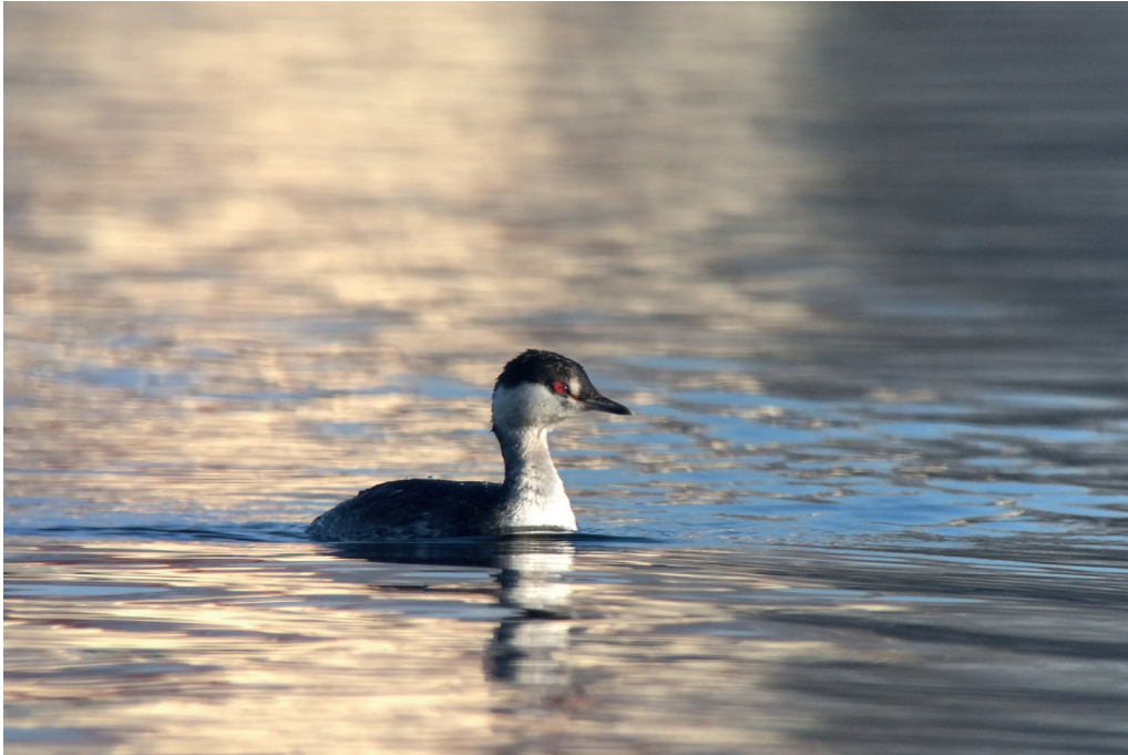
Abb. 2: Ohrentaucher, Heiliger See/P, Dezember 2016.