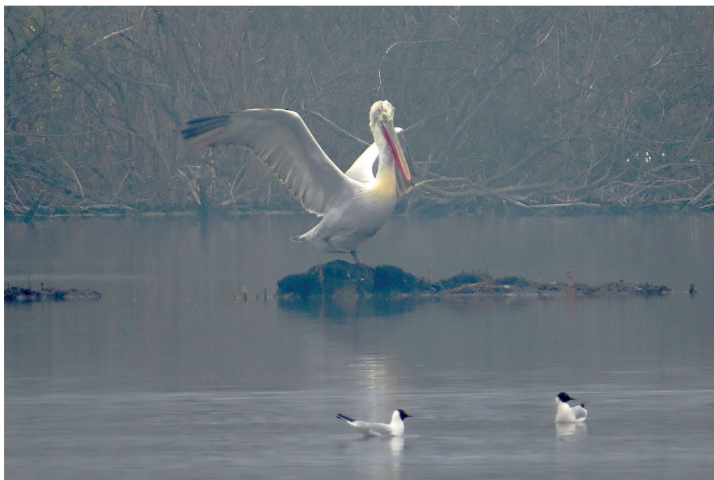
Abb. 5: Krauskopfpelikan, Altvogel, Altfriedländer Teiche/MOL, April 2016. Fig. 5: Dalmatian Pelican, Pelecanus crispus .