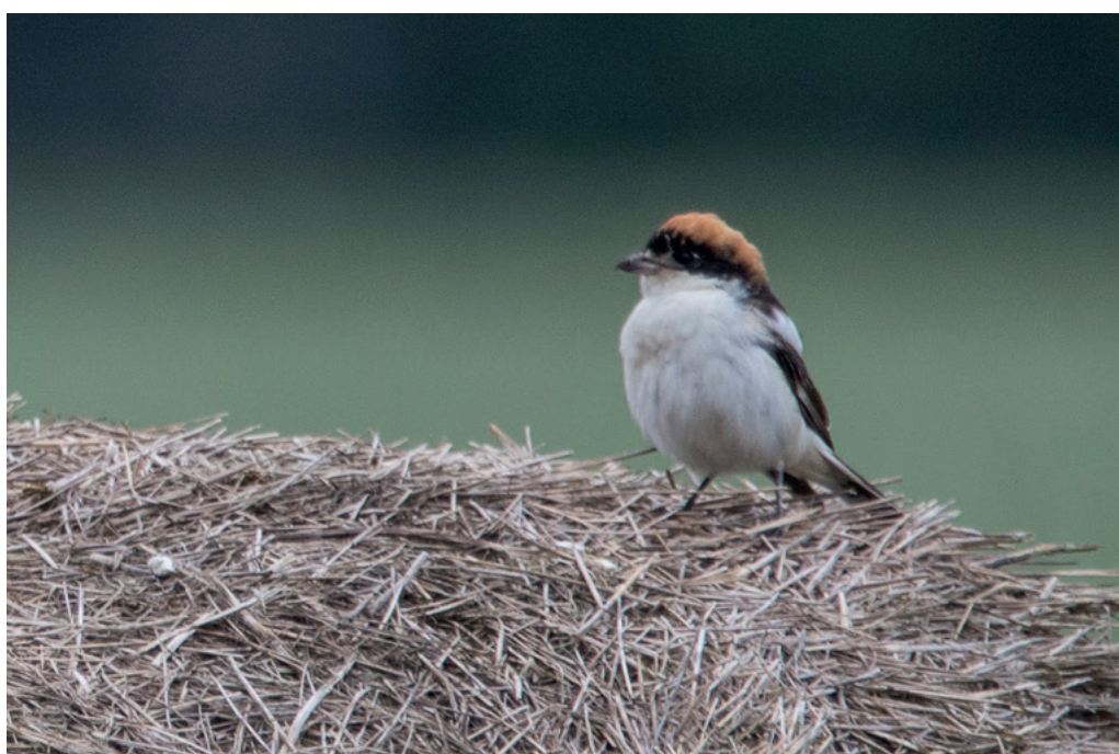
Abb. 10: Rotkopfwürger, Weibchen, Mögeln/HVL, Mai 2016. Fig. 10: Woodchat Shrike, female, Lanius senator .