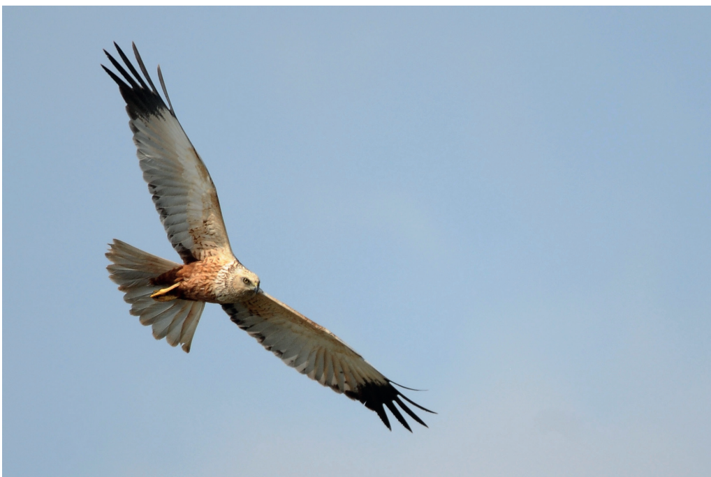
Abb. 8: Rohrweihe, Männchen, Reetz/PM, Mai 2016. Fig. 8: Western Marsh Harrier, male, Circus aeruginosus.