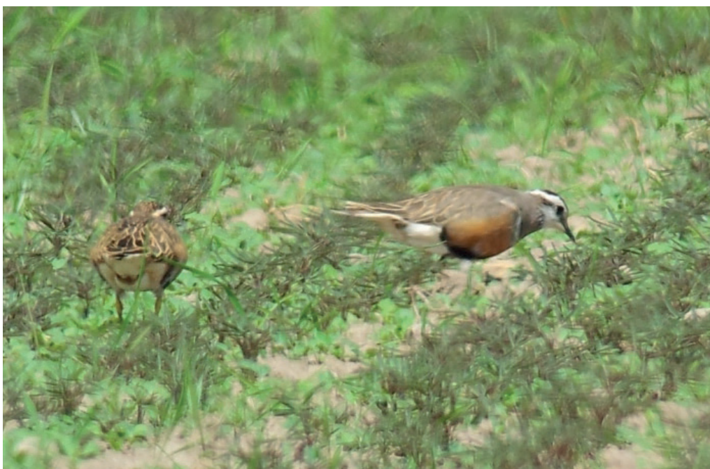
Abb. 3: Mornellregenpfeifer, Lübben/LDS, Mai 2016. Fig. 3: Eurasian Dotterel, Charadrius morinellus .

Großer Brachvogel Numenius arquata : Brut: in Brandenburg 35 Rev. (RYSŁAWY in Vorb.). Im Winter (Jan, Feb) keine Beob. Heimzug, Erstbeob.: 5. Mär 1 Havelnied. Parey (F.Drutkowski, N.Vilcsko, C.Neumann) * 8. Mär 1 Belziger Landschaftswiesen/PM (P.Schubert) * 10. Mär 1 Unteres Odertal Schwedt (DK). Heimzug, Gebietsmax. ab 5 Ex.: 1. Apr 5 Landwehr/LDS (S.Guth) * 2. Apr 13 Havelnied. Parey (R.Schneider) * 3. Apr 8 Jänschwalder Wiesen/SPN (D.Robel) * 6. Apr 7 Spaatzer Luch/HVL (K.Schulze) * 14. Apr 31 NSG Lietzengraben/B (C.Pohl, z.T. I.Pepper) * 31. Mai 10 Belziger Landschaftswiesen/PM (M.Detel). Wegzug, Gebietsmax. ab 10 Ex.: 3. Jul 12 Randowbruch Wendemark/UM (N.Vilcsko) * 4. Aug 17 dz. Elbe bei Hinzdorf/PR (S.Jansen) * 21. Aug 20 dz. Karthanenied. Klein Lüben/PR (S.Jansen) * 21. Aug 14 dz. Jungfernsee/P-B (L.Pelikan) * 26. Aug 17 dz. Alte Oder Schwedt/UM (JM) * 6. Sep 10 Lenzer Wische/PR (H.Schumann, I.Grunwald) * 11. Sep 49 Gülper See (N.Vilcsko, B.Kreisel) * 13. Sep 12 dz. Havelländisches Luch Garlitz/HVL (K.Hallmann)