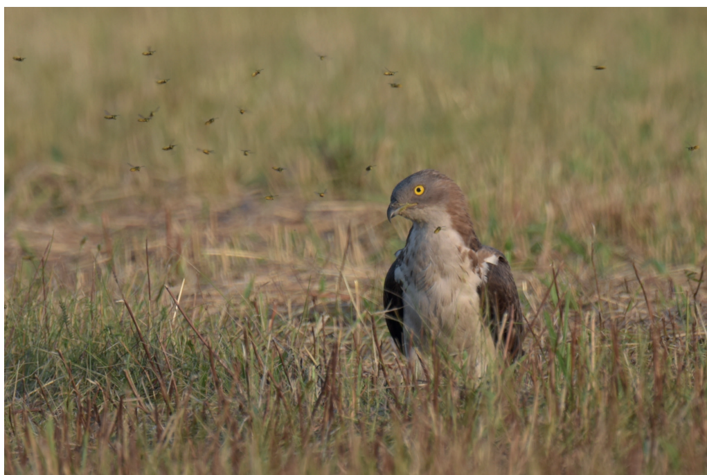
Abb. 6: Wespenbussard, Schiaß/TF, Juli 2016. Fig. 6: European Honey Buzzard, Pernis apivorus .