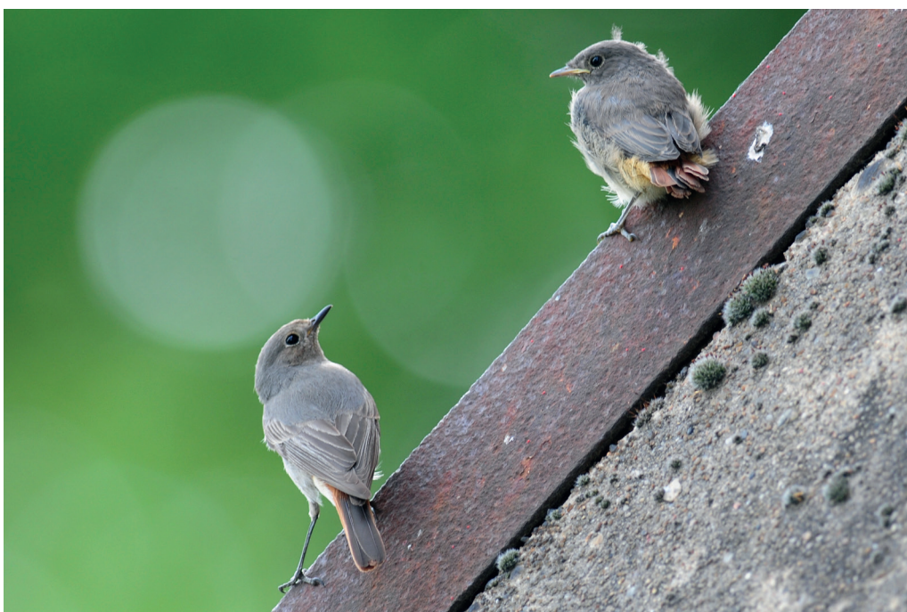
Abb. 13: Hausrotschwänze, Altvogel mit Jungvogel, Kleinrössen/EE, Mai 2016. Fig. 13: Black Redstarts, ad. with juv., Phoenicurus ochruros .

Hausrotschwanz Phoenicurus ochruros : Brut: 18 Rev./100 ha Stadtfläche Fürstenwalde/LOS (HH). Überdurchschnittliche Anzahl im Winter (Jan, Feb) : In Brandenburg im Jan 19 Ex. in 17 Gebieten und im Feb 11 Ex. in 9 Gebieten. In Berlin im Jan/Feb Überwinterungen/Versuche von 16 Ex. (BOA 2017a). Erstbeob. : wegen Überwinterer nicht abzugrenzen. Wegzug, Ans > 10 Ex. : 24.Sep 12 Bahnhof Schöneweide/B (R.Eidner) * 25.Sep 49 Solarpark Eiche/BAR und 14 Falkenberger Rieselfeld/B (R.Schirmeister) * 2.Okt 21 Hahneberg/B (C.Pohl) und 12