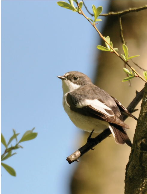
Abb. 12: Trauerschnäpper, Hohenwalde/FF, April 2016. Fig. 12: European Pied Flycatcher, Ficedula hypoleuca .

Trauerschnäpper Ficedula hypoleuca : Brut: 13 Rev./74 ha Wilhelmshorst/PM (T.Tennhardt). Sehr frühe Erstbeob. : 3.Apr 1 M Groß Machnow/TF (T.Teige) * 4.Apr 1 M Plessower See/PM (M.Schöneberg) und 2 M Hangelsberg/LOS (E.Wolf) * 5.Apr 1 M Park Sanssouci/P (W.Heim) und 2 M Dobbrikow/TF (F.Henschel). Letztbeob. : 12.Sep 1 Schlossinsel Köpenick/B (R.Schneider) * 14.Sep 1 Lankwitz/B (J.Kirsch) * 16.Sep 1 Tagebau Welzow-Süd/SPN (RB).