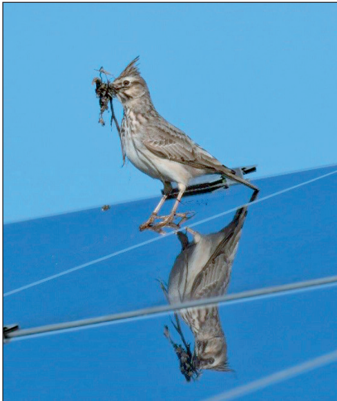
Abb. 4: In Einzelfällen besiedeln Haubenlerchen auch Standorte von Solaranlagen. Klein Schulzendorf/TF, März 2017.

In isolated cases the Crested Lark also occupies solar energy sites. Klein Schulzendorf/TF, March 2017.