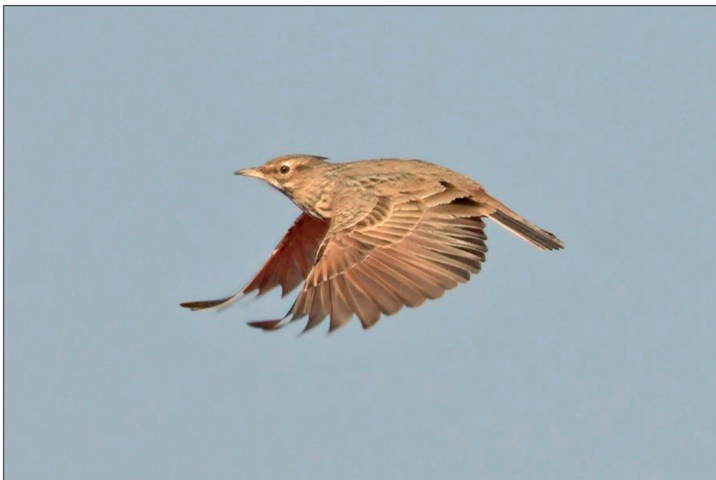
Abb. 1: Haubenlerche im Flug. Klein Schulzendorf/TF, Februar 2017. Crested Lark in flight. Klein Schulzendorf/TF, February 2017.