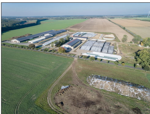
Abb. 3: Die Milchviehanlage in Lüdersdorf (Landkreis Teltow-Fläming) mit zwei stabilen/langjährigen Revieren der Haubenlerche, Oktober 2015.

Crested Lark territories in the control plots Lower Fläming/Luckenwalde. Defects are potentially (according to air photos) suitable breeding locations, which were monitored without result. Map and records: W. Suckow.