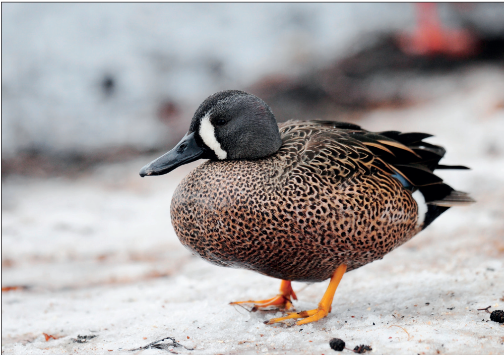
Abb. 1: Männliche Blaüflügelente Anas discors vom Wandlitzer See (Landkreis Barnim) am 31.12.2014. Male Blue-winged Teal Anas discors from the Wandlitzer See (Rural District of Barnim) on 31.12.2014.