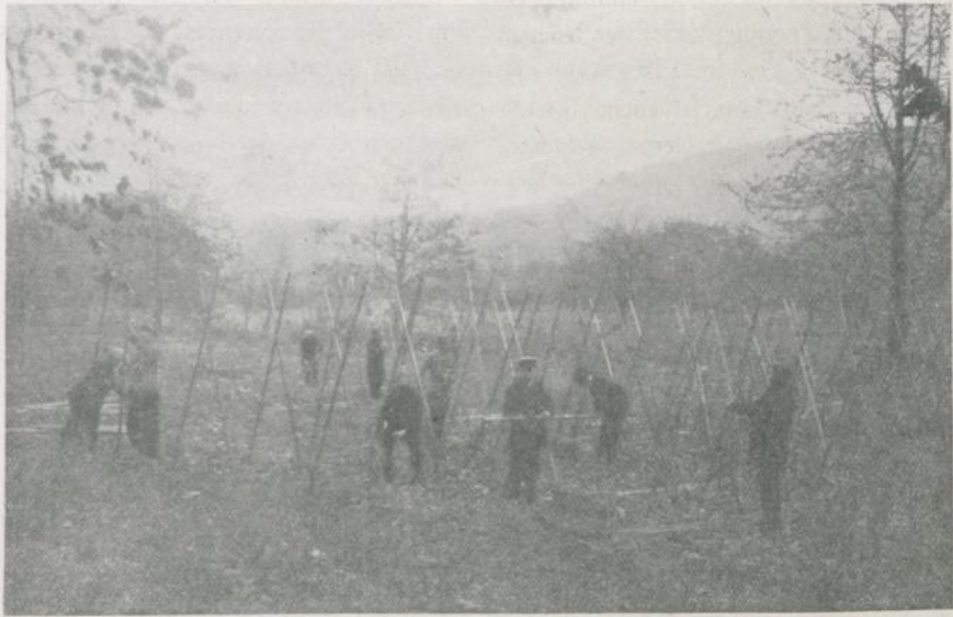
Zivilinternierte beim Bohnensetzen.

werden konnte. Das schönste Ergebnis haben, während sich die Internierten in dürften die von den Internierten in Ragaz Weesen rühmen können, in Bohnen und auf unfruchtbarem Ried- und Streuboden Kohl (Kabbis) eine Rekordernte erzielt zu angelegten Gemüsekulturen aufzuweisen haben.