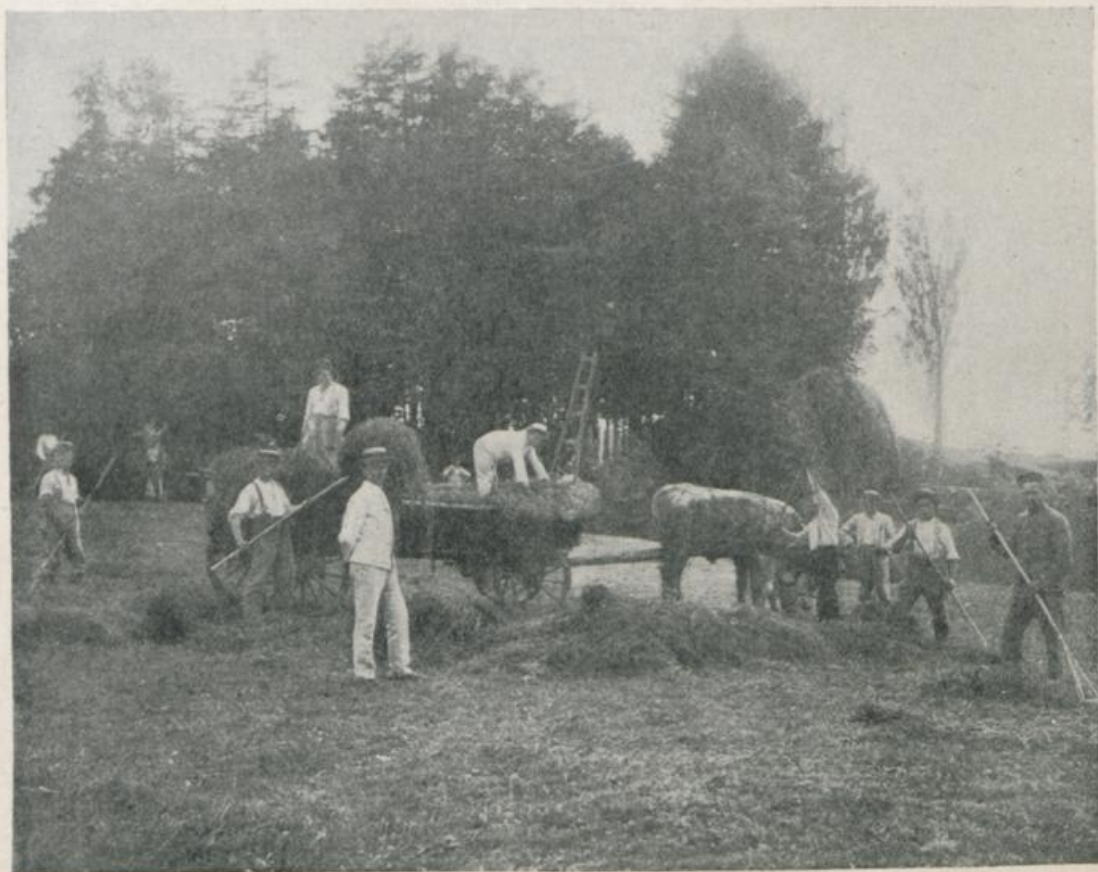
Beim Einbringen des Heues.

In der Landwirtschaft trat der Mangel an Arbeitern vor allem in der Erntezeit zu tage. Da es sich dabei nur um eine mehrwöchentliche Aushilfe handelte, die auch von nicht gelernten Arbeitern geleistet werden konnte, dachte man vor allem an die Studierenden unter den Internierten. Da ihre Ferien mit der Erntezeit zusammenfallen, wurden sie durch ihre Verwendung bei den Erntearbeiten nicht einmal von ihrer gewöhnlichen Arbeit abgezogen und die Arbeit in freier