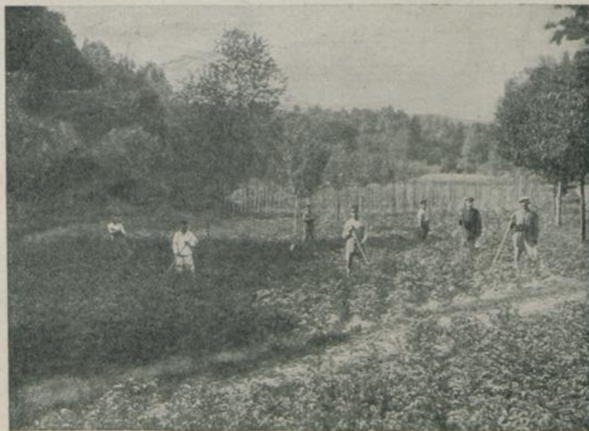
Bad Schinznach — Internierte bei der Gartenarbeit.

der das ringsum brandende Völkerringen die Schweiz nötigt, den empfindlichsten Mangel an Ar- beitskräften ge- zeitigt. Daneben aber verlangten die gesteigerten Anforderungen, die der Krieg an das wirtschaft- liche Leben auch der Schweiz stellt, dringend nach neuen Hilfs-