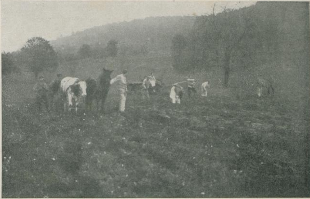
Bad Schinznach — Internierte bei der Bestellung der Wintersaat.

dem sie freudig ans Werk gingen, die Lücken auszufüllen, die die Auflagen des Krieges in den für das Land notwendigen Arbeitskräften aufgerissen haben. Im Einverständnis mit der schweizerischen Regierung hat die deutsche Regierung bei ihren