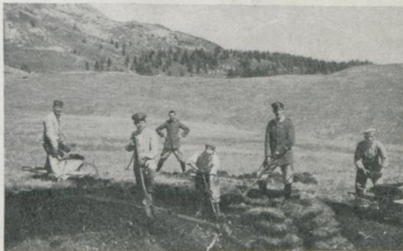
St. Moritz — Die ersten Spatenstiche.

Den meisten dieser Arbeiten hat der heranahende Winter ein Ende gesetzt. Aber wo immer die deutschen Internierten im Dienst der Schweiz tätig waren, begleitete