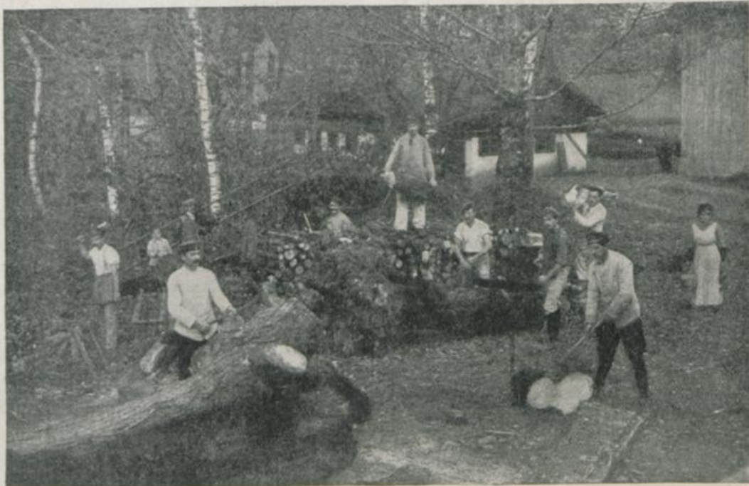
Internierte als Holzfäller bei der Arbeit.

Notwendigkeit jede andere Art von Beschäftigung der Internierten zurücktreten muß. Allerdings bringt es die Schwere der zu leistenden Arbeit in den heißen Mooren,