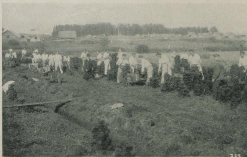
Das Trocknen des Torfes.