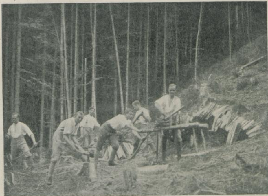
Die internierten deutschen Studenten der Handelshochschule in St. Gallen beim Büscheli-Schneiden in Steinegg.

häufig be- droht von ausströ- menden ge- sundheits- schäd- lichen Gasen, mit sich, daß nur voll- kommen gesunde und an schwere körperliche Arbeit ge- wöhnte da- zu verwen- det werden können.