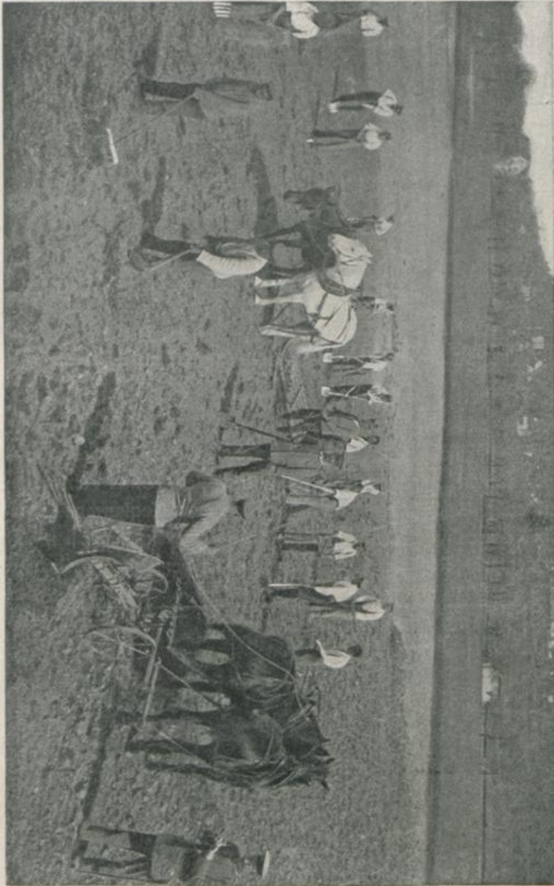
Buochs — Urbarmachen von Schwemmboden für Kartoffel- und Gemüsekulturen.