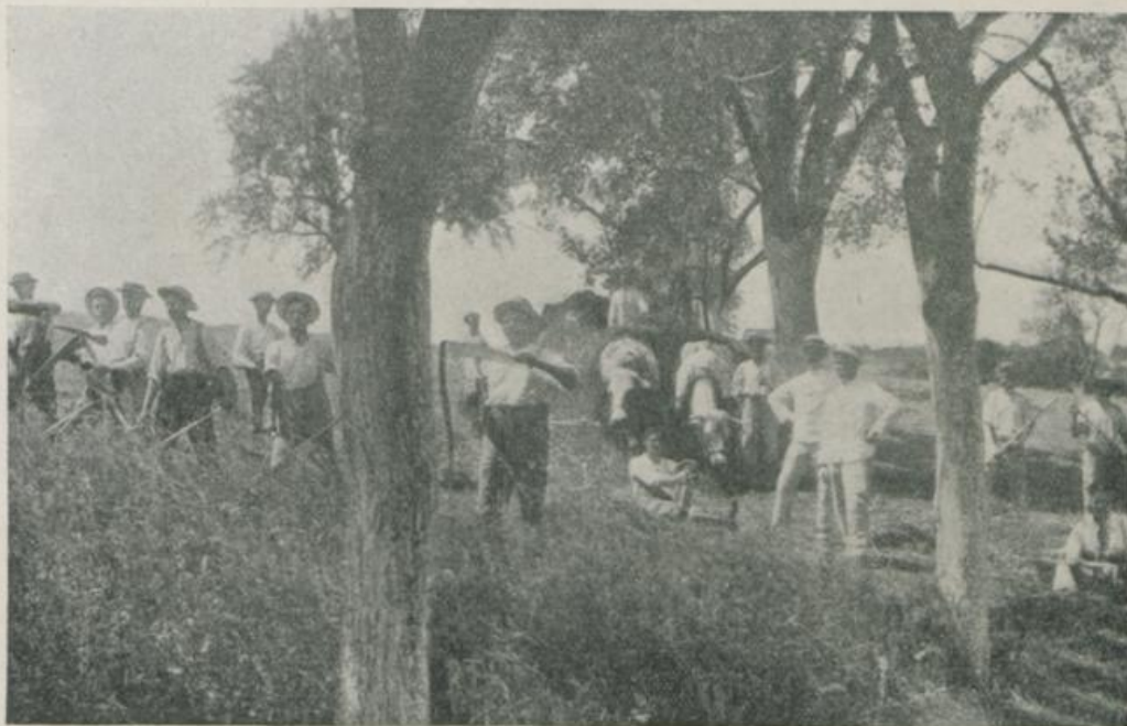
Internierte bei der Heuernte in Ermatingen.

der das ringsum brandende Völkerringen die Schweiz nötigt, den empfindlichsten Mangel an Ar- beitskräften ge- zeitigt. Daneben aber verlangten die gesteigerten Anforderungen, die der Krieg an das wirtschaft- liche Leben auch der Schweiz stellt, dringend nach neuen Hilfs-