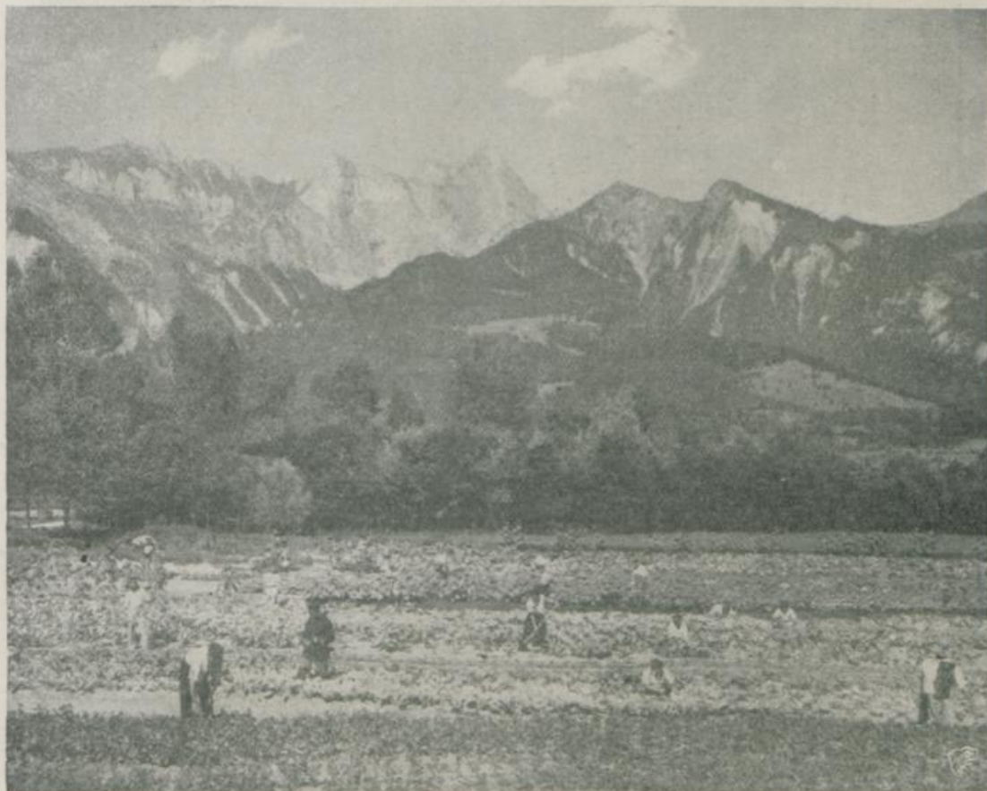
Die von den deutschen Internierten bei Ragaz angelegten Gemüsekulturen.

Ungleich wichtiger für die Allgemeinheit war jedoch die Hilfe der Internierten bei der Brennstoffversorgung. Neben der in erweitertem Maße nötig gewordenen Verwertung der reichen Holzbestände galt es vor allem durch Abbau der reichen Torflager die mangelnde Kohle zu ersetzen. Hierfür