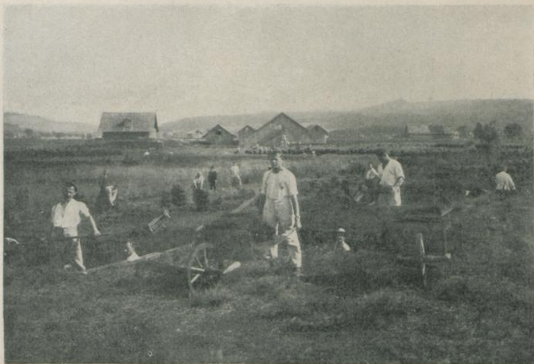
Harte Arbeit im Moor.