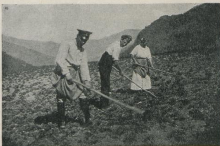
Klosters — Kartoffelernte.

Luft konnte nur ein wünschenswertes Korrektiv gegen die sonstige sitzende Lebensweise sein. So zogen sofort nach Schluß Schüler und Lehrer der Techni-