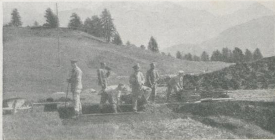
Die Schüler der Handels- und Bergschule für deutsche Internierte in Chur beim Torfstechen im Engadin.

und willige Arbeiter gewesen, die sich geschickt in die Arbeit einlebten und bescheiden waren. Die Engadiner Bauern werden ihnen ein