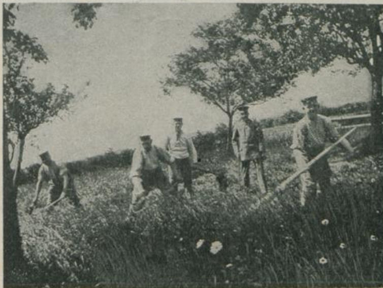
Bad Sonder — Die feldgrauen Helfer bei der Heuernte.

dort die Lücken auszufüllen, wo schaffende Hände am meisten fehlten, in der Landwirtschaft, bei Gartenarbeit und im Obstbau. Hier hat die erhöhte militärische Bereitschaft, zu