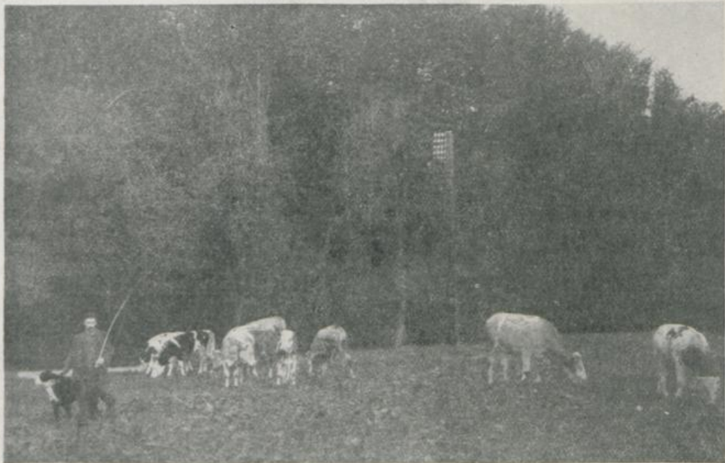
Deutscher internierter Stallschweizer und seine Pflegebefohlenen.

werden konnte. Das schönste Ergebnis haben, während sich die Internierten in dürften die von den Internierten in Ragaz Weesen rühmen können, in Bohnen und auf unfruchtbarem Ried- und Streuboden Kohl (Kabbis) eine Rekordernte erzielt zu angelegten Gemüsekulturen aufzuweisen haben.