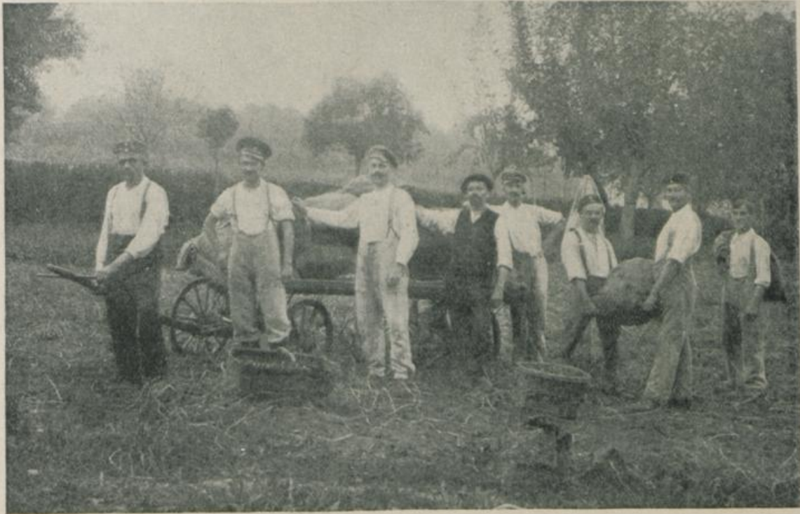
Die Kartoffelernte in Bad Schinznach.

Der Fleiß der jungen Landwirte war an manchen Orten durch eine weit über dem Durchschnitt stehende Ernte belohnt, so in Walzenhausen, Bad Schinznach, Weesen