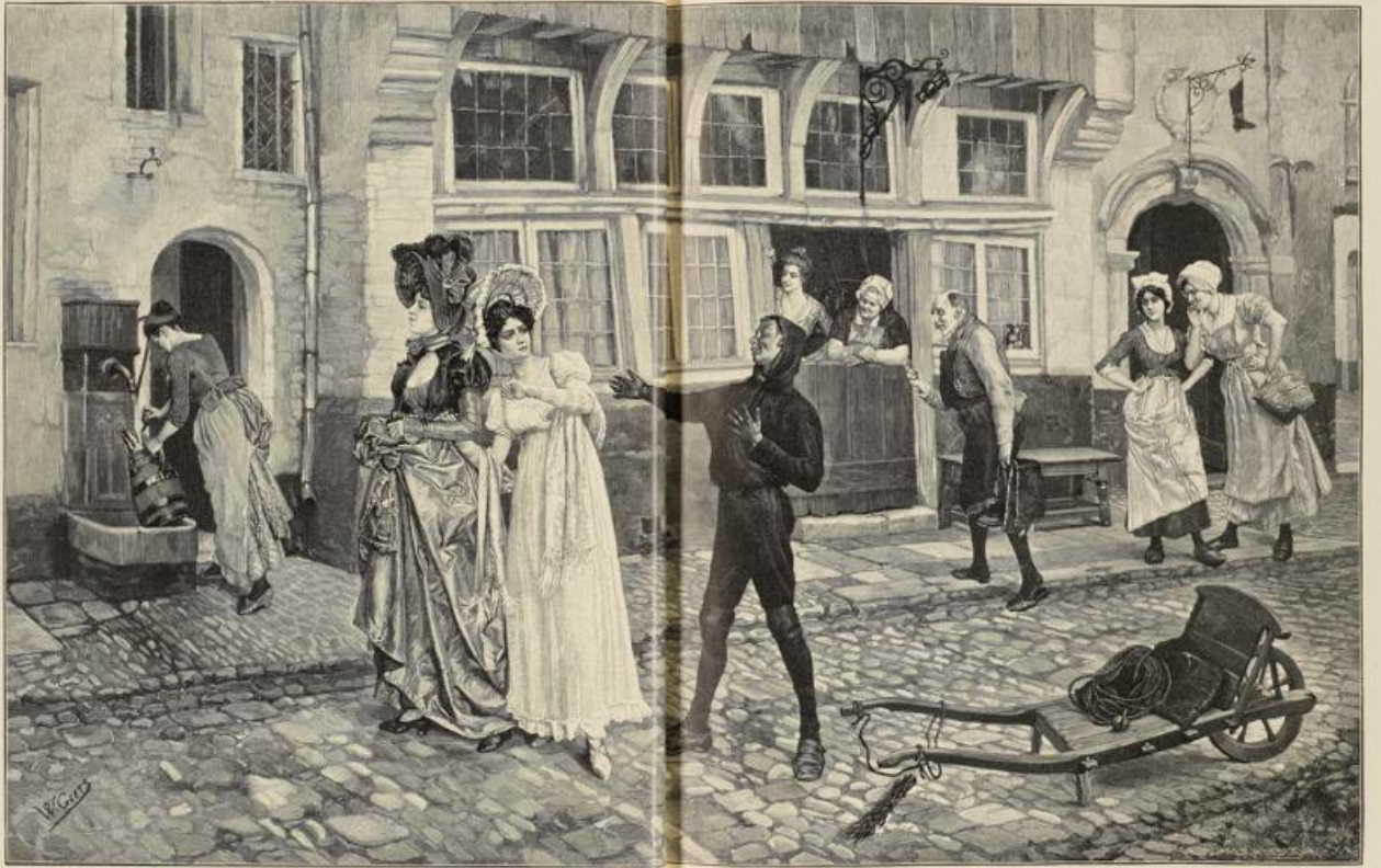
Berlin: Liebesmüß. Illustration von W. Gutz.