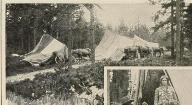
Auf der Wanderung.

zwei Stichproben, an denen wir es uns wohl genügen lassen können.