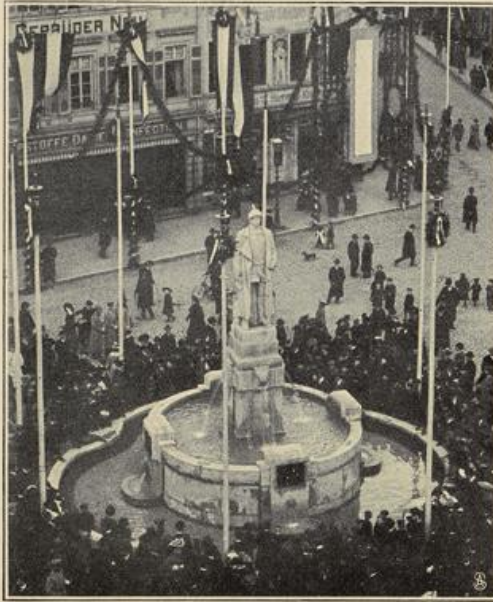
Reliefs am Sockel.

784) Ein greiser Vater bangt sich um das Schicksal seines Sohnes, des