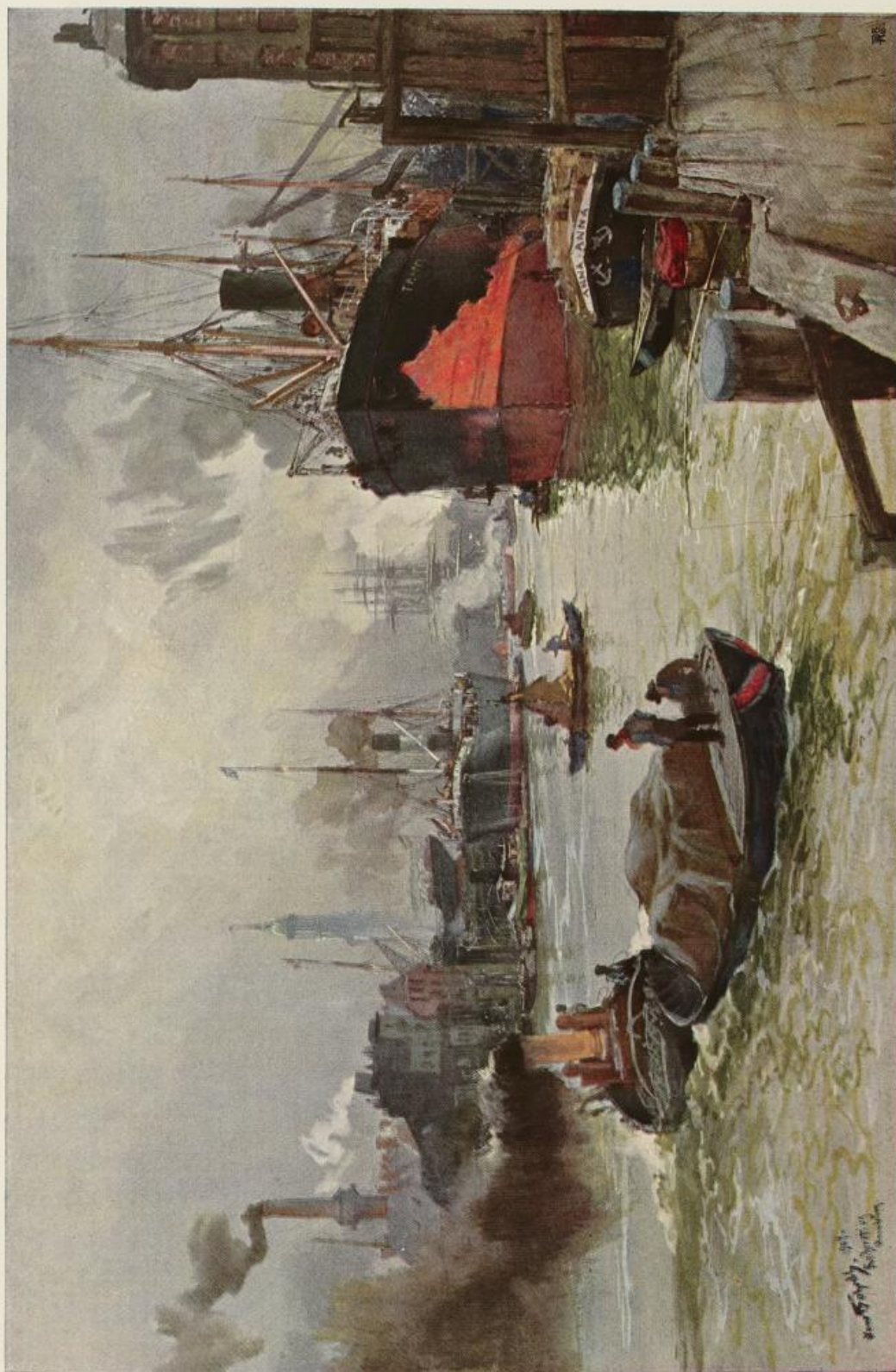
Am Reiherstieg in Hamburg. Gemälde von Hans Bohrdt.