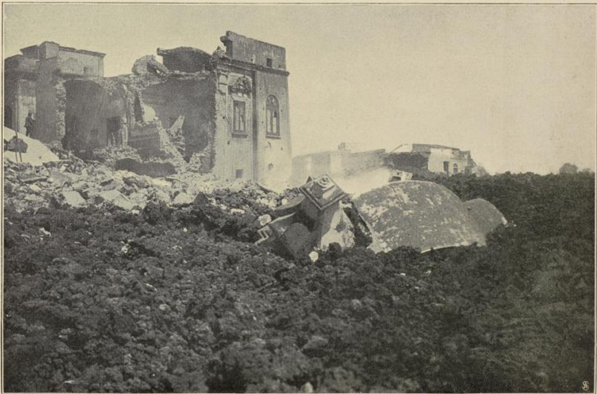
Ruine eines Palais in Boscotrecase am Vesuv.

Nach langem Kampfe zwischen der Krone und der Parlamentsmehrheit in Ungarn ist Anfang April in der Wiener Hofburg ein Friedensschluß