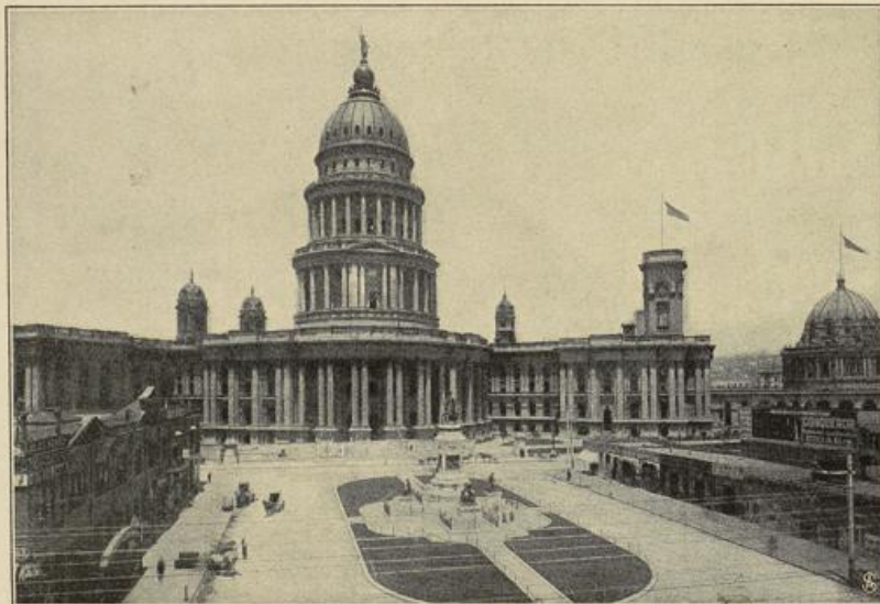
Das neue Stadthaus in San Francisco vor der Zerstörung.

deutung eine tiefe Lücke gerissen worden. Ein Unfall hat dies unendlich tätige Leben unerwartet am 19. April abgeschlossen. In Paris, wo er gestorben, wurde Curie im 1859 als Sohn eines Physikers geboren. Des Lebens ähneren Glanz hat der Gelehrte nicht empfunden, in dieser bescheidenen stillen Natur war nichts größer als die Hingabe an die Wissenschaft. Und in seiner Gattin, einer polnischen Studentin in Paris, die er 1897 heiratete, wurde ihm eine Gefährtin beigegeben, die ihm, dem Findfunder, in treuer Mitarbeiterchaft zur Seite ging. Das Jahr 1898 brachte den beiden Forschenden die Frucht rastloser Arbeit und bereicherte mit der Entdeckung des Radiums die Wissenschaft um einen ungeheuren wichtigen und kostbaren Faktor. Ehren und Ehrungen fluteten zu den Erfindern, aber sie machten Halt vor ihrer Bescheidenheit, das Kreuz der Ehrenlegion lehnte Curie ab, er verwies dabei auf die wertvolle Mittätigkeit seiner Frau. Den ihnen im Jahre 1903 verliehenen Nobelpreis verwandten sie vollständig zur Anschaffung neuer Apparate für weitere Experimente. So ist der Tod des verdienten Mannes ein unerklärlicher Verlust, für seine treue Lebensgefährtin, die Wissenschaft und die Welt. Aber sein Name wird durch alle Zeiten gehen.