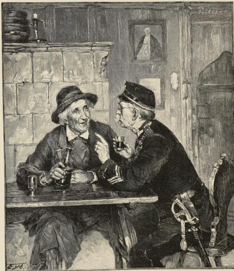
Beim Noten. Gemälde von Fr. Proh.

Die beiden Kinder waren über diesen Umstand nur wenig betrübt, so konnten sie Herrn Gerold nun wieder ganz für sich in Beschlag nehmen, und das schien ihnen