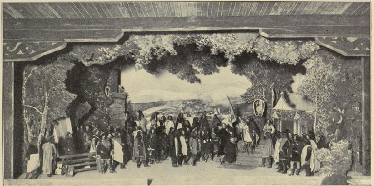
Berlehung der Reichssturmfahne. Von den Hohentwielspielen.