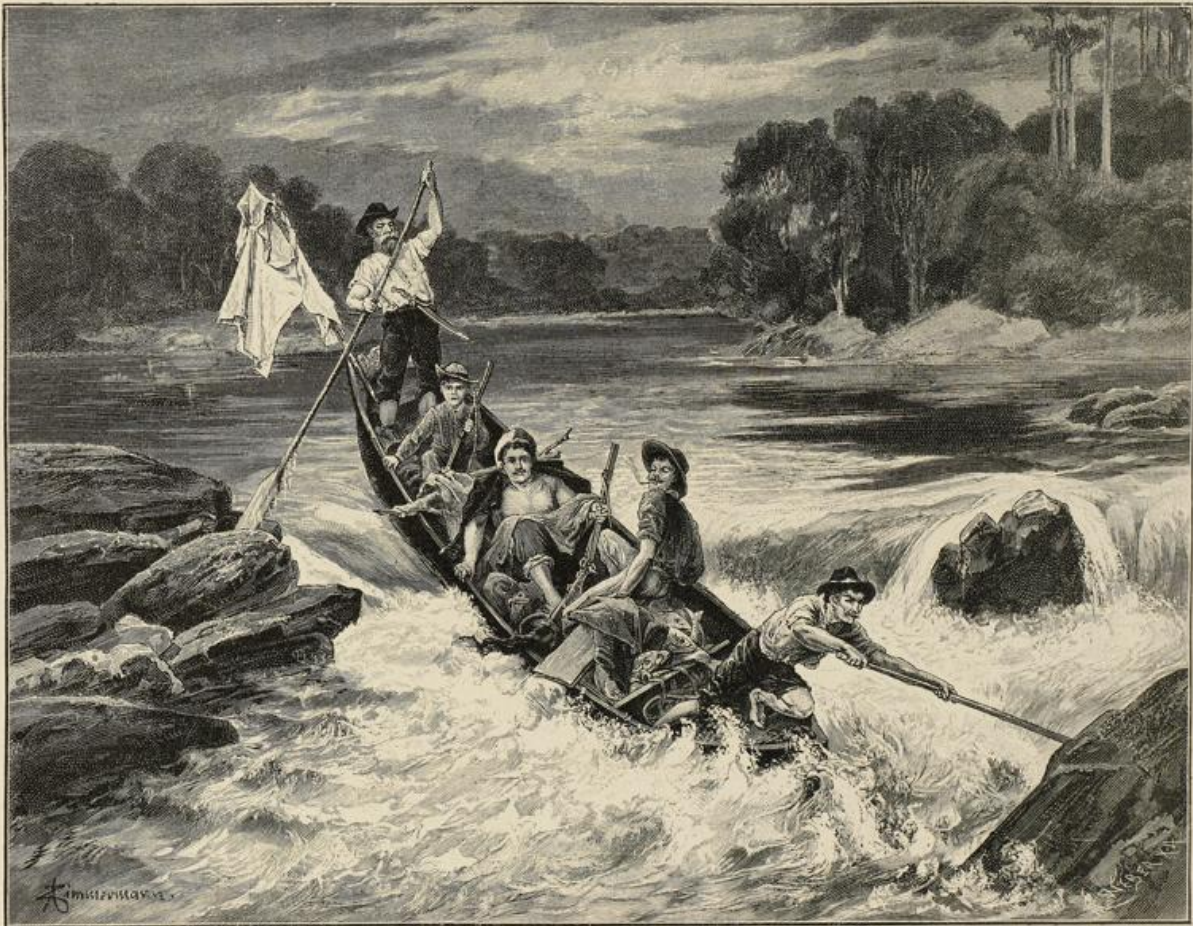
An der Stromschnelle.

Also los! Die Jacke herunter, die Hosen aufgetrempelt, in die eine Hand die Fischgabel oder in deren Ermangelung das lange Waldmesser, in die andere die Fackel, und während die einen von uns mit Hilfe des Boots die lange Grundangel von einem Ufer des Flusses zum anderen legen, hüpfen wir anderen ins Wasser. Da heißt's aber springen und aufpassen! Von Stein zu Stein, über breites, schäumendes Wasser muß man setzen, nach den Fischen spähen und blitzschnell, wo sich einer zeigt, zutreten, denn sie warten nicht. So ein Fischstechen ist auch ein Sport, und man kann es auch in ihm zur Meisterschaft bringen. Da war unter uns ein junger Bursch, ein langbeiniger, der kannte das; auch die Steine unter dem Wasser „kannte er schon alle auswendig“, und so langte er dahin mit einer Sicherheit, die