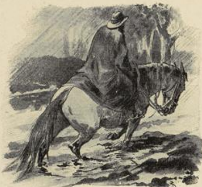
Ritt durchs Wasser.

„Laß das Tier bei mir im Stall, da hat es Mais, und nachher kann es rausgehen in das kleine Pilet, ein bißchen Gras fressen und sich wälzen, und jederzeit kannst du wieder satteln!“