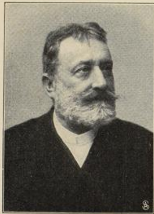
Ferdinand von Saar †.

Das Jubiläum der Anilinfarben. Von alters her benutzten die Menschen den Teer zu allerlei Dingen, zu konservierendem Anstrich von Holz, zu Wagenmähre und dergleichen.