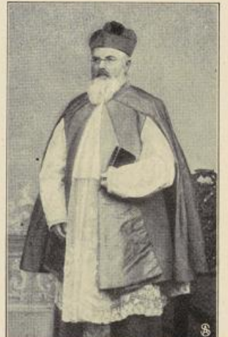
Johann Martin Schleyer, Erfinder der Weltsprache Volapük, feiert seinen 75. Geburtstag.

Unter der Leitung des deutschen Lehrmeisters in London arbeitete aber auch ein genialer junger Engländer William Henry Perkin; er stellte sich die Aufgabe, das kostbare Chinin künstlich zu erzeugen. Dabei arbeitete er auch mit dem Anilin, und als er es mit Chromsäure behandelte, erhielt er einen schwarzen Niederschlag. Er untersuchte ihn näher und fand, daß er sich in Spiritus mit prachtvoller violetter Farbe auflöste; nun tauchte Perkin einen Seidenfaden in diese Lösung und sah, daß der Stoff die Farbe trefflich annahm.