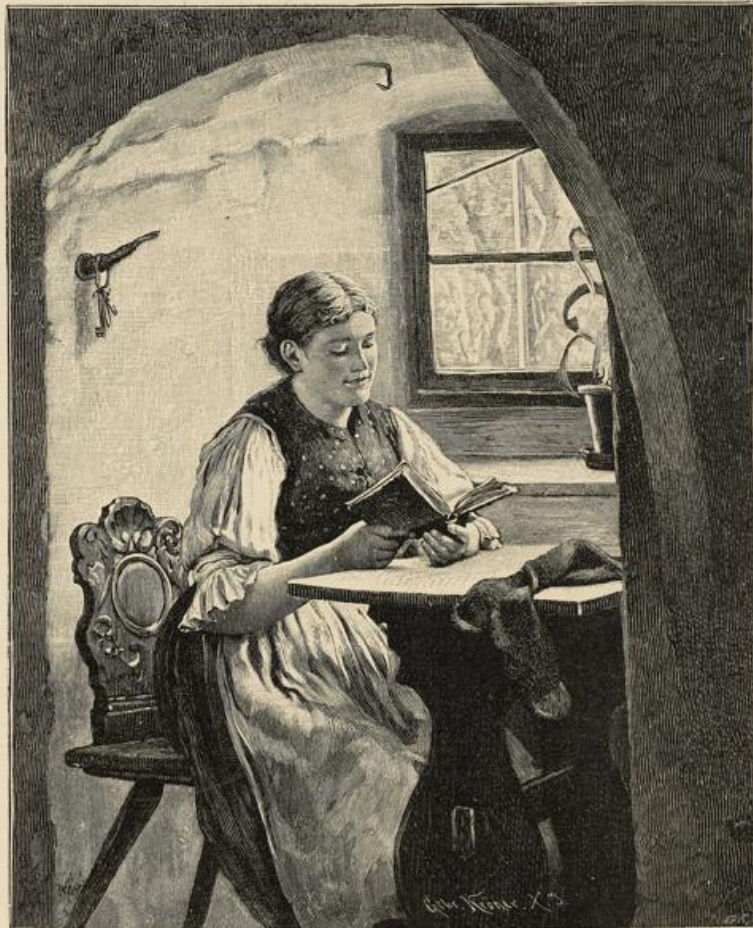
Erbauungstunde. Gemälde von G. Rau.

Er trat in einen der kleinen Läden am Hafen, kaufte ein