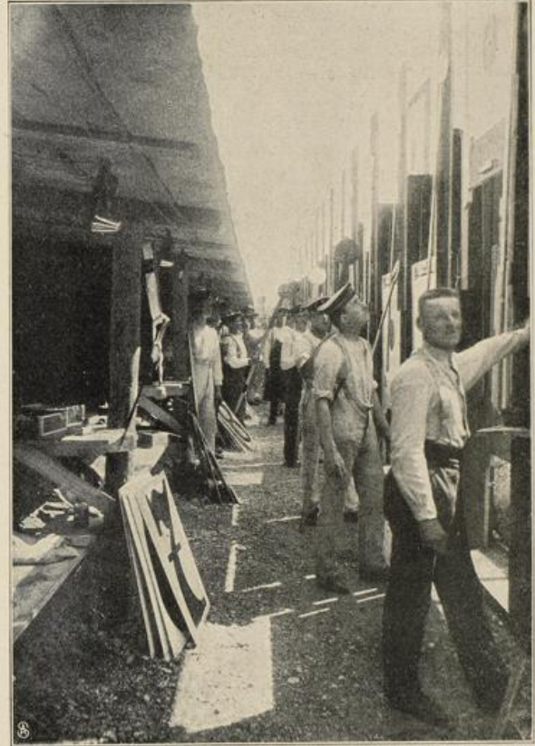
Im Zielergraben der Festschieße

Die Rembrandt-Statue in Leiden. (Zu der Abbildung auf vor- setzender Seite.) Ähnlich wie im Jahr 1905 von der gesamten Kulturwelt an seinem 150. Todestag die Erinnerung an Schiller einmütig gefeiert wurde, so fanden sich jetzt überall dankbar und freudig gestimmte Seelen zusammen, die dem Genius Rembrandts zu des Künstlers 300. Geburts- tag am 15. Juli ihre Huldigung brachten. Rembrandt-Feiern ohne Zahl — überall das Bemühen, diesen Größten unter den Größten