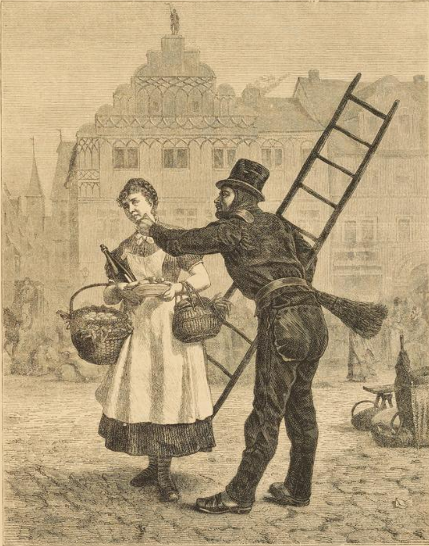
Wethros. Nach dem Bilde von Tegner.

eisert. Schade nur, daß man noch immer diese Farben nicht zu konserviren im Stande ist; wer sich davon einen Begriff machen will, muß nicht die Fischgläser unserer Museen, sondern ein einschlägiges Werk mit kolorirten Abbildungen, z. B. den vorzüglichen 2. Band des „Journal des Muséum Godeffroy“ durchblättern.