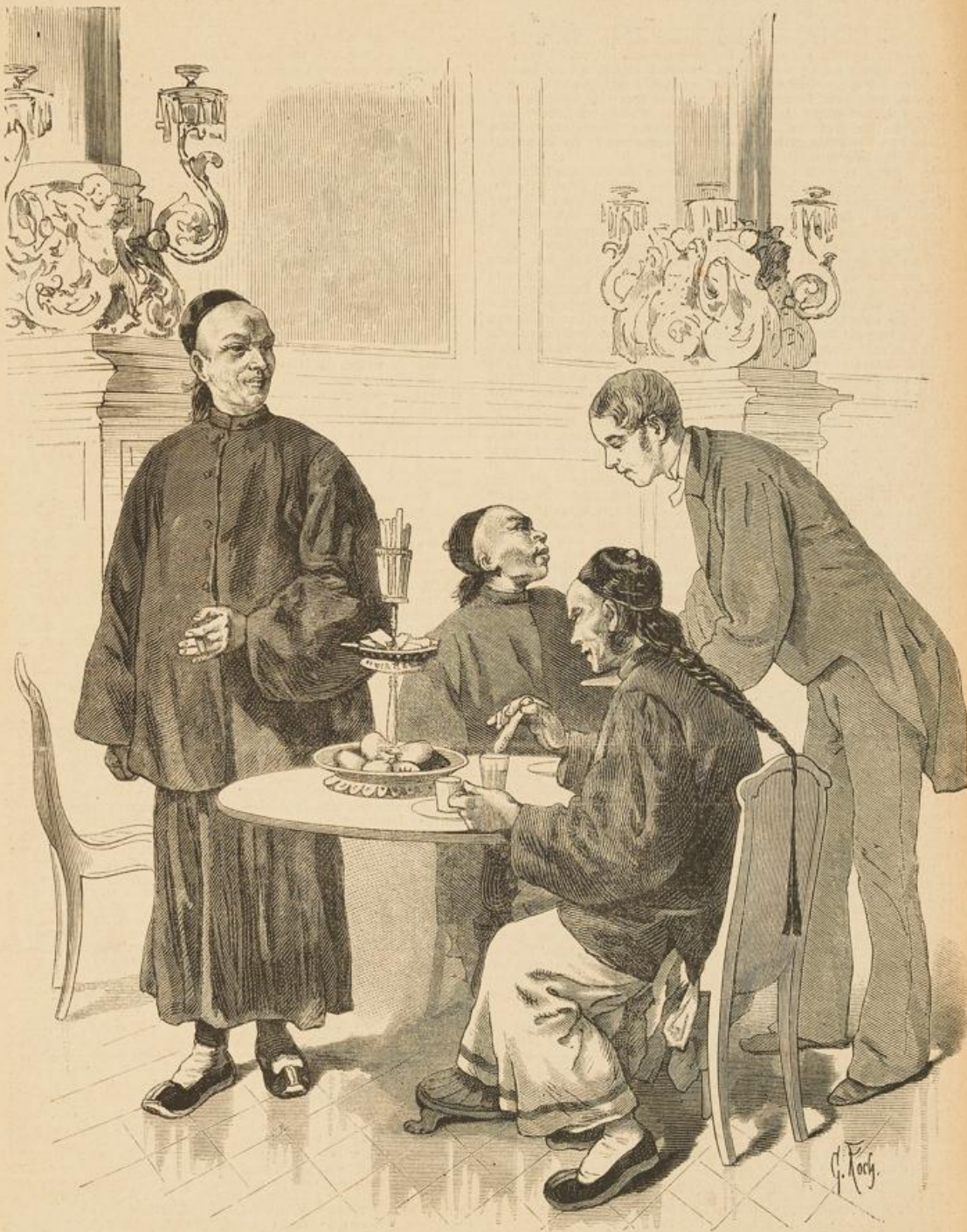
Mitglieder der chinesischen Gesandtschaft im Café Bauer zu Berlin. Nach dem Leben von G. Koch.