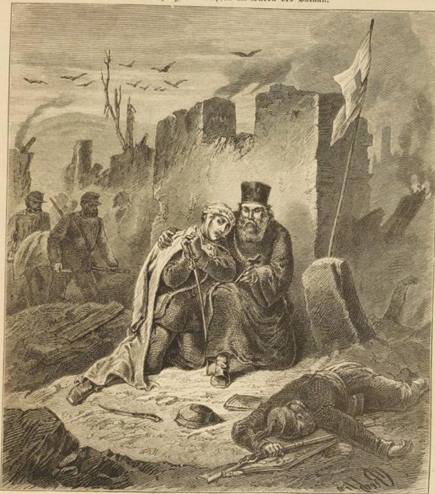
Das letzte Gebet Eines vom Regiment Probrashenst.

Ans den jüngsten Kämpfen im Süden des Balkan.