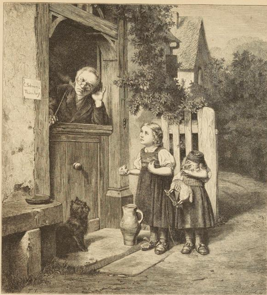
Beim Thierarzt. Originalzeichnung von Sonderland.

„Ich habe auch schon an ihn gedacht, aber er ist noch jung und hat noch keine hohen Ehren erlangt. Er ist daher jetzt noch nicht vollkommen werth, in meine Familie einzutreten. Aber,“ fügte er hinzu, „da Ihr Herren alle denkt, daß er einen possenden Mann für meine Tochter abgeben würde, so mögt Ihr die Sache ihm gegenüber erwähnen. Nur muß ich sicher sein, daß Ihr sprecht, als wenn es allein von Euch ausginge. Ihr werdet dann seine wahren Gefühle erkennen.“