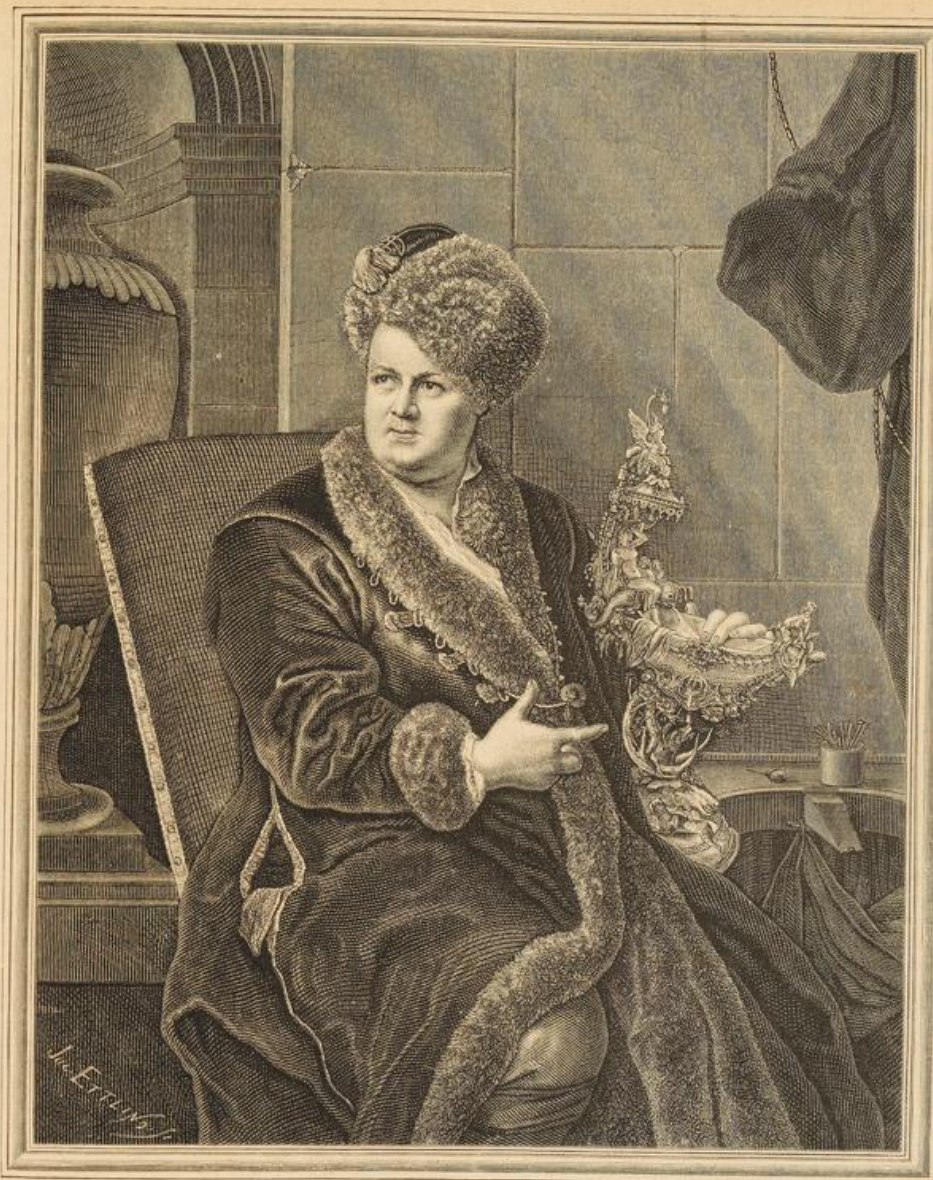
Johann Melchior Dinglinger, der Meister des grünen Gewölbes.