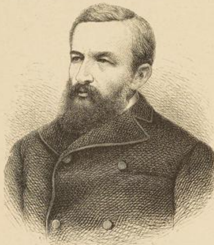
Philipp Reis. Nach einer Photographie.

Philipp Reis ward am 7. Januar 1834 zu Gehlhäusen als der Sohn eines Bäckers geboren; er besuchte die Volksschule seiner Vaterstadt, wo die Lehrer seine außergewöhnliche Begabung erkannten und dem Vater rathen, den Sohn in eine höhere Lehranstalt zu schicken. So kam er in das Garnierische Institut zu Friedrichsdorf bei Homburg, dann in eine Frankfurter Privatschule, wo sich seine naturwissenschaftlichen Neigungen entwickelten. Der Vormund ging auf den Plan des Jünglings, Naturwissenschaften studiren zu wollen, nicht ein und brachte