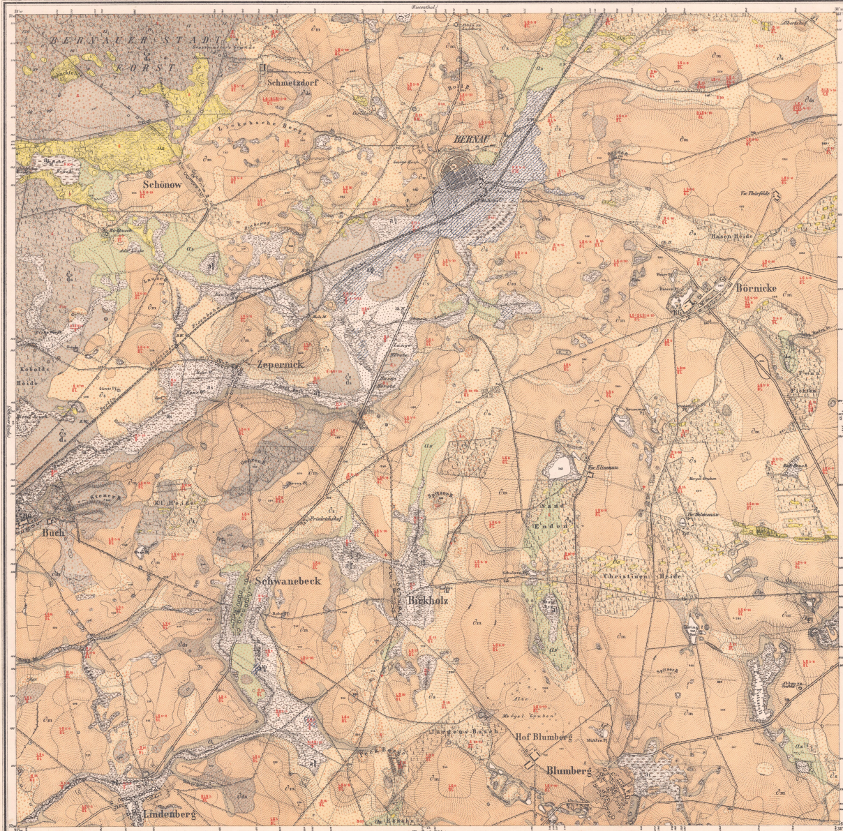
Aufgenommen v. Königl. Preuss. Generalstab 1870-71. Einische Measuring 1881. Maafstab 25,000 der natürlichen Länge. Geognost. u. agronom. aufgenommen durch E. Lauffer.