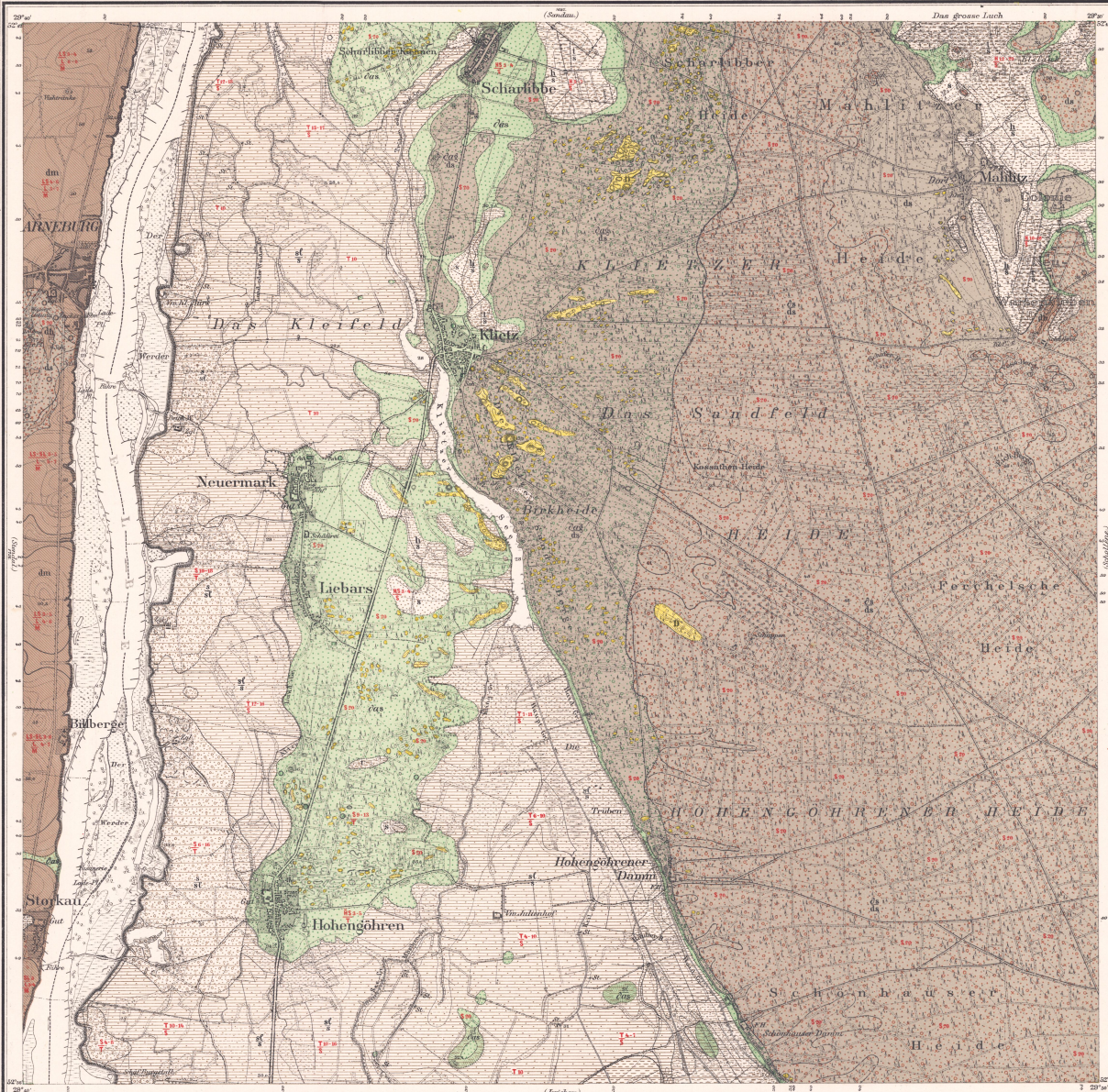
Topog. ausgef. x. König. Preuss. Generalstab 1880. Bei den geol. Aufnahmen ergänzt 1882.